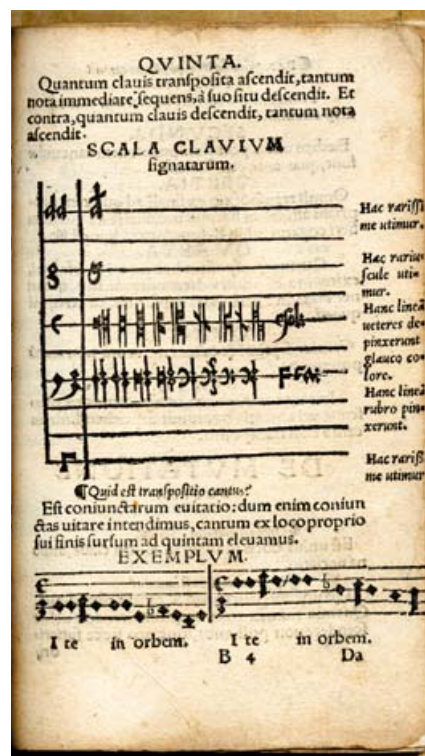
Johann Spangenberg: Quaestiones musicae in usum scholae northusianae Tisk / Print, Johann Petreius, Nürnberg, 1536 (1. vydání / 1st printing); tabulka klíčů / table of clef signs (fol. B4r) NM-ČMH D 58 / přív. 1

[Martin Agricola: Rudimenta musices ], Georg Rhau, Wittenberg. [1. vydání] 23 fol. (chybí prvních 8 folií), 8° RISM B VI 1 , s. 69–71: uvedeno 11 exemplářů, v ČR žádný; sign. NM-ČMH D 81 srovnána s http://www.chmtl.indiana.edu/tml/16th/AGRRUD_TEXT.html [cit. 2011-07-01]