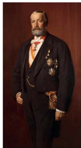
Portrét Jana Nepomuka Františka hraběte Harracha od Františka Ženíška, olej na plátně, 1896 (Národní muzeum)