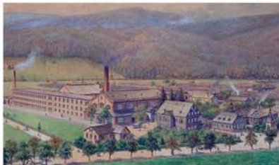
Huta Szkla "Nový Svět" na akwreli Franciszka Skopalika, 1898 Glassworks Nový Svět on watercolor by František Skopalík, 1898 Glashütte Nový Svět auf Aquarell von František Skopalík, 1898