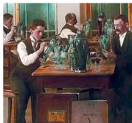
Malarze malujący na szkle, w hucie szkła w Harrachowie, kolorowy slajd Józefa Vejnar, prawdopodobnie z 1904 roku Glass painters in glassworks Harrachov, colored diapositive by Josef Vejnar, probably from 1904