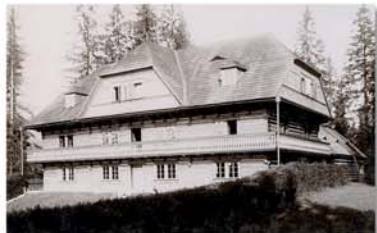
Zamek Harracha w Harrachowie około 1895 roku Harrachs castle in Harrachov around 1895 Harrachs Schloss in Harrachov um das Jahr 1895