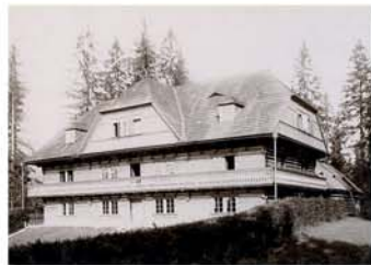
Harrachův záměček v Harrachově kolem roku 1895