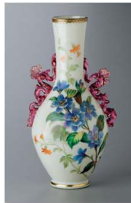
Váza z původního vybavení jilemnického zámku, sklárna Nový Svět, 1885 (Krkonošské muzeum v Jilemnici)