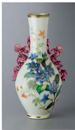
Wazon z oryginalnego wyposażenia zamku w Jilemnicy, huta szkła Nový Svět 1885 Vase from the original furnishings in castle of Jilemnice, glassworks Nový Svět, 1885 Vase aus ursprünglicher Ausstattung in Schloss Jilemnice, Glashütte Nový Svět, 1885