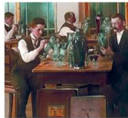
Malíři skla v harrachovské sklárně, kotořovaný diapozitiv Josefa Vějnara, pravděpodobně z roku 1904 (Krkonošské muzeum v Jilemnici)

Zřizovatelé: Národní muzeum – Matice česká, sekce Společnosti Národního muzea, ve spolupráci s Krkonošským muzeem v Jilemnici (Správa KRNP) a město Harrachov – duben 2017. Typografie, tisk: FAST digital print studio s. r. o., Praha 10 Kontakt: Matice česká, Václavské náměstí 68, 115 79 Praha 1, tel. 224 497 333, matice_ceska@nm.cz