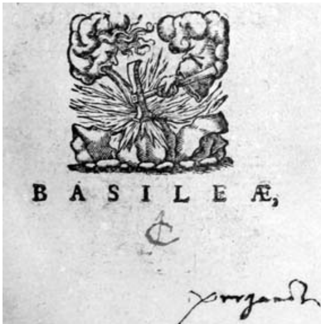
Monogram „JC“ vepsaný ve spodní části titulního listu, který Johannes Crato z Crafftheimu s oblibou užíval na místo exlibris. – Nostická knihovna dg 705

tes Peter Monavius (1551–1588) und 7 Bände des polnischen königlichen Arztes Gallus Chraplewski (†1622). Aufgrund der Tatsache, dass die meisten dieser Büchersammlungen nicht nur im schlesischen Gebiet entstanden und gesammelt wurden, sondern auch Angehörigen derselben Berufsgruppe gehörten, enthalten zahlreiche Bücher mehrere Provenienzeinträge von verschiedenen Besitzern aus dem Kreis der schlesischen Ärzte. Die Einträge beweisen sowohl Wege der Bücher, die vom Besitzer geschenkt oder nach seinem Tode verkauft und zerstreut wurden, als auch eine abermalige Sammlung der einst zerstreuten Bände. Dank der laufenden Provenienzforschung in den in- sowie ausländischen Bibliotheken wurden bereits zahlreiche Bände mit den Büchern der Nostitzbibliothek entsprechender Provenienz entdeckt. Am wichtigsten ist in dieser Hinsicht die Universitätsbibliothek in Breslau, wo schon mehr als 2.300 Bücher mit relevanten Provenienzeinträgen festgestellt wurden.