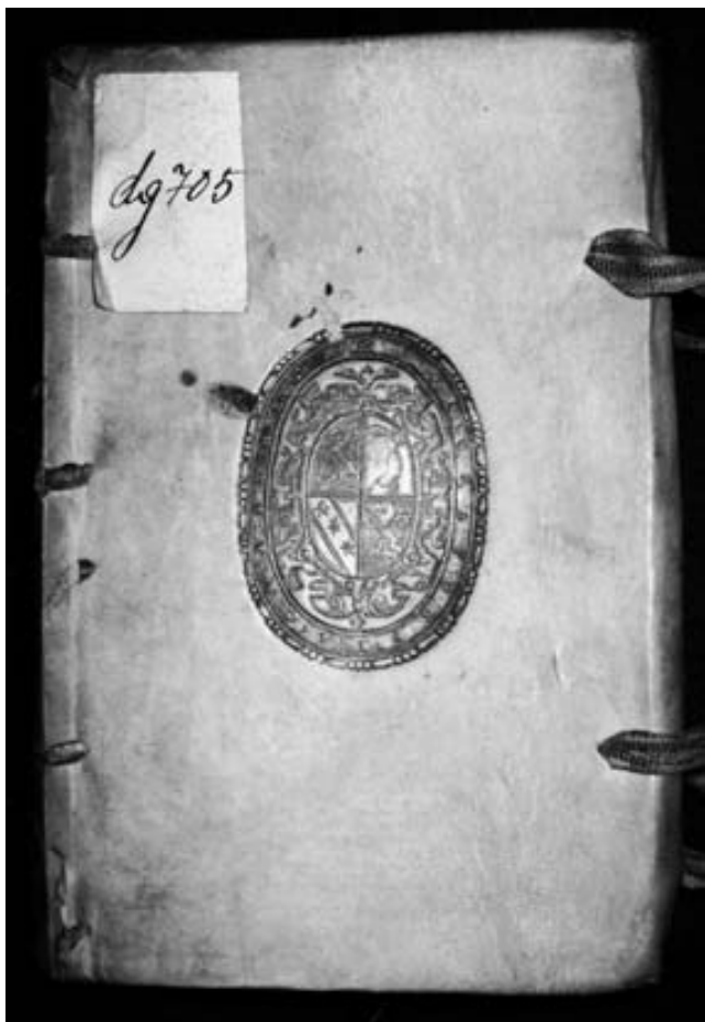
Nedatované supralibros Johanna Cratona z Craffiheimu na přední desce. – Nostická knihovna dg 705