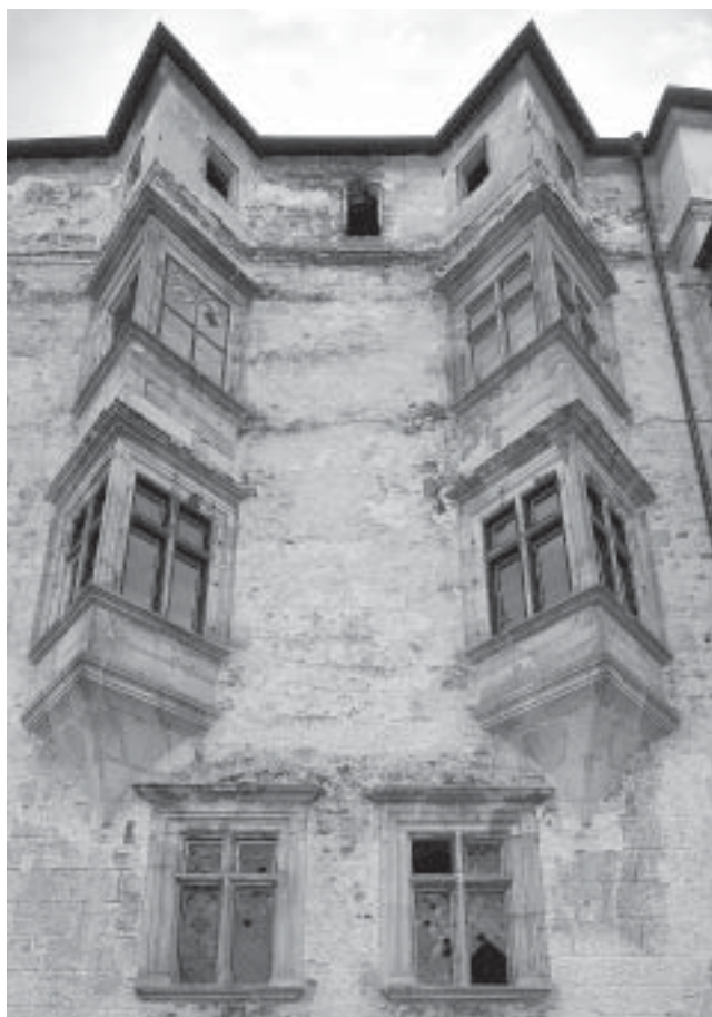
4. Blatná, hrad, jižní palác, dvojice arkýřů v průčelí