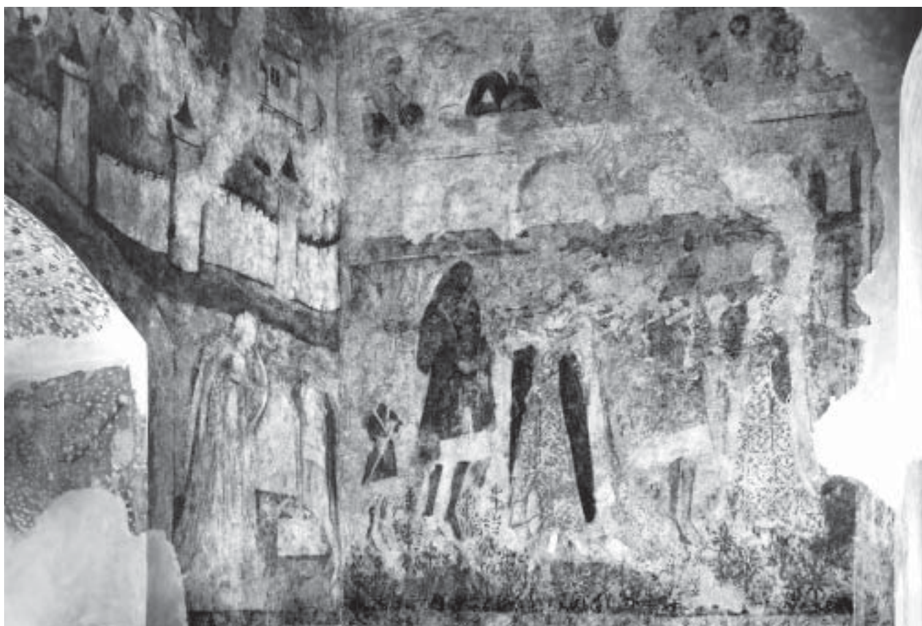
6. Blatná, hrad, nástěnné malby síně ve 2. patře severního paláce