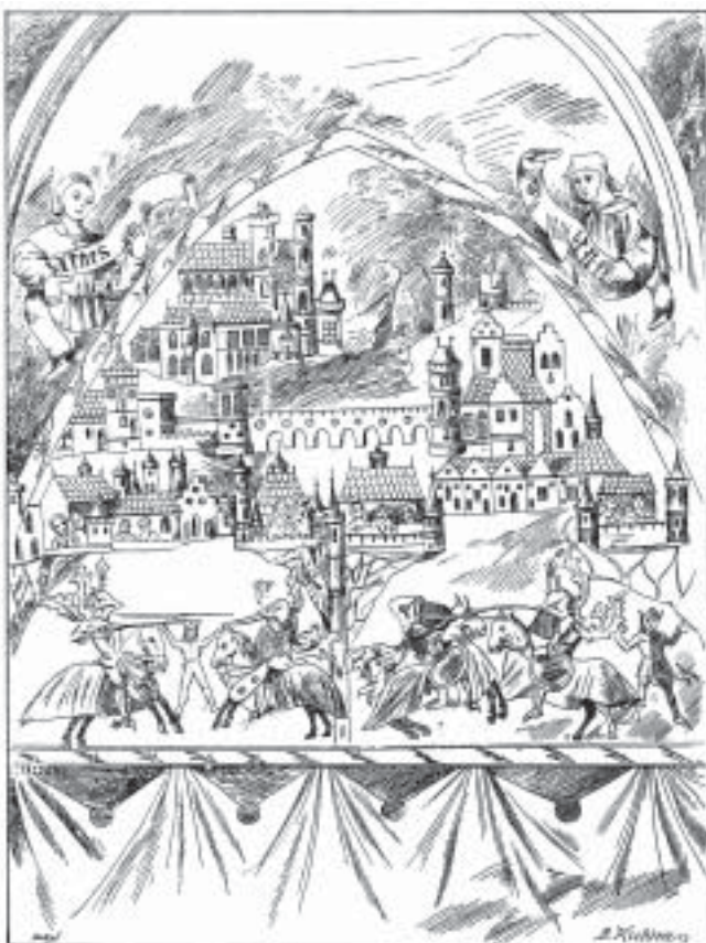
8. Písek, hrad, nástěnné malby ve velké síni západního křídla paláce, kresba pořizená před zničením originálních maleb