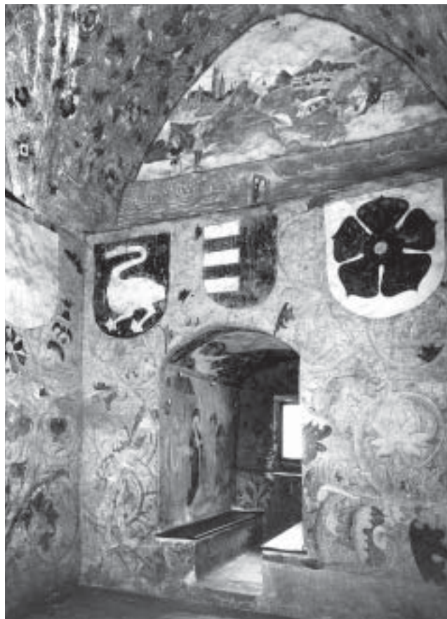
5. Blatná, hrad, klenutá síň vstupní věže s nástěnnými malbami