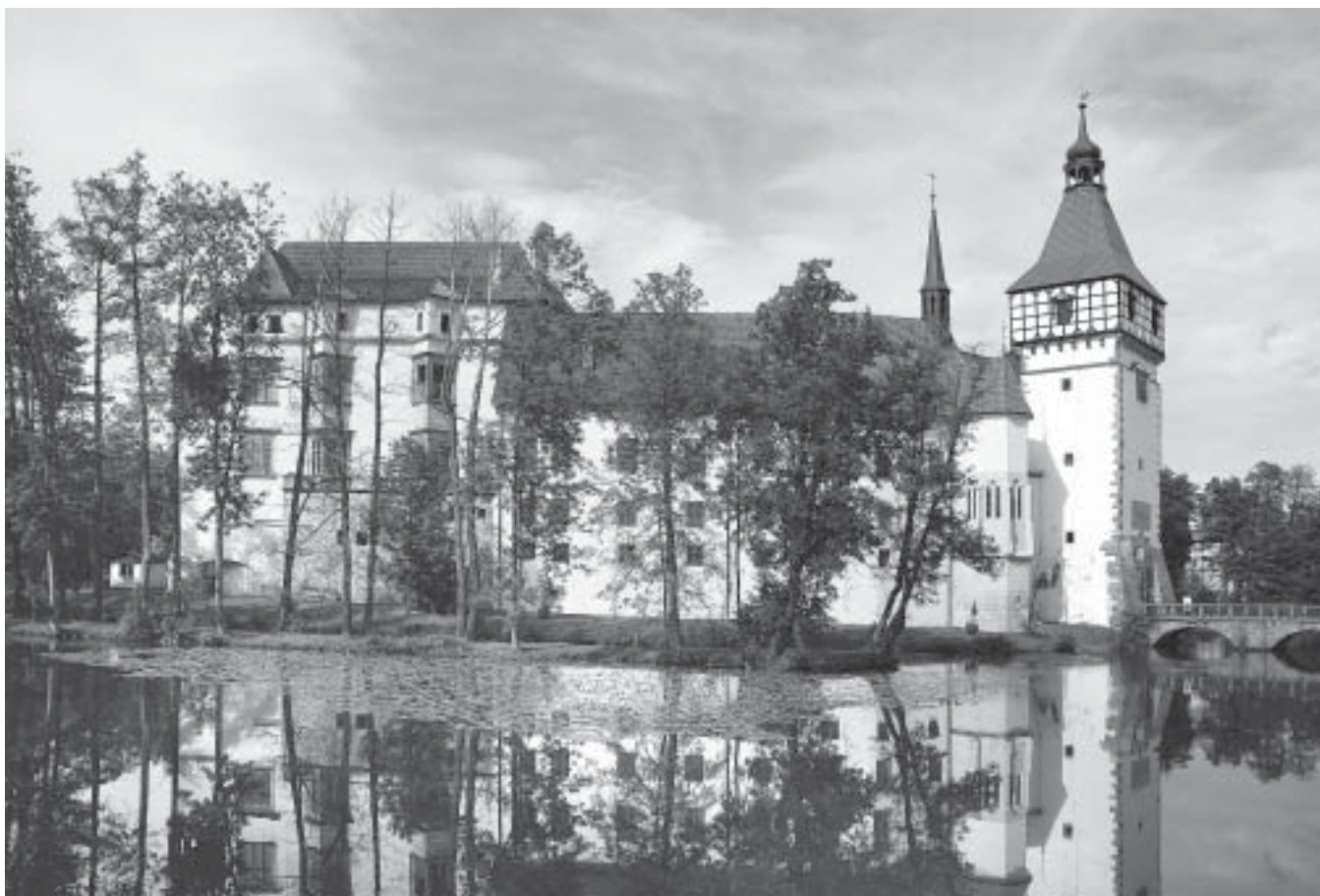
1. Blatná, hrad, pohled od jihu