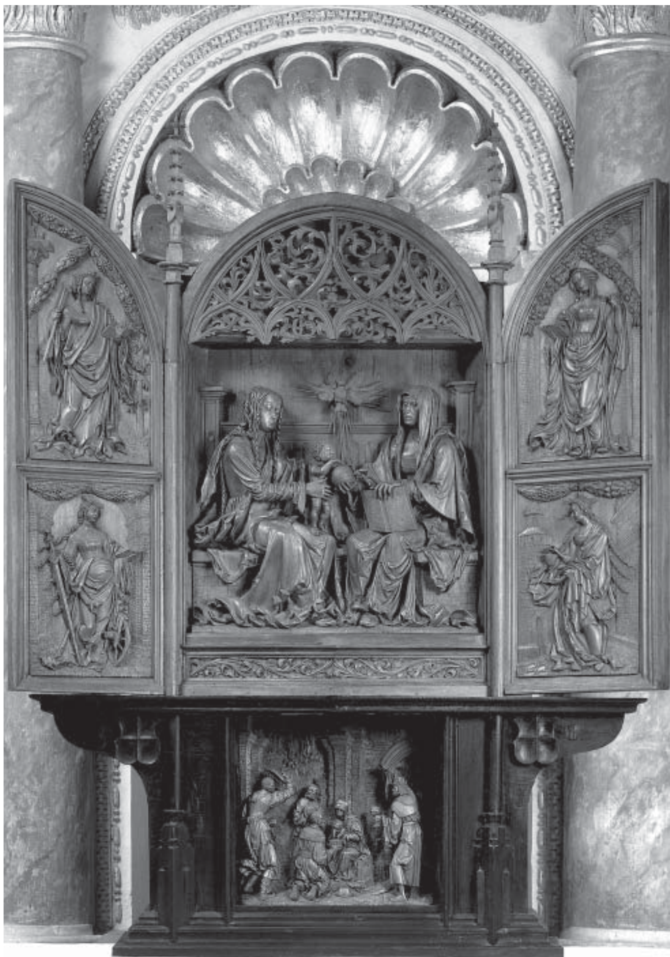
12. Český Krumlov, hrad, oltář sv. Anny