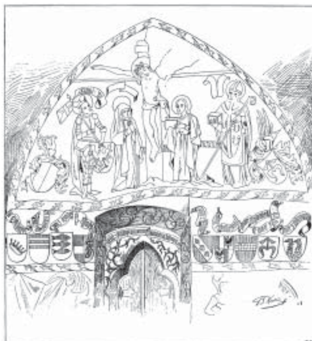
9. Písek, hrad, nástěnné malby ve velké síni západního křídla paláce, kresba pořizená před zničením originálních maleb