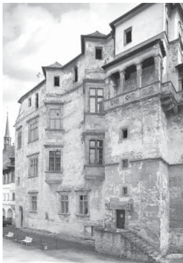
3. Blatná, hrad, nádvoří křídlo jižního paláce