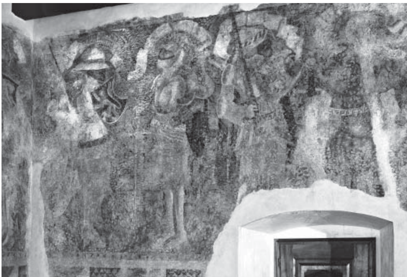
7. Blatná, hrad, nástěnné malby ve 2. patře severního paláce