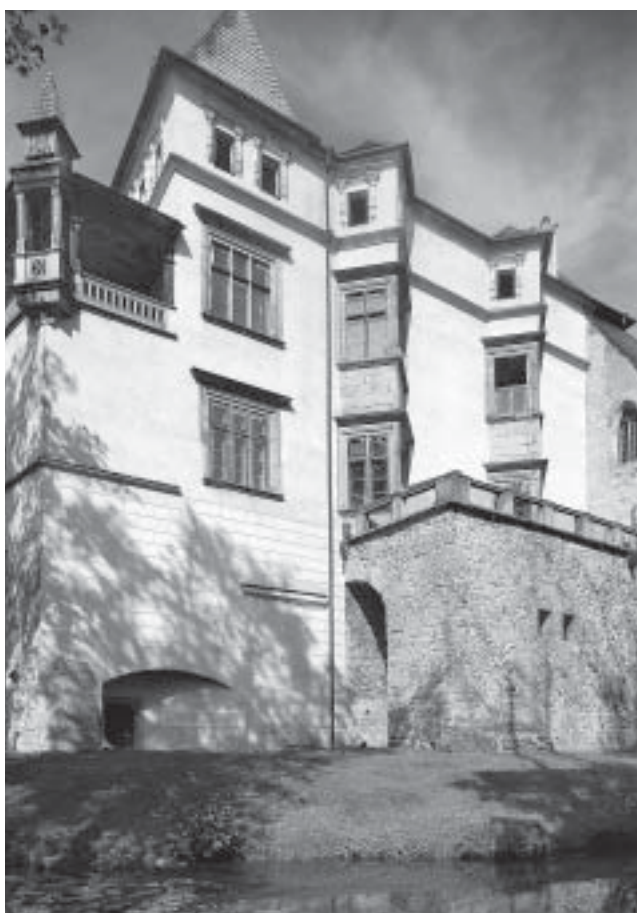
2. Blatná, hrad, palác Benedikta Riedla