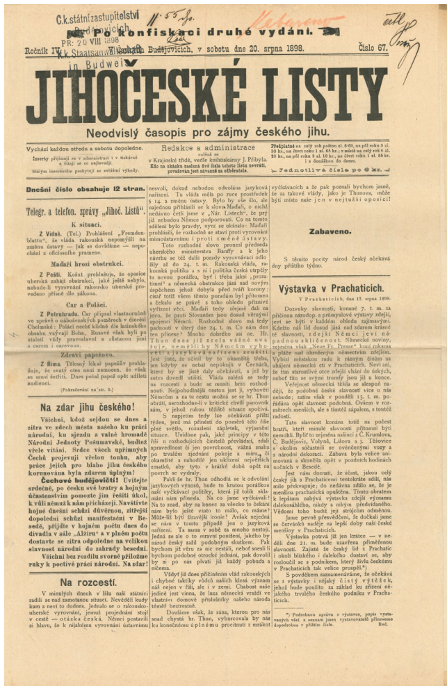
Obř. 6. Jihočeské listy, č. 67, z 20. srpna 1898 – titulní strana s poznámkami cenzora. SOA Třeboň, Státní zastupitelství České Budějovice, inv. č. 268, karton 12, zn. Ss 24/98, Jihočeské listy , roč. IV, č. 67, 20. 8. 1898.

předtištěnými formuláři, korespondenci s okresním hejtmánstvím v Jindřichově Hradci a s celkovým závěrem zákazu i výnosem krajského soudu v Českých Budějovicích, který zákaz potvrdil, protože tato zpráva zakládala svým obsahem skutkovou povahu přečinu proti veřejnému pokoji a řádu . 10 Veškerá spisová agenda státního zastupitelství byla vedena převážně německy, pouze výnos krajského soudu je v češtině. Číslo však nakonec vyšlo v nezměněné podobě. Zajímavý je zmíněný předtištěný formulář v podobě dvojlistu (formát přeložené A3), který se prolíná až do roku 1918 jako povinný administrativní dokument všemi tiskovými kauzami a který obsahuje na titulní straně spisovou značku, která byla přidělena této tiskové kauze, dále informace o konkrétním periodiku, které bylo předloženo státnímu zastupitelství a tím také krajskému soudu, která přesná pasáž (článek) je závadná a je řešena na základě jakých paragrafů trestního řádu a tiskového zákona, na s. 2 v bodě 1. je opět zmíněno konkrétní periodikum s konkrétním článkem a paragrafovým odůvodněním