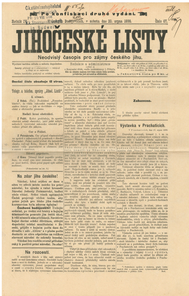
Obř. 7. Jihocheské listy, č. 67, z 20. srpna 1898 – titulní list po úpravě s klasickým bílým místem a zabaveno. SOA Třeboň, Státní zastupitelství České Budějovice, inv. č. 268, karton 12, zn. Ss 24/98, Jihocheské listy, roč. IV, č. 67, 20.8.1898.

Dalším periodikem jsou Jihocheské listy vydávané v letech 1895–1941 jako nepolitický a nezávislý tisk. 13 V čísle z 25. června 1898 přinesla titulní strana článek s názvem „Kdyby Rakousko nebylo...“, celý spis obsahuje kromě jiných dokumentů i český předtisk formuláře návrhu a české vyjádření krajského soudu, obě instituce vyhodnotily závadnost některých pasáží dle § 65a trestního zákoníku jako zločin rušení veřejného pokoje. 14 Další číslo z 20. srpna 1898 obsahuje rovněž u článku na titulní straně s názvem „Na rozcestí“ pojednávajícím o české pozici v rakousko-uherském vyrovnání výtisk s vpisky cenzora inkoustovou tužkou a rovněž nové vydání s nadpisem Po konfiskaci druhé vydání, které bylo v celém rozsahu zabaveno, hlavní