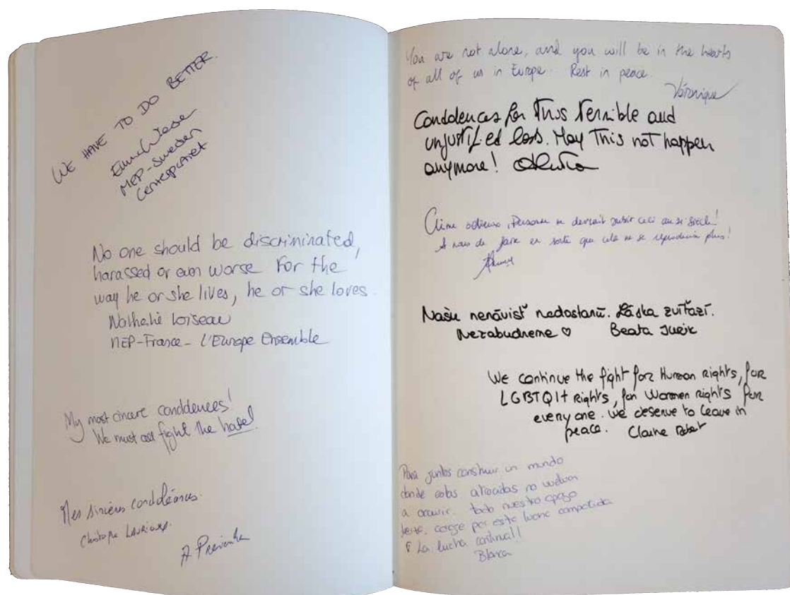
Obr. 3. Kondolenčné knihy – ukážka (2022).

projektu je domov, čím chce reflektovať na problémy intolerance, rasizmu a xenofóbie. Projekt prináša výstavy a programy pre verejnosť, jeho náplňou však nie je pracovať s vlastnou zbierkou. Program galérie Tranzit v Bratislave, ktorá pravidelne prináša tému ekoaktivizmu, dáva priestor queer umeniu, feminizmu v umení a rôznym komunitám, čím otvára aktuálne otázky o súčasnej spoločnosti. Hoci tieto inštitúcie publikujú a pripravujú výstavy na aktuálne spoločenské témy, zmyslom týchto aktivít nie je rozširovanie zbierok. V múzeách, kde sa kurátori neobmedzujú len na prácu s umením, ale možnosti zbierania sú oveľa väčšie, sme sa so snahou pristupovať k práci so zbierkovými predmetmi inkluzívne, stretávali skôr ojedinele. Tu sa dostávame k tomu, že by to mala byť úloha zbierkotvorných inštitúcií a takou Slovenské národné múzeum je. Uvedomenie si tejto potreby, toho, kam sa ešte môže posúvať taká veľká a členitá inštitúcia po 130 rokoch svojej existencie bolo rozhodujúce, aby zbierka mohla vôbec vzniknúť.