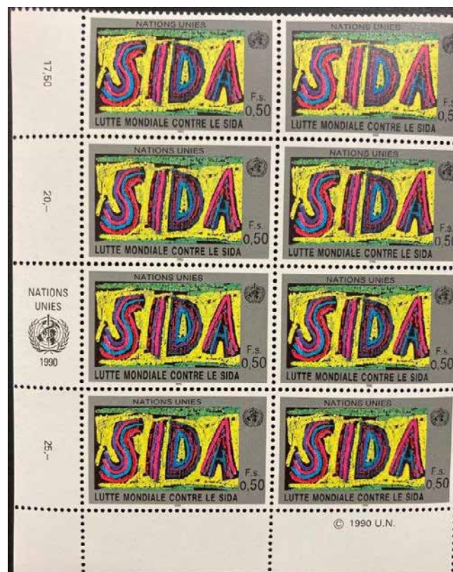
Obř. 9. Aršík, 8 známok, NATION UNIES, LUTTE MONDIALE CONTA LE SIDA (1990). Zdroj: SNM – HM, zbierka Inklúzie, IS 00016; autorka fotografie: Zuzana Luprichová.

Súbor nadobudnutých predmetov predstavuje materiál súvisiaci s jednou udalosťou. To sme chceli odprezentovať v expozícii SNM – HM hneď z niekoľkých dôvodov. V prvom rade to bol zámer predstaviť nový projekt múzea, teda zbierku s inkluzívnym zameraním. Taktiež sme chceli oslo-