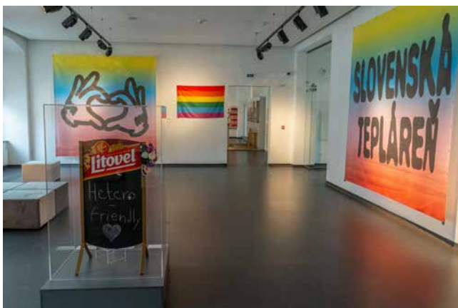
Obr. 4. Záber zo SNM – HM, z výstavy zbierky Inklúzie, 17. 5. 2023.

novat' ako stav bytia a pocit hodnoty, rešpektovania a podpory. Uplatňovanie inklúzie je nevyhnutné pre rozmanitosť iniciatív k efektívnej práci. " 9