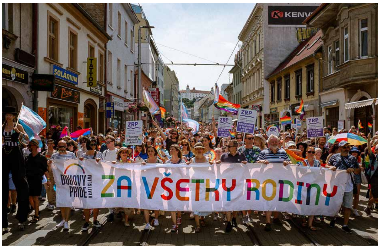
Obr. 8. Fotografia z pochodu Dúhový PRIDE Bratislava, snímka z ulice Obchodná (2023).

a mali by zostať – neutrálne priestory. 20 Puig i Espar robila prieskum vo viacerých európskych múzeách o tom, ako oni sami interpretujú muzeálny aktivizmus a výsledok zhrnula do troch bodov. V nich ukazuje ako aktivizmus v múzeách chápu samotné inštitúcie: