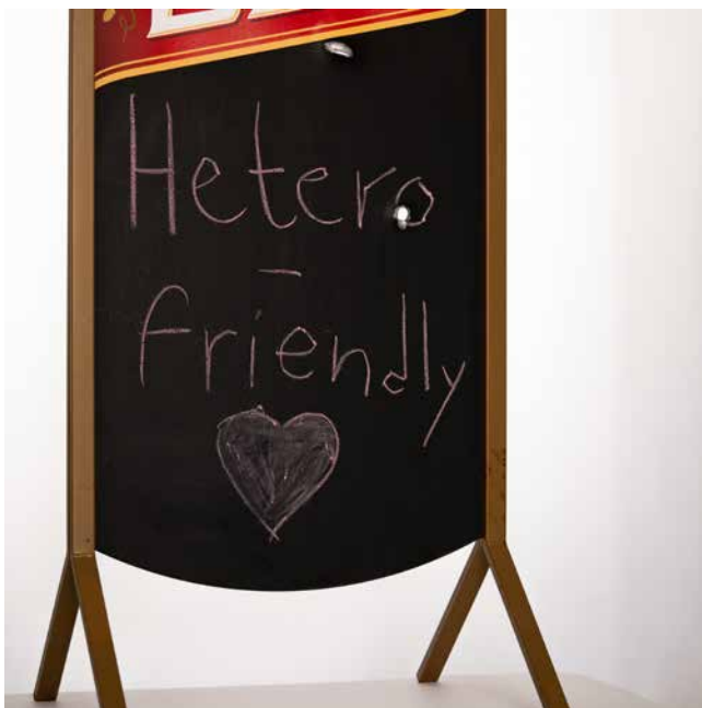
Obr. 1. Reklamná kriedová tabuľa z baru Tepláreň (2022). Zdroj: SNM – HM, zbierka Inklúzie, IS 00001; autor fotografie: Samuel Gabura.

vzdelávaní. 3 Konali sa kultúrne podujatia vo viacerých mestách, 4 udalosť rezonovala aj v zahraničných médiách. 5 Následne sa v politickom a kultúrnom diskurze otvorili témy od ľudskoprávných otázok a bezpečnosti LGBTI+ ľudí na Slovensku, cez kvalitu lekárskej starostlivosti dostupnej na Slovensku pre transrodových ľudí, až po opätovné pokusy o presadenie zákona o registrovaných partnerstvách 6 .