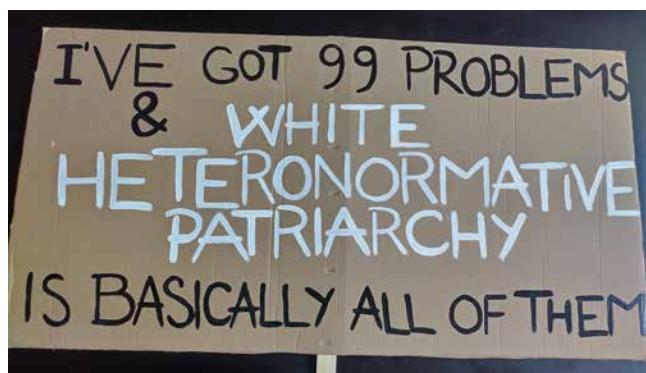
Obr. 10. Transparent, I've got 99 problems & white heteronormative patriarchy is basically all of them (2022).

V médiách a na sociálnych sieťach mala krátkodobá prezentácia zbierky prekvapivo odozvu v denníkoch, ktoré sa profilujú ako konzervatívne. Správu o výstave od Tlačovej agentúry Slovenskej republiky (TASR) 28 prevzal konzervatívny denník Hlavné správy. 29 V komentároch pod článkom prevládajú negatívne hodnotenia a postoje diskutujúcich. Išlo prevažne o vyjadrenie znechutenia, o homofóbnе prejavy či spochybňovanie umeleckej ( sic ) kvality exponátov. Článok z denníka Postoj priniesol kritiku výstavy. 30 Denník Štandard prevzal tlačovú správu z TASR, bez komentárov a výstavu prezentuje ako výstavu o Teplárni. 31 Nezávislý denník Nový čas, ktorý sa spravidla zameriava na bulvárne správy, priniesol krátky text s galériou fotografií z expozície. 32 Medzi početnými komentármi pod článkom prevládajú, podobne ako pri článku z denníka Hlavné správy, homofóbnе a negatívne hodnotenia. Z uvedeného môžeme vyvodit', že prevládajú negatívne reakcie, hoci väčšina hodnotiacich pravdepodobne výstavu reálne nenavštívila.