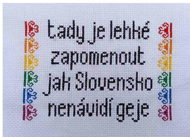
Obr. 11. Tady je lehké zapomenout, jak Slovensko nenávidí geje, výšivka Kundy crew (2022).

Okrem vyhľadávania nových zbierkových predmetov plánujeme do budúcnosti pracovať aj s koncepciou tzv. živej knižnice, ktorá by v digitálnom úložisku uchovávala hlasové nahrávky a videonahrávky ľudí z rôznych komunít či subkultúr. Metóda oral history (história slovom) umožňuje zachovanie spomienok konkrétnych ľudí, s ich osobným pohľadom na udalosti, zároveň zachováva špecifiká ako hlas, reč konkrétneho človeka.