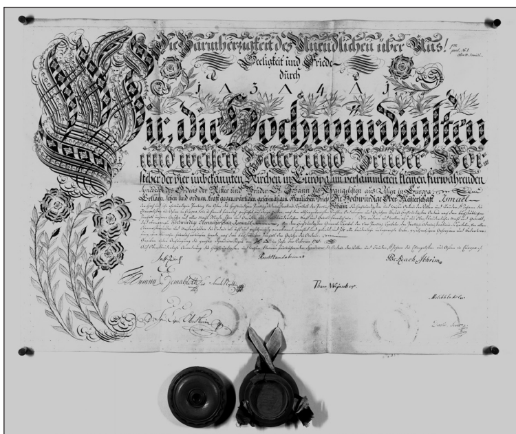
Obrázek 1 – Zednářský diplom Synderia řádu rytířů a bratří sv. Jana Evangelisty, 3. 3. 1785, ANM, Latomica, inv. č. 2