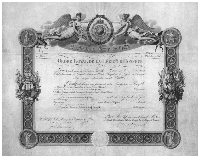
Obrázek 2 – Diplom francouzského královského Řádu čestné legie, 9. 12. 1820

Rodinný archiv Herzogenberg s dokumenty přírodných rodin Picot de Peccaduc a Rothkirch-Panthen získal Archiv převodem z historicko-archeologického oddělení, kam jej odevzdal do úschovy Místní národní výbor v Brně u Ústí nad Labem ze zajištěného německého