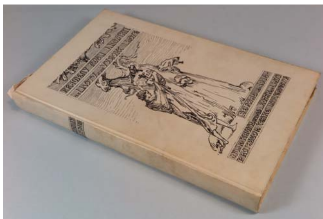
Obr. 1. Přední deska rukopisu.

Při poslední pravidelné inventarizaci rukopisného fondu evidovaného v Centrální evidenci sbírek bylo zjištěno, že rukopis sign. X A 41 zapsaný v původním ručně psaném lokálním katalogu rukopisné sbírky Knihovny Národního muzea pod názvem Prameny rodu Lhotáků ze Lhoty 1 je pozoruhodný účastí tří osob, které se podepsaly na formě zpracování knihy.