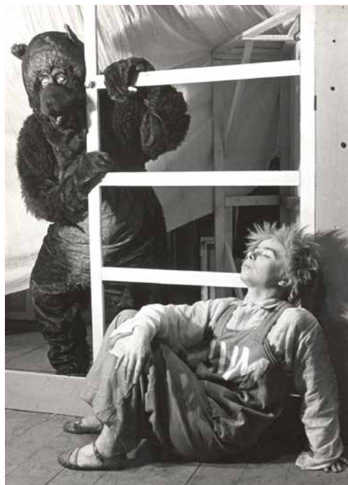
Medvídek bílé břicho . Na fotografii Jožka Šarševá.