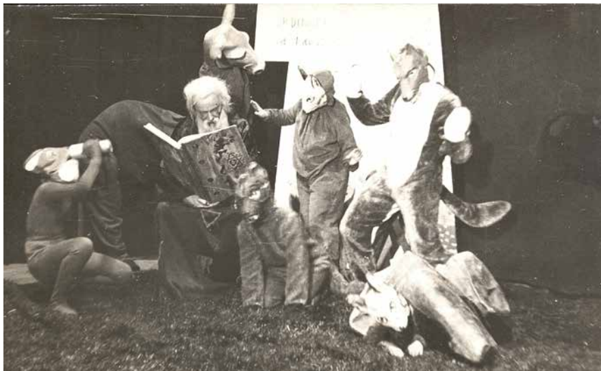
Doktor Dobráček a zvířátka.

na Divadlo na Starém Městě a v jeho čele se do konce roku 1996 vystřídali ještě F. R. Čech a D. Šálková. 13