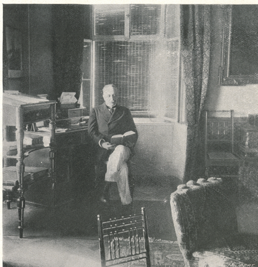
HRABĚ FRANT. LÜTZOW V PRACOVNĚ.

Obr. 9. Pracovna hraběte Lutzowa v přízemí zámku Žampach, reprodukce Český svět, 5. 10. 1904, roč. 1, č. 1, s. 27.