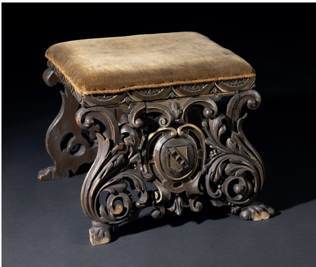
Obr. 10. Čalouněný vyřezávaný taburet se štítkem rodu Lüt-zowů, 3. čtvrtina 19. století, MMP H 226 493; autor fotografie: Matěj Adámek