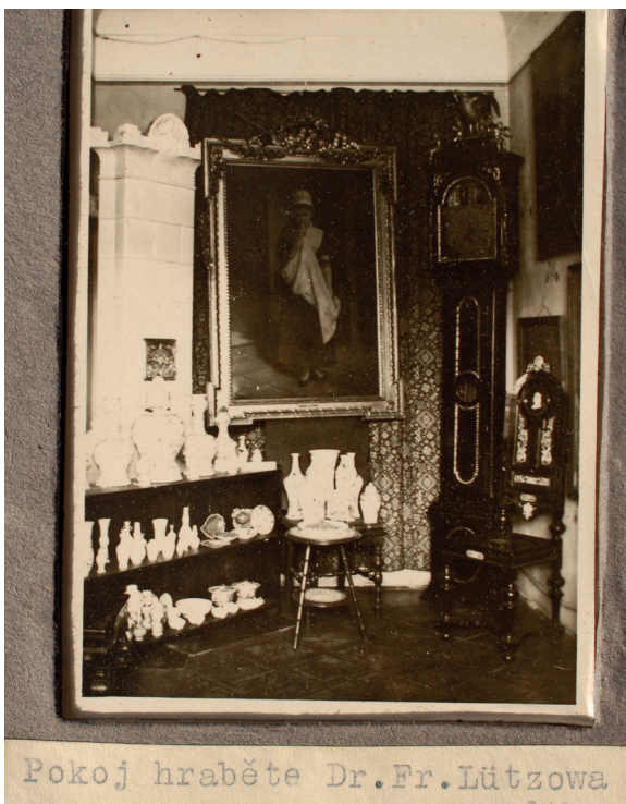
Obr. 7. Pohled do neurčené místnosti zámku Žampach, fotografie, cca 1914, MGOH 2007447,2

odkazu. 57 Tou poslední je neoklasicistní socha zpodobňující ženskou figuru s drobnými křídly, z lehu se vzpínající, pravděpodobně postavu Psyché, na jejíž pozdvížené pravici býval spočinut (dle popisu) dnes nedochovaný motýl. Neurčená, nesignovaná socha patrně z třicátých let 19. století kombinuje netradičně bílý a červený mramor a stejně jako předchozí skulptura je součástí sbírek MMP. 58 Jak již bylo řečeno, většinu z více než stovky předmětů odkázaných roku 1932 hraběnkou Praze zastupovala keramika (zejména vázy, dózy, teriny, talíře ad.). Jakkoli lze soupis darovaných předmětů považovat za podrobný ve smyslu popisu vnějškového vzezření, uvedení materiálu nebo slohového určení zpravidla absentuje. Můžeme tak pouze předpokládat, že se jednalo zejména o evropskou fajáns a patrně též orientální porcelán. Po delimitacích šedesátých a sedmdesátých let zůstalo v městském muzeu uloženo pouze několik kameninových dóz, keramických váz a paneau evropské provenience.