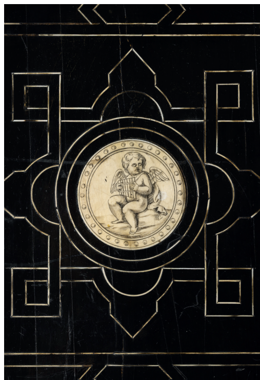
Obr. 6. Neorenesanční židle, detail kostěné intarzie s figurou amora hrajícího na flétnu, 2. polovina 19. století, MMP H 226 489/002

vala do Vamberka. 52 Vedle obrazů evropských mistrů, nezřídka v rodu Lützowů děděných, zdobily žampašské interiéry též umělecké plastiky. V dobových textech je mezi autory jmenován například neoklasicistní sochař Berthel Thorvaldsen, 53 z jehož dílny pochází jedna ze tří mramorových soкултур, které hraběnka Lützowová odkázala Praze. Jedná se o půvabnou, iniciály AT signovanou sochu malého Amora hrajícího na lyru, 54 jež na seznamu hraběnkina odkazu figuruje jako položka č. 79 a je dosud součástí sbírky městského muzea (obr. 8). 55 Thorvaldsenovou tvorbou byl ovlivněn vídeňský sochař Josef Kässmann, 56 jehož nadživotní mužská busta, snad hlava Apollona s květinovým věncem ve vlasech, signovaná a datovaná 1835, je další položkou z hraběnkina