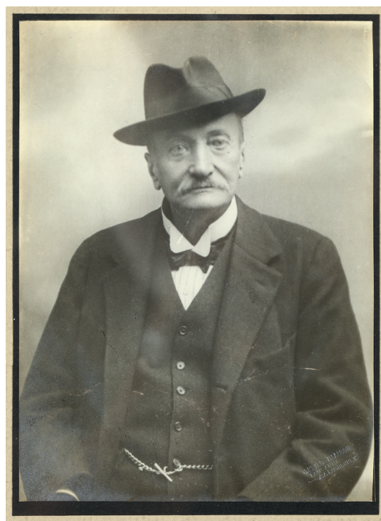
Obr. 30. Portrét hraběte Lützowa, sign. ateliér J. Krieg in Albon v ulici Ruchonnet v Lausanne, fotografie, MMP H 342 874; autor fotografie: Jan Diviš