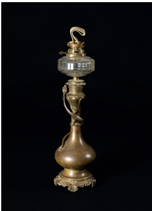
Obr. 14. Stolní petrolejová lampa, sign. Hinks & Son, konec 19. století, MMP H 333 512

a časopisů, lze ve středu rozpoznat ještě jeden z dochovaných předmětů, a to stolní petrolejovou lampu, patent anglické firmy Hinks & Son ze sklonku 19. století (obr. 14). 73 Tělo mosazné lampy ve formě štíhlé orientální karafy ladně obtáčí protažené tělo ještěřky, na fotografii zachycené kulovité stínidlo z mléčného skla se bohužel nedochovalo. Fotografie publikovaná v Literárním atlasu československém vznikla bezpochyby nejdříve v roce 1912. Tuto skutečnost lze odvodit nejen z podoby křišťálového již elektrifikovaného lustru, 74 ale také na základě vnošení jedné z mnoha nástěnných dekorací tehdejšího aranžmá pracovny. Jedná se o fotografii zachycující účastníky banketu, který na počest manželů Lützowových uspořádala Bohemian-American Press Association (Česko-americká tisková kancelář) 75 ve Zlaté dvoraně hotelu Congress v Chicagu 23. února 1912 (obr. 15). 76 Pobyt Lützowových v Chicagu souvisel s přednáškovým několikátýdenním turné po amerických univerzitách, jež manželé započali již 20. ledna 1912 v Liverpoolu a ukončili návratem do Londýna 19. března.