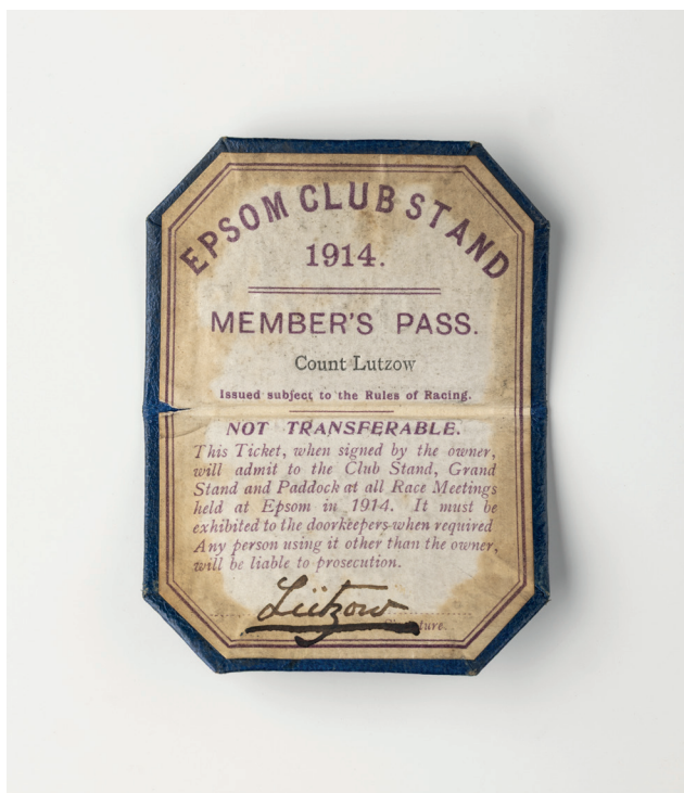
Obr. 28. Členská permanentka hraběte Lützowa na dostihové závody v Epsomu na rok 1914, MMP H 480/2002