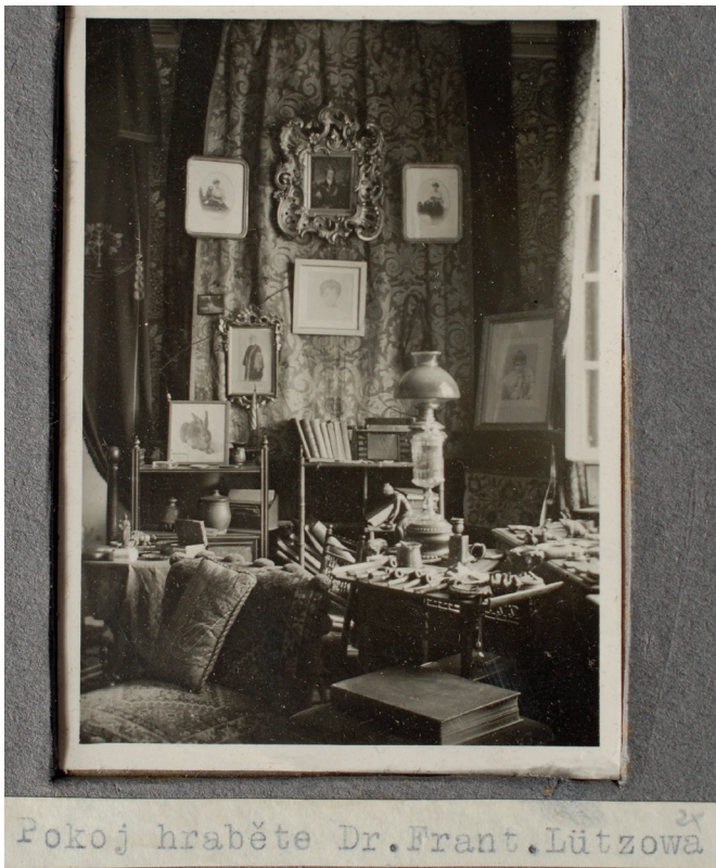
Obr. 19. Pohled do pracovny Františka hraběte Lützowa na zámku Žampach, fotografie, po 1914, MGOH 2007447,4