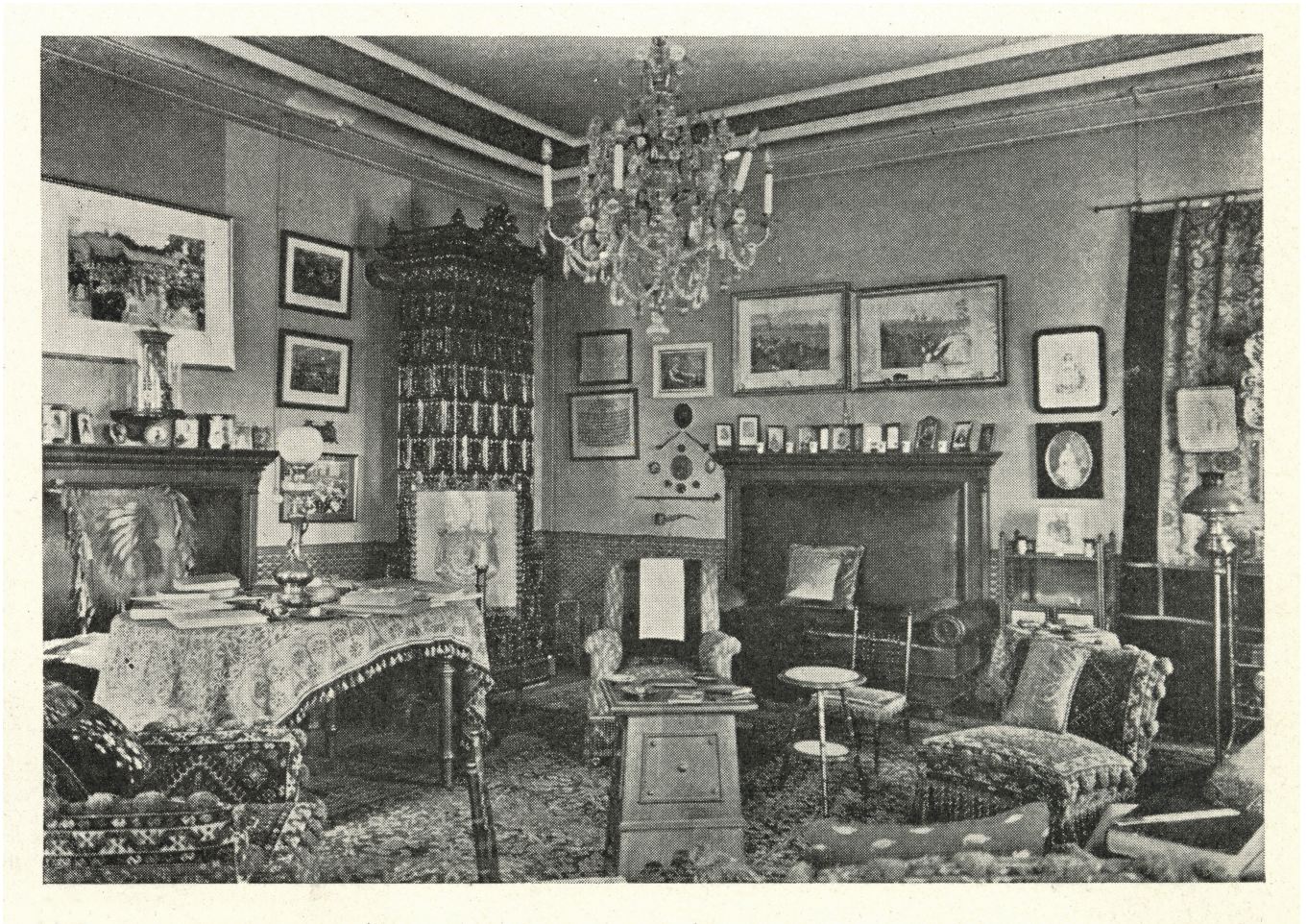
Obr. 12. Pracovna hraběte Lutzowa na zámku Žampach, reprodukce Bohumil VAVROUŠEK (ed.), Literární atlas československý, II. díl, Praha 1938, s. 145