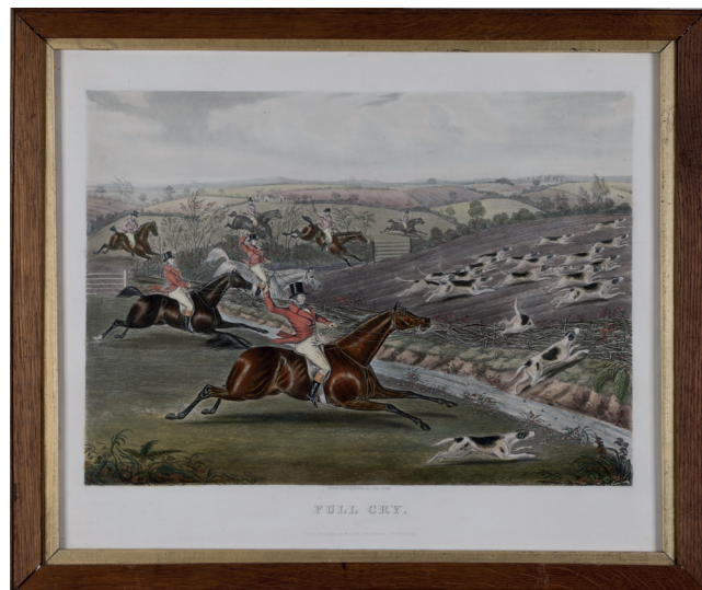
Obr. 26. Kolorovaná akvatinta Full Cry ze série Fox Hunt, vyryl a ručně koloroval Charles Hunt, vydal W. Soffe v Londýně 1838, MMP H 480/2002

Další anglické grafické soubory z 19. století s tematikou lovu a dostihů dochované v Lützwowově pozůstalosti (obr. 26) na fotografiích zachyceny nejsou. 104 To se týká