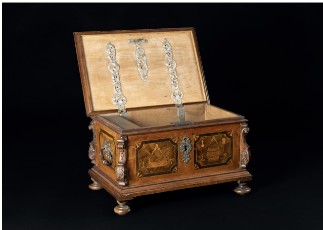
Obr. 3. Pokladna sdruženého cechu bednářů, tesařů, truhlářů a kameníků (?), 1729, MMP H 226 586