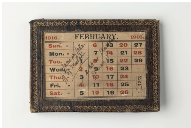
Obr. 23. Kalendář na rok 1916 s příписy vztahujícími se k úmrtí hraběte Lützowa, MMP H 480/2002

s kalendářem na rok 1916 (obr. 23). Na jeho svrchní stranu vyplněnou únorovým kalendářem neznámá ruka, snad hraběnky Lützowové, inkoustem poznamenala k úmrtí hraběte: „January taken off by mistake“ a „He left us Thursday January 13.“ 91 Na stole, ale také na polici vedlejšího psacího pultu se nacházejí další identifikované dochované předměty (držák na dopisy, dřevěná kazeta, etue z březové kůry s výšivkou). 92 Na ostění dveří do místnosti autor fotografie zachytil zavěšený vlněný talár s kloboukem, který upomíná na Lützowův zisk čestného doktorátu na univerzitě v Oxfordu 28. února 1905, jež hrabě obdržel za své tamní přednášky pronesené v červnu předcházejícího roku. 93 Akademický oděv je dochován ve sbírce MMP, byť talár během desetiletí pozbyl světlé díly hedvábí pokrývající spodní části rukávů a lemy. Dle zlatě tištěné etikety na podšívce klobouku byl celek zhotoven v oxfordském ateliéru Castell and Son, Lützowovo vlastnictví jednoznačně potvrzuje štítek nalepený na potítku klobouku s jeho vlastnoručním podpisem. Známa fotografie hraběte Lützowa ve výše uvedeném doktorském oděvu měla v pracovně své místo hned vedle dveří do místnosti. V pozůstalosti se nachází zvětšený zarámovaný snímek, který byl dle slepotoskopového razítka realizován ve slavném ateliéru Františka Langhansa v pražské Vodičkově ulici v roce 1929 (obr. 1). 94 Nabízí se souvislost jeho objednávky s termínem přípravy instalace pracovny v ústřední měst-