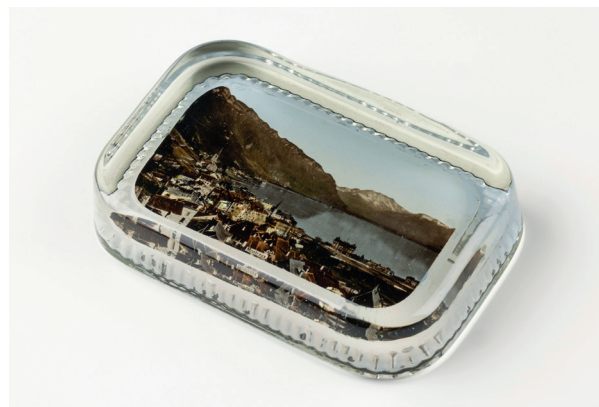
Obr. 27. Upomínkové skleněné těžítka s pohledem na švýcarské město Montreux na břehu Ženevského jezera, MMP H 342 883; autor fotografie: Matěj Adámek

i řady dalších předmětů. Viditelné nejsou zarámované objekty v horních řadách, značný úsek prostoru pracovny není na snímcích pojednán vůbec, množství drobných předmětů je vzhledem k úhlu fotografického pohledu nerozeznatelných. Mezi dochované součásti pracovny náleží drobné užité a upomínkové předměty – kuřácké potřeby, skleněná těžítka s fotografiemi Niagarských vodopádů či švýcarského města Montreux (obr. 27), keramická miska na pero vyrobená v Longpark v Torquay atp., členské průkazy – permanentka na dostihové zá-