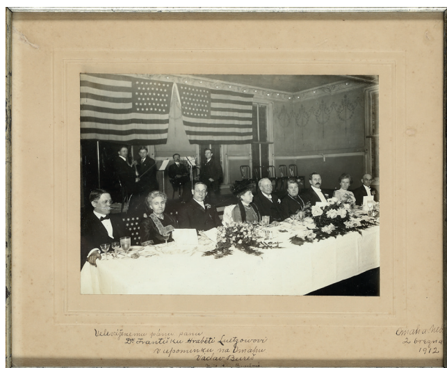
Obr. 17. Slavnostní banket v jídelně hotelu Rome v Omaze pořádaný výborem na uvítání a uctění hraběte Luetzowa a jeho choti v Omaze 2. března 1912, fotografie, MMP H 342 884; autor fotografie: Jan Diviš