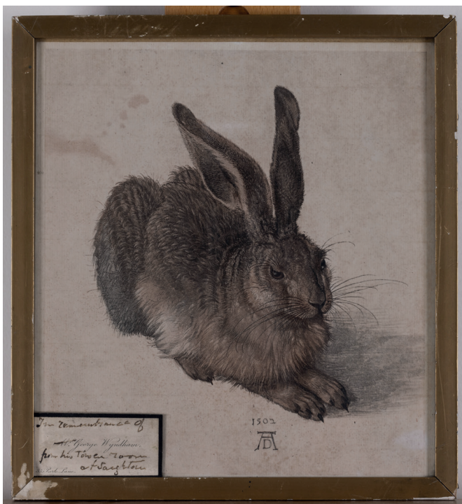
Obr. 21. Reprodukce akvarelu Mladý zajíc Albrechta Dürera z roku 1502 s věnováním od George Wyndhama z 29. srpna 1910, MMP H 480/2002; autor fotografie: Jan Vrabec