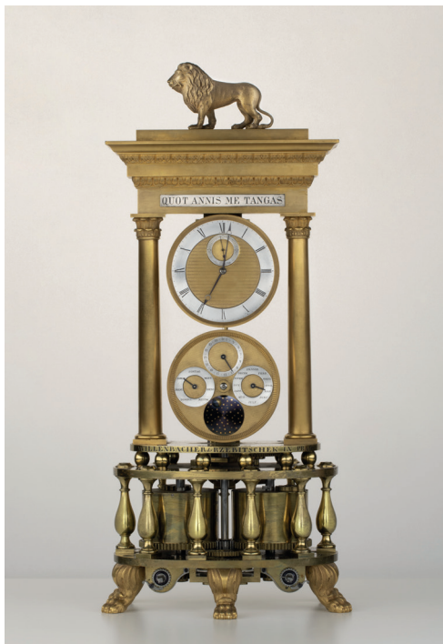
Obr. 13. Hodiny stolní, sign. Willenbacher & Rzebitschek in Prague, cca 1835, MMP H 127 841