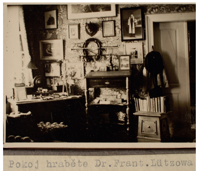
Obr. 22. Pohled do pracovny Františka hraběte Lützowa na zámku Žampach, fotografie, po 1914, MGOH 2007447