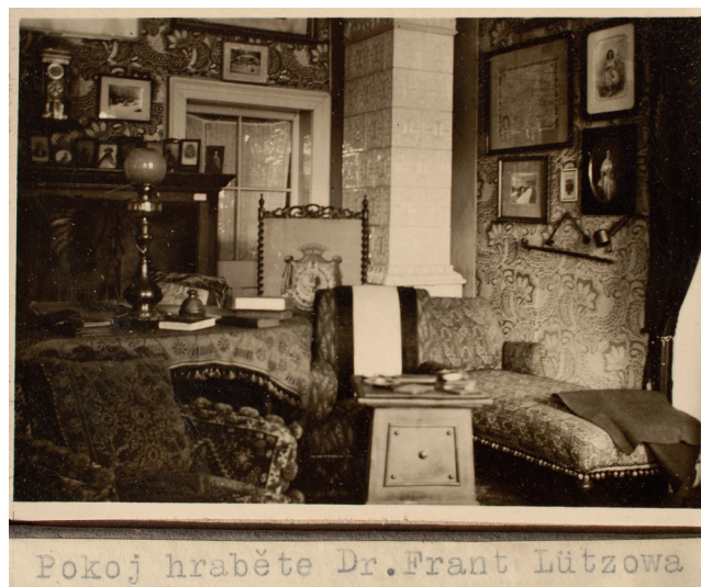
Obr. 16. Pohled do pracovny Františka hraběte Lützowa na zámku Žampach, fotografie, po 1914, MGOH 2007447,1

hraběti Lützowovi věnoval Václav Bureš, vedoucí výboru na „Uvítání a uctění hraběte Luetzowa a jeho choti v Omaze“ a současně ředitel tamních českých novin Pokrok západu (obr. 17). 79 Na protější straně pracovny se nachází jiná pamětní fotografie, na základě jejíž datace lze podobu žampašské pracovny na fotografiích ze sbírky MGOH vrocit nejdříve do druhé poloviny roku 1914. Je jí snímek zachycující návštěvu hraběte Lützowa s chotí na výstavě uspořádané radou Vamberka u příležitosti 25. výročí založení tamní krajkářské školy. Fotografie zaznamenává hraběcí pár v doprovodu vambereckého starosty Antonína Bednáře poslední den výstavy 19. července 1914 (obr. 18). 80 Vztahy hraběte Lützowa jako majitele velkostatku Vamberk a města Vamberku byly nadstandardně dobré, na rozdíl od problematické relace s obcí Žampach. Hrabě i hraběnka projevovali o záležitosti města živý zájem, hrabě byl čestným členem tamní Měšťanské besedy, Vamberk často navštěvoval i v doprovodu četných zahraničních i domácích hostů, prostřednictvím Lützowových se staly vamberecké krajky obdivovaným artiklem českého oddělení na