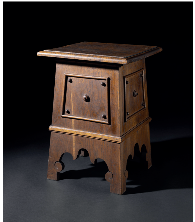
Obr. 11. Odkládací historizující stolek, 2. polovina 19. století, MMP H 1765/2002