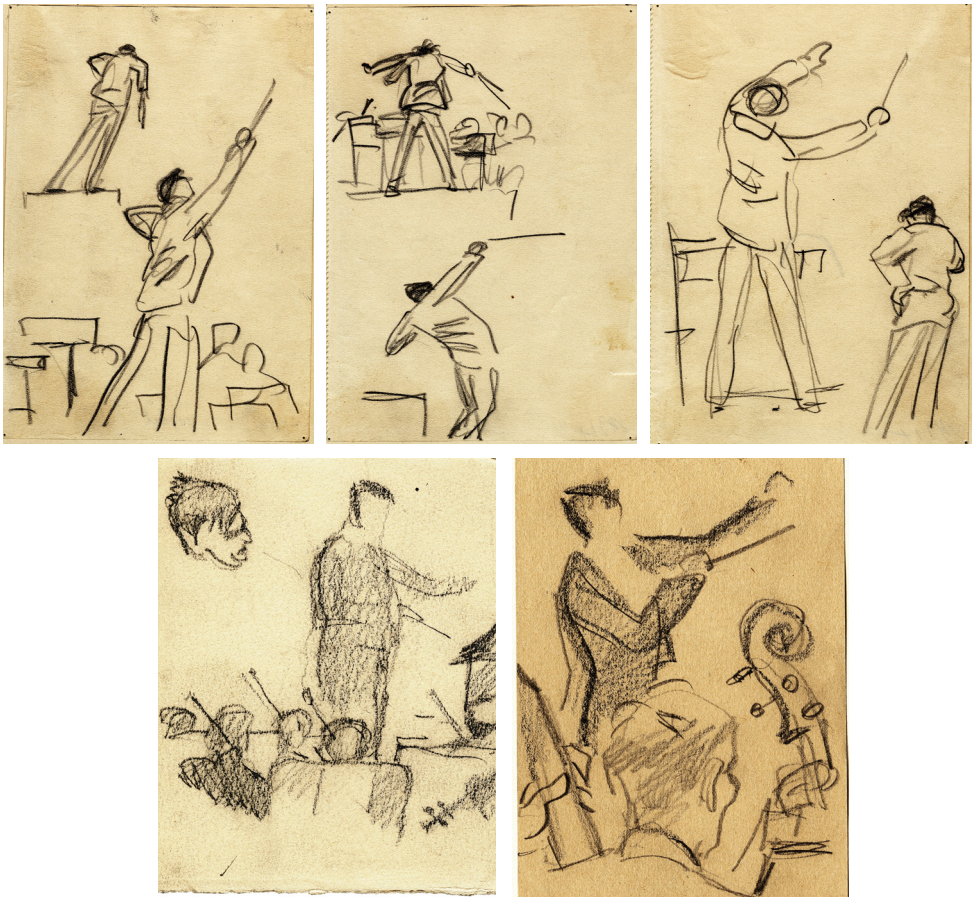
Obrázek 15 – Pohybové studie dirigujícího Václava Talicha. Obrazová příloha pokračuje na dalších stranách.

z těchto skic dokázala později vytvořit výstižné kresby a malby. Z počátku století i raných dvacátých let máme jen málo fotografií zachycujících hudebníky v pohybu. Tato dílka tedy poskytují ojedinělé svědectví o jejich výrazu a umění. Připomínají nám také, že malířové díle a osobnosti je česká uměnověda ještě dlužna velký kus poznání, aby jej představila mimo obecně vnímané charakteristiky jako malíře mládí či břitkého karikaturisty.