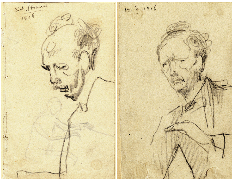
Obrázek 2 a 3 – Richard Strauss, skicy při dirigování. Kresba tužkou, 1916, Západočeská galerie v Plzni.

Následně při studiu na UMPRUM a následně na Akademii se jeho hudební zájmy staly vážnější a cílenější. Postupně poznával a obdivoval osobnosti české i evropské hudby. Vzpomínal na provedení Dvořákovy kantáty Svatební košile za řízení skladatele s orchestrem Národního divadla v 19. listopadu 1899 a 25. listopadu se účastnil premiéry Symfonie E dur přítele Josefa Suka za řízení jeho kolegy z Českého kvarteta Oskara Nedbala. Po roce 1900 poznává více i zahraniční dirigenty, kteří do Prahy přijížděli, např. Arthura Nikische šéfdirigenta Berlínský filharmoniků.