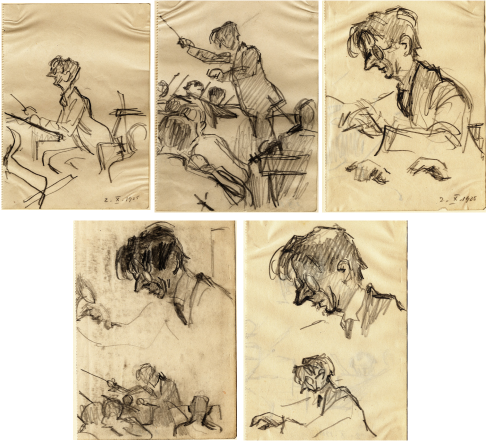
Obrázek 11 – Alexander Zemlinsky diriguje v orchestřišti divadla. Kresba tužkou, [1925], Západočeská galerie v Plzni.