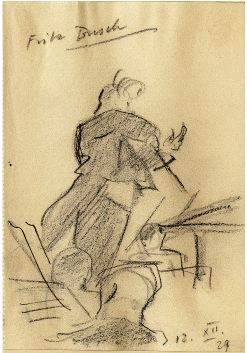
Obrázek 18 – Fritz Busch, různé studie. Kresba tužkou, Západočeská galerie v Plzni.