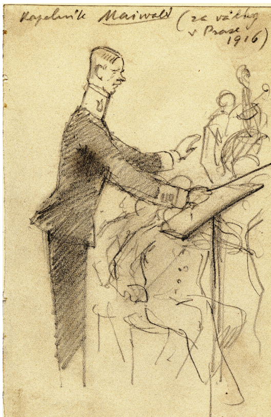
Obrázek 10 – Kapelník Mainwald (za války v Praze 1916). Kresba tužkou, 1916, Západočeská galerie v Plzni.

Prodanou nevěstu. Před premiérou, která se konala 18. října vznikla řada Boettingerových kreseb a lavírovaných kreseb, kde erudovaně vystihl gesta a postoje vzrůstem malého ale výrazného a temperamentního dirigenta včetně působení spodního světla v orchestřišti divadla na jeho obličej, které podtrhlo jeho typické rysy.