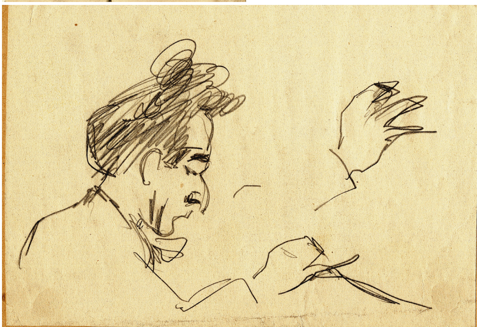
Obrázek 20 – Wilhelm Steinberg Kresba tužkou, Západočeská galerie v Plzni.