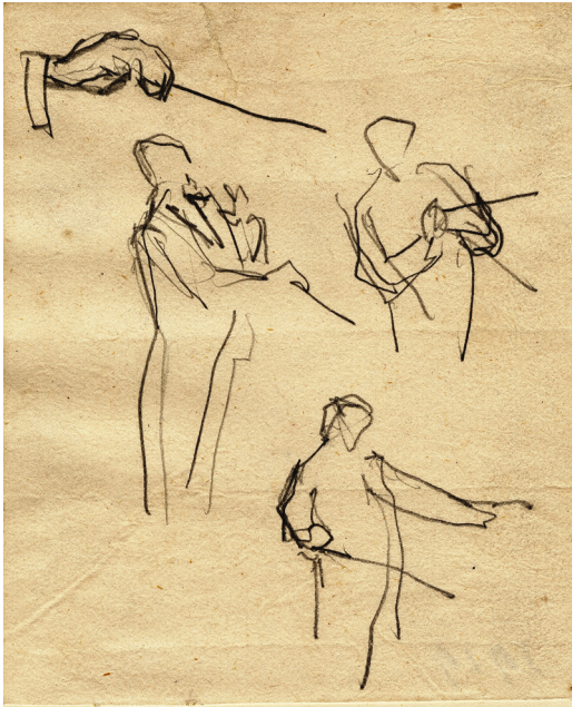
Obrázek 5 a 6 – Václav Talich při dirigování i s detaily orchestru. Kresba tužkou, 1919, Západočeská galerie v Plzni.

přes nás jako bouře. Byla přestávka, hudebníci odešli z podia. Rozrušení a dojati úžasným díle zůstali jsme a svých místech v přízemí. Tu náhle se vřítíl na podium jeden z členů orchestru, mával jakýmisi novinami a křičel radostí cosi nesrozumitelného. Nebylo však třeba rozumět slova – byla prohlášení česká republika! 8 Když se v roce 1919 stal Talich šéfdirigentem České filharmonie, navštěvovali Boettingerovi často jeho koncerty, např. koncerty konané od tohoto roku pravidelně na počest prezidenta Tomáše Garriguea Masaryka.