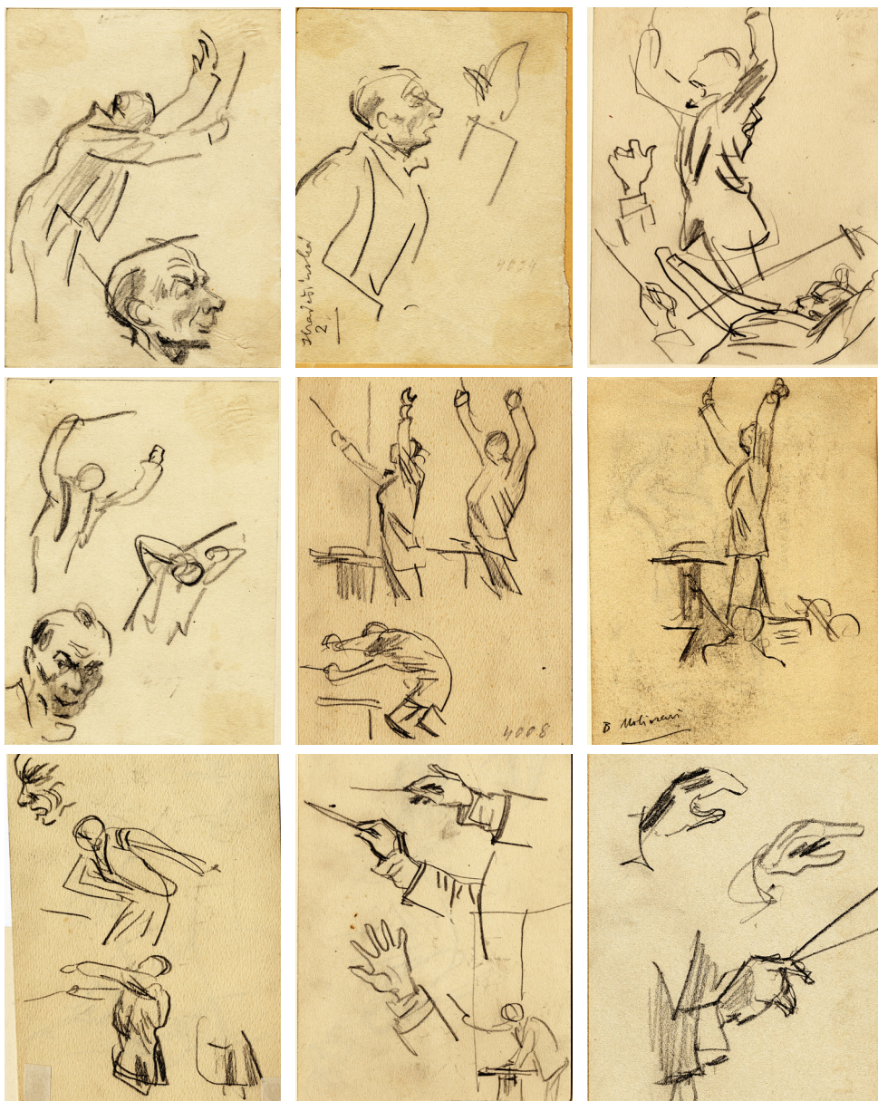
Obrázek 7 – Souboru kreseb dirigena Bernardina Molinariho. Kresba tužkou, Západočeská galerie v Plzni.