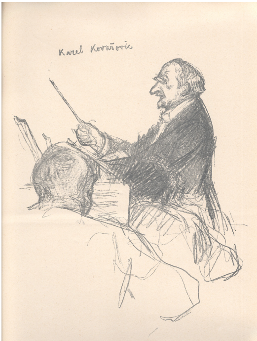
Obrázek 1 – Karel Kovařovic při dirigování. Kresba tužkou, Západočeská galerie v Plzni.