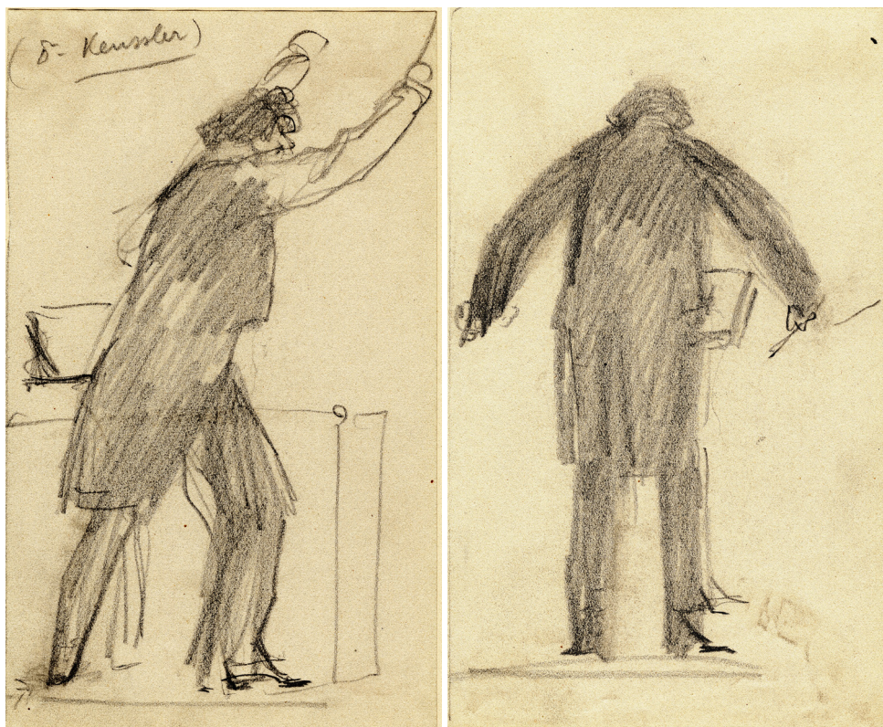
Obrázek 8 a 9 – Fritz Keussler při dirigování. Kresba tužkou, [1916], Západočeská galerie v Plzni.

najdeme v malířově pozůstalosti a dalších sbírkách celou řadu, ze kterých můžeme ukázat jen malou část.