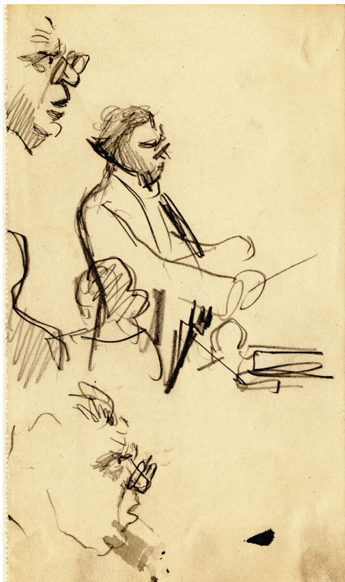
Obrázek 19 – Pietro Mascagni při dirigování. Kresba tužkou, 1925, Západočeská galerie v Plzni.