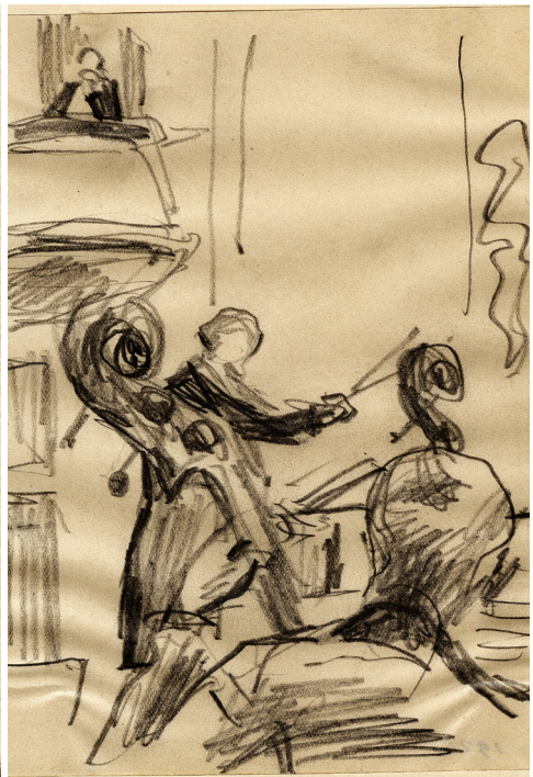
Obrázek 16 (v horní řadě) a 17 (v dolní řadě) – Paul Paray, studie obličejů a dirigentských gest Kresba tužkou, 1924 a Vincent d'Indy před orchestrem Kresba tužkou, Západočeská galerie v Plzni.