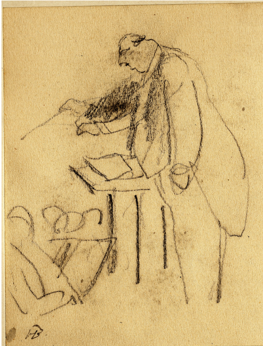
Obrázek 12 – Ludvík Vítězslav Čelanský u dirigentského pultu. Kresba tužkou, Zápa- dočeská galerie v Plzni.