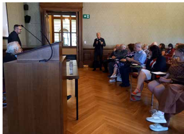
Obr. 10. Ve dnech 20. a 21. 9. se mezinárodní vědecká jungmannovská konference konala v Historické budově Národního muzea, kde mj. v úvodní části zazněl příspěvek Miroslava Hrocha pod názvem „Má setkání s Josefem Jungmannem 1952–2022“.

Vrcholným matičním projektem k Roku Harrachů bylo zhotovení bronzového odlitku busty Jana Nepomuka Františka Harracha, jejíž model v roce 1910 připravil sochař Bohumil Kafka. Busta byla koncipována jako doplněk sochařské galerie osobností zaslouživších se o Národní muzeum umístěné na ochozu interiérové schodišťové dvorany Historické budovy Národního muzea. Vzhledem k velké finanční náročnosti projektu byla uspořádána veřejná dobročinná sbírka, do níž se zapojili četní členové Společnosti Národního muzea a mnohé fyzické a právnické osoby především z východních Čech. Výraznou měrou k úspěchu sbírky přispěli Národní muzeum a vídeňští Češi. Navázání kontaktů s představiteli českého vídeňského života a možnost pravidelného publikování v krajských Vídeňských svobodných listech je dalším přínosem této akce. Busta byla slavnostně představena v Panteonu Národního muzea dne 12. 12., a to i za účasti rodiny Harrachů. Potěšující byl i velký zájem regionálních politiků, starostů obcí a měst a vedení Libereckého kraje.