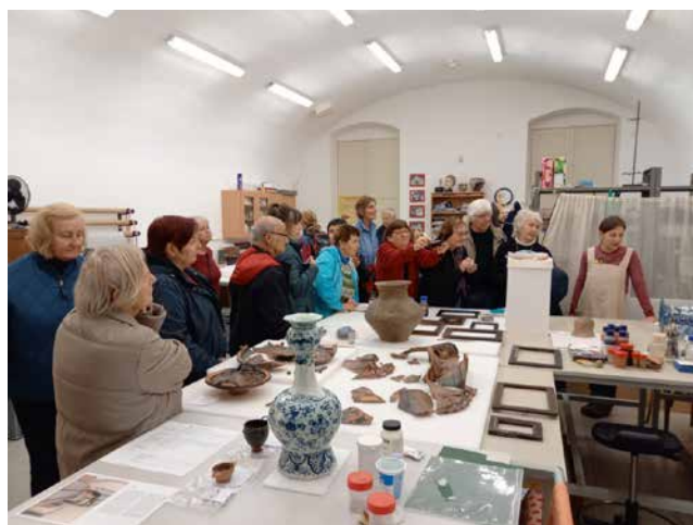
Obr. 13. Členové Matice české měli jedinečnou příležitost navštívit depozitáře Národního muzea v Terezíně, kde jsou i restaurátorské dílny největší české muzejní instituce.

včetně návštěvy zdejšího muzejního restaurátorského pracoviště se specializací na keramiku a sklo. Vše bylo navíc obohaceno prohlídkou podzemí barokní pevnosti, pevnostního hřbitova a cenného kostela sv. Prokopa a Mikuláše v Bohušovicích nad Ohří. Část účastníků se pak vydala pěší procházkou k soutoku Ohře s Labem v Litoměřicích, kde byl