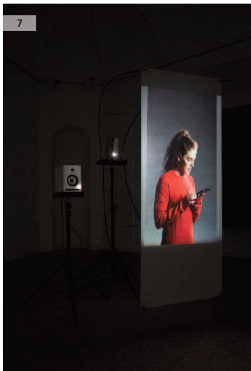
Obr. 8: „Planetárium“ – videoprojekce zdigitalizova- ných knih kroužících u stropu výstavní síně.