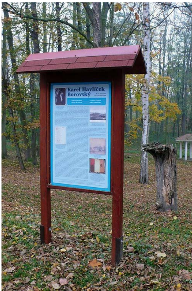
Obr. 4. Dne 4. listopadu 2017 proběhlo slavnostní odhalení panelu na paměť Karla Havlíčka Borovského před bývalou lázeňskou budovou ve Šternberku u Smečna.