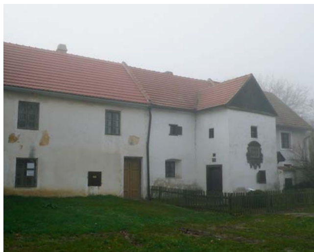
Obr. 6. Rodný dům spisovatele Václava Beneše Třebízského (1849–1884) v Třebízi u Slaného.