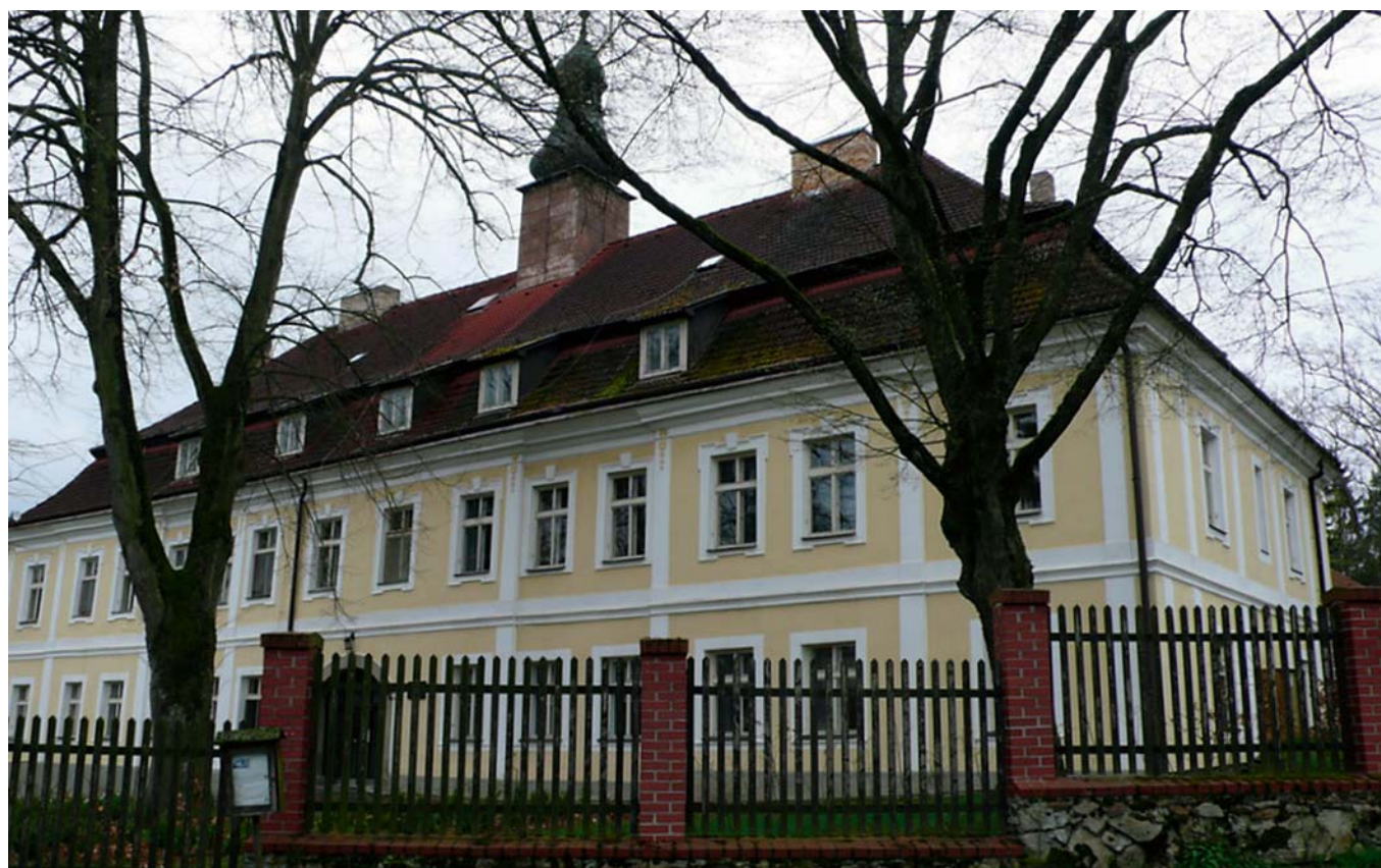
Obr. 9. Na zámku v Těchobuzi u Pacova v letech 1823 až 1841 pobýval filozof a matematik Bernard Bolzano (1781–1848).