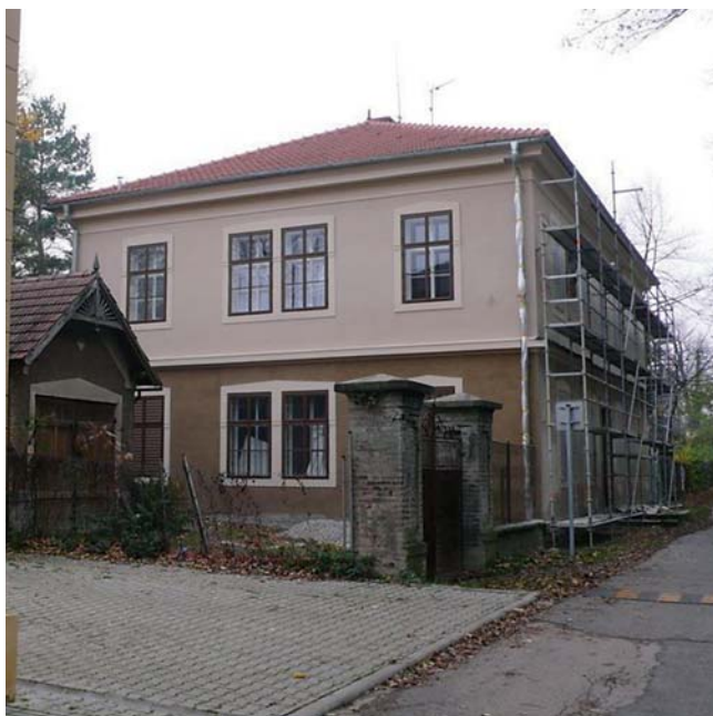
Obr. 5. Bývalá lázeňská budova ve Šternberku, ve které pobýval Karel Havlíček Borovský po svém návratu z Brixenu v roce 1856.