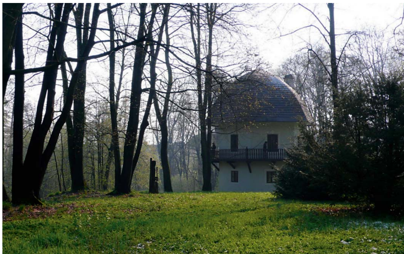
Obr. 8. Klasicistní altán zvaný Hříbek v zámeckém parku v Lukavci u Pacova je spojen s pobyty básníka Antonína Sovy (1864–1928).