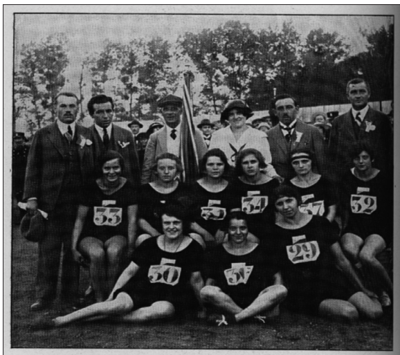
Obrázek 1 – Československá výprava na I. ženských sportovních hrách 1922 v Paříži. Národní muzeum, Sbírková tělesné výchovy a sportu, H7F-30097

její zakladatele i Československo. Důvodem pro vznik samostatného svazu ženských sportů bylo odmítavé stanovisko Mezinárodní atletické federace, která se stavěla proti pořádání ženských atletických závodů. I když v čele mezinárodního svazu stanula žena, 3 v předsednictvu