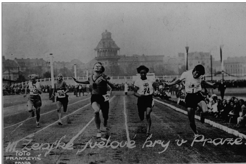
Obrázek 3 – Běžeczký závod na III. světových ženských hrách 1930 v Praze. Národní muzeum, Sbírka tělesné výchovy a sportu, H7F-13084

tvrdili v čele federace její dosavadní předsedkyni Alici Milliat.