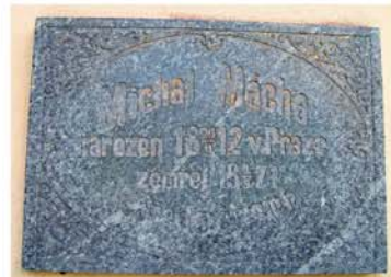
Pamětní deska na kostele Narození Panny Marie v Lochenicích, připomínající místo posledního odpočinku Michala Mácha na zdejším zrušeném hřbitově.