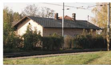
Původní budova nádraží v Předměřicích nad Labem, kde působil Michal Mácha. Byla zhořena v roce 2015.

Kontakt: Matice česká, Václavské náměstí 68, 115 79 Praha 1, tel. 224 497 333, matice_ceska@nm.cz.