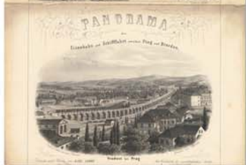
Část panoramatu Severní státní dráhy z Prahy do Drážďan, které pro turistu v roce 1858 zpracoval Josef Rybicka podle Karla Brautla. Na této fotografii zachoval Michal Máchy svou železniční kariéru.