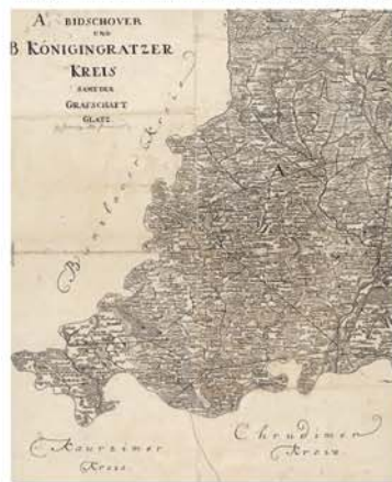
Bidschover und Königingrater Kreis samt der Grafschaft Glatz. Mapa z pozůstalosti Michala Mácha. Obě mapy získal s můchovskou pozůstalostí Emanuel Leštrud. Literární archiv PNP, fond Leštrudcum