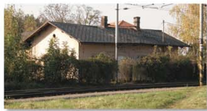
Původní budova nádraží v Předměřicích nad Labem, kde působil Michal Máchy. Byla zbořena v roce 2015.

Zřizovatelé: Národní muzeum – Matice česká, sekce Společnosti Národního muzea, ve spolupráci se spolkem Společnost železniční výtopna Jaroměř a obcí Lochenice – listopad 2018. Typografie, tisk: FAST digital print studio s. r. o., Praha 10. Kontakt: Matice česká, Václavské náměstí 68, 115 79 Praha 1, tel. 224 497 333, matice_ceska@nm.cz.