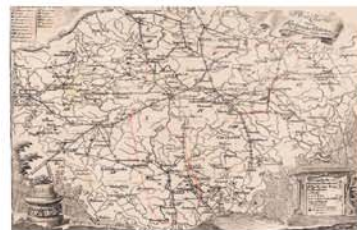
Post Charte vom Königreiche Böhmen verlegt im Jahr 1802. Fragment poštovní mapy z pozůstalosti Michala Mácha. Literární archiv PNP, fond Leštrudcum