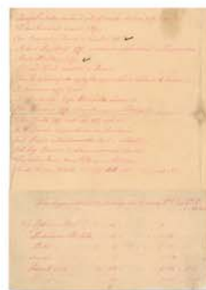
Pravidlopodobný seznam odběratelů prvního vydání Spisů K. H. Máchy v roce 1845. Literární archiv PNP, fond Karel Hynek Mácha