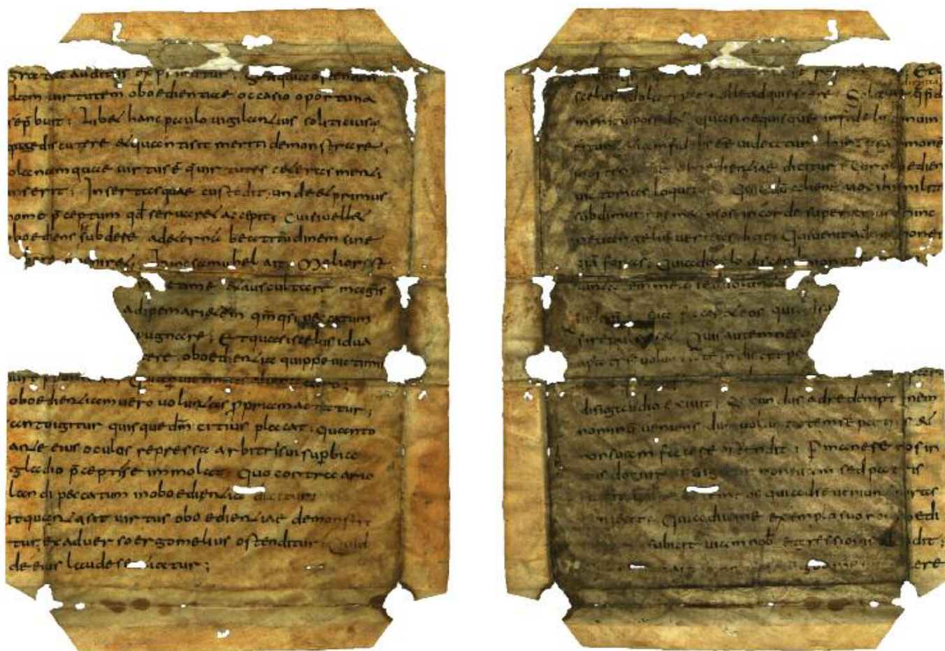
Obr. 1. Zlomek Moralii Řehoře I. Velikého z 9. století. Praha, Knihovna Národního muzea, sign. 1 K 943, fol. 1r–1v.

Popisované fragmenty pocházejí vesměs ze středověku. Nejstarší je list Moralii Řehoře I. z první třetiny 9. století (sign. 1 K 943). Největší objem sbírky pochází ze 14. a 15. století (z 11. století 4 zlomky, z 12. století více než dvacet zlomků), přibližně 13 procent pak z 16. až 19. století. S ohledem na dataci dominuje po jazykové stránce latina (zhruba 70 %), následuje čeština (22 %) a marginálně němčina (4 %), okrajově hebrejšтина a turečtina.