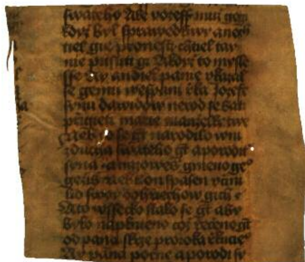
Obr. 2. Zlomek Bible pernštejnské . Praha, Knihovna Národního muzea, sign. 1 K 132, fol. 14v.

krabici, vedly k domněnce, že měly původně tvořit vlastní signaturní řadu. Z mnohých zmiňme například zlomek nek-