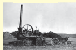
Riegrova lokomobila, jedna z podstatných inovací na velkostatku Maleč