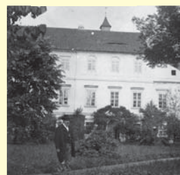
Rieger v zámeckém parku kolem roku 1900