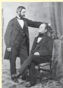
František Palacký a F. L. Rieger, tvůrci české moderní politiky