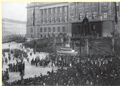
Slavnostní pohřební průvod z Panteonu Národního muzea na Vyšehrad (LA PNP)