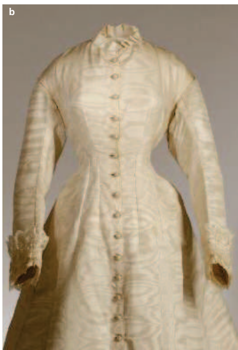
Obr. 4: Korpus na svatební šaty, inventární číslo: H2-25302. Foto: A. Kumstátová, 2016.