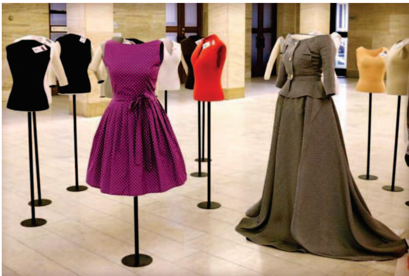
Obr. 6: Příprava výstavy Retro, Nová budova Národního muzea.