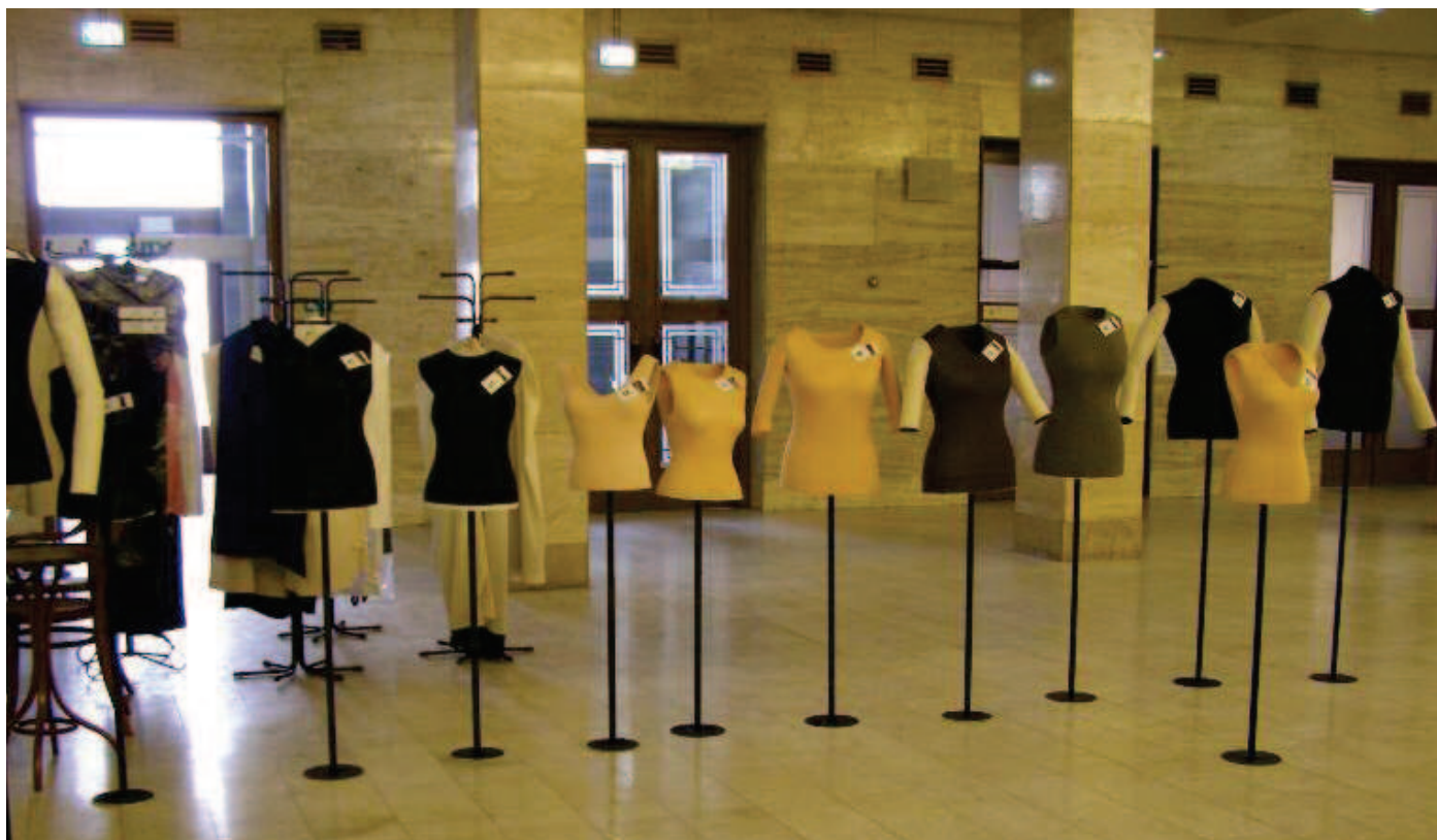
Obr. 5: Příprava výstavy Retro, Nová budova Národního muzea. Foto: D. Fagová, 2016.