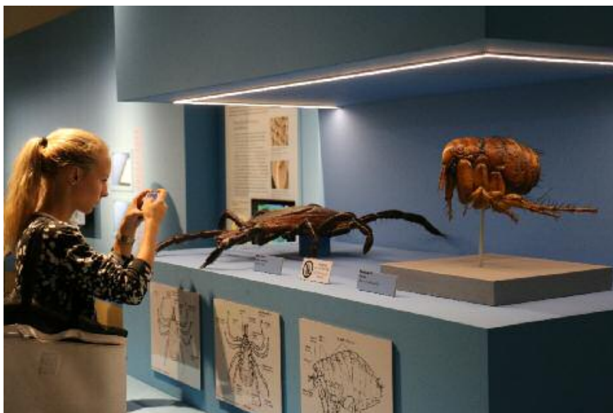
Pohled do výstavy Světlo a život v Nové budově Národního muzea.

základních principů, neboť ve druhé polovině roku Národní muzeum otevírá hned tři klíčové výstavní projekty. První z nich s názvem Světlo a život vychází z nového přístupu k přírodovědeckým tématům. Vzhledem k tomu, že uzavřením Historické budovy ztratila jedna celá generace malých návštěvníků možnost přístupu k velkým přírodovědeckým tématům, snaží se Národní muzeum tuto absenci vykrývat střednědobými výstav-