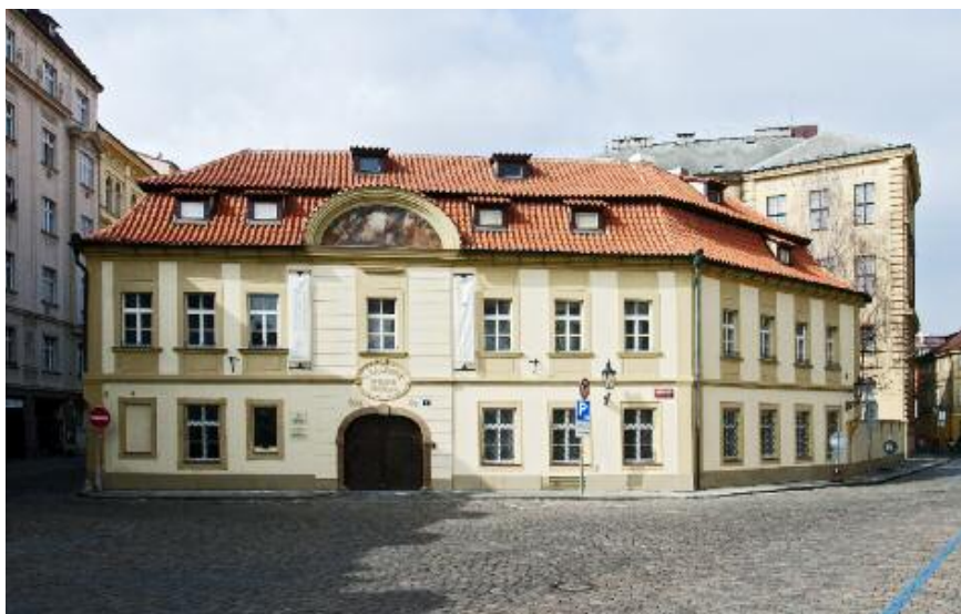
Náprstkovo muzeum asijských, afrických a amerických kultur.

univerzitního ústavu. Zcela jedinečné nálezy tohoto ústavu by se tak mohly poprvé objevit na české půdě a výstava by měla nesporně i mezinárodní návštěvnický ohlas. Rok 2020 bude pak zároveň rokem mnoha výročí, i proto se úvahy o klíčových výstavních projektech ubírají směrem k možnému připomenutí historických událostí, jako je Bílá hora v roce 1620 a období českého baroka či přijetí první československé ústavy v roce 1920. Tento rok bude zároveň rokem, kdy se předpokládá otevření zbylých částí stálých expozic – půjde tedy především o historické části, Pokladníci a zároveň v Nové budově o dětské muzeum. Od tohoto roku by tedy Národní muzeum mělo fungovat v jistém komplexním výstavním modelu, který bude zahrnovat stálé expozice v Historické i Nové budově a variabilní výstavní prostory pro krátkodobé výstavy tamtéž. Vedle toho je ovšem nutné připomenout ještě další aspekty budoucího výstavního výhledu – a to je životnost ostatních expozic Národního muzea.