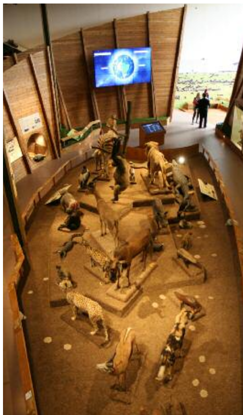
Pohled do expozice Archa Noemova v Nové budově Národního muzea.

Předně je nutné výrazně připomenout, že Národní muzeum není pouze Historická a Nová budova, ale jeho součástí – Knihovna, Přírodovědecké muzeum, Historické muzeum, Náprstkovo muzeum, České muzeum hudby – představují samostatný výstavní potenciál. V letech 2017–2020 chce Národní muzeum navázat na několik svých strategických cílů ve výstavní politice. Předně přinést každý rok jeden klíčový a rozsáhlý výstavní projekt s velkým návštěvnickým potenciálem. Dále pak využít tematické zaměření svých budov a muzeí k prezentaci dílčích témat z oblasti mimoevropských kultur či hudby. Rok 2017 představuje naplnění obou