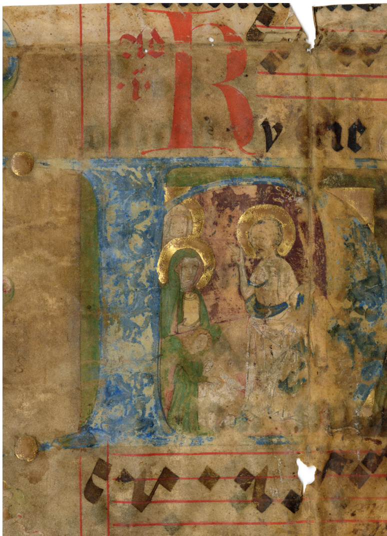
Obrázek 5 – Fragment antifonáře (?) z 2. poloviny 15. století, fol. I v . Královská kanonie premonstrátů na Strahově, v úschově NM-ČMH. Katalog S11.