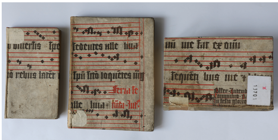
Obrázek 8 – Tři knihy vázané do pergamenu z jednoho a téhož graduálu z 15. století. Knihovna Konventu františkánů v Hejnicích, nyní deponováno v knihovně Konventu františkánů u Panny Marie Sněžné v Praze. Katalog F9, F10, F8.