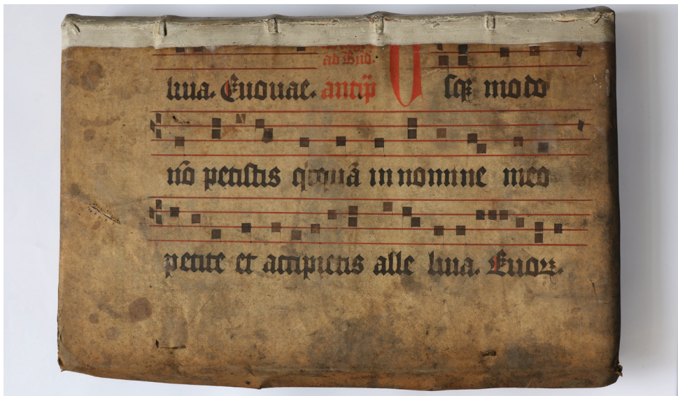
Obrázek 6 a 7 – Fragment antifonáře z 15. století na vazbě knihy, zadní a přední strana. Knihovna Konventu františkánů u Panny Marie Sněžné v Praze. Katalog F2.

Exaudi deus deprecationem, [AV. Prostratus est saevissimus persecutor sed erectus est fidelissimus [001188b], [R. V]ade Anania et quaere Saulum ... × ...nomen meum [007814]