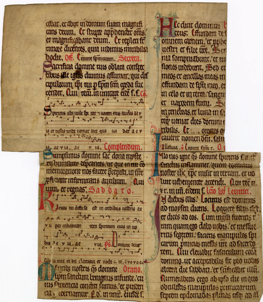
Obrázek 4 – Fragment misálu (?) z 13. století, fol. 1 r , složené ze dvou částí. Královská kanonie premonstrátů na Strahově, v úschově NM-ČMH. Katalog S8/a.

Joseph exutus tunica, 28 Curatusque dicitur a domino, 29 R. Iste [est] frater vester minimus ... × ... et non pote[rat][006999],