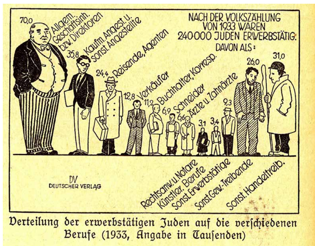
Obr. 6. Antisemitistický plakát z 30. let 20. století ukazující údajné počty občanů židovského původu v jednotlivých profesích.