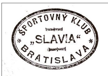
Obrázek 1 - Podoba pečiatky ŠK Slávia Bratislava z roku 1926

V Bratislave sa ocitli v prvej polovici 20. rokov 20. storočia vedľa seba zrazu kluby maďarské, nemecké, židovské a slovenské či československé a spolupráca bola pojmom takmer neznámym. Základné smerovanie i zložitý národnostný pomery škodiace športu mala riešiť Československá obec športová stojaca na čele športových zväzov už od jesene 1918, ktorá sa v roku 1928 pretransformovala na Československý všešportový výbor. Tieto ústredné orgány sídlia v Prahe pôsobili ťažkopádne a koordinačne prakticky absentovali. Navyše, Slovensko v nich nemalo ani jediného zástupcu. Napriek ťažkej situácii a zdanlivo neprekonateľným problémom dokazoval šport svoju silu a životaschopnosť. 3