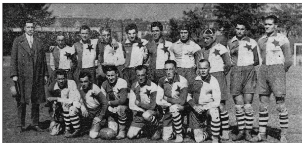
Obrázek 5 – SK Slávia Praha v roku 1928

Slávia Praha sa v nasledujúcich sezónach dostala na piedestál československého ragby. Pritom sa v roku 1926 v Prahe prakticky nehrávalo, no o dva roky neskôr, v roku 1928, existovalo v hlavnom meste už osem klubov – Slávia, Sparta, Rugby Club, Vysokoškolský sport, Hagibor, Boxing Club, Peší pluk 28, 5. ženijný pluk a pripočítat' k nim možno aj Boxing Club Kladno. Toto „preskupovanie síl“ v hre so šiшатou loptou zohralo veľmi dôležitú úlohu pri sťahovaní sídla Československej asociácie ragby vo februári 1928 z Bratislavy do Prahy.