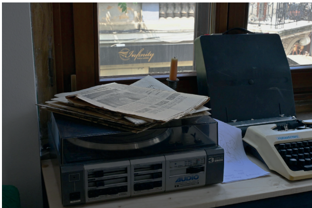
Obr. 1. Muzeum obětí komunismu v Bukurešti

je vnímána jako účinnější, zapamatovatelnější a měla by být zohledňována v každé expozici, která chce funkčně promlouvat k návštěvníkům.