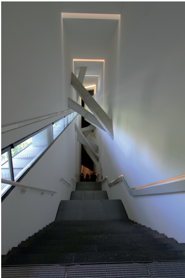
Obr. 3. Židovské muzeum Berlín

munikací významně ovlivňují emoční klima. Muzejní pedagog, který je schopen vnímat a reflektovat emoce, vytváří bezpečný prostor, který podporuje otevřenost, spolupráci a angažovanost.