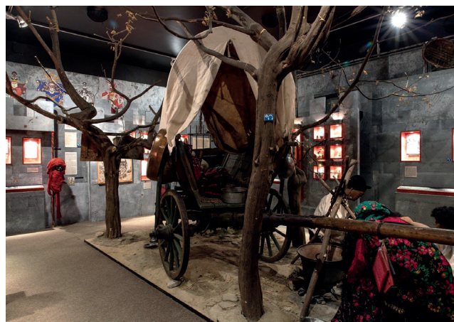
Obr. 5. Muzeum romské kultury v Brně

Muzeum s netradiční profilací vystavuje předměty, které symbolizují ukončené vztahy, spolu s osobními příběhy jejich dárců. Kurátorský přístup staví na autenticitě a emocionální síle sdílené lidské zkušenosti, jako je bolest, láska, zklamání či naděje. Návštěvníci často