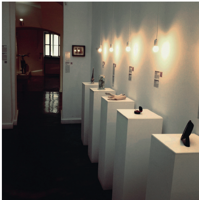
Obr. 2. Muzeum rozpadlých vztahů v Záhřebu

Součástí práce muzejního pedagoga je facilitace emocí, vytváření prostoru pro jejich pojmenování, sdílení a velmi důležitou reflexi, která by neměla v edukačním procesu chybět. Proto je potřeba, aby kompetence šly ruku v ruce se schopnostmi muzejního pedagoga. Jsou to: