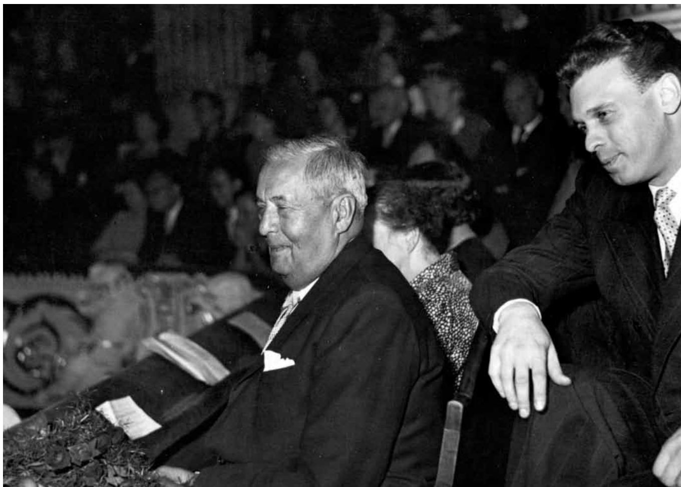
Komorní koncert na počest národního umělce Václava Talicha, Dům umělců, 28. září 1957.