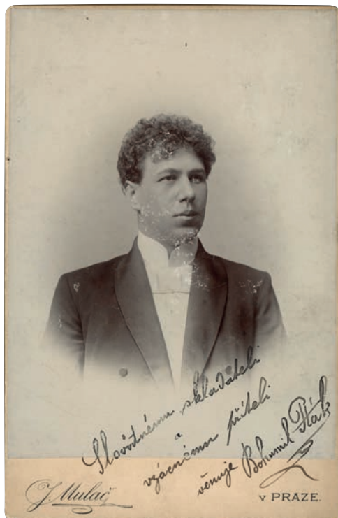
Bohumil Pták (1869–1933)

The gramophone company Pathé , the label of which exists in France to this day, was founded in 1895 in Paris. It originally manufactured cylinders for phonographic recordings, but it soon began making the recordings themselves, and later it added the manufacture of its own phonographs. The