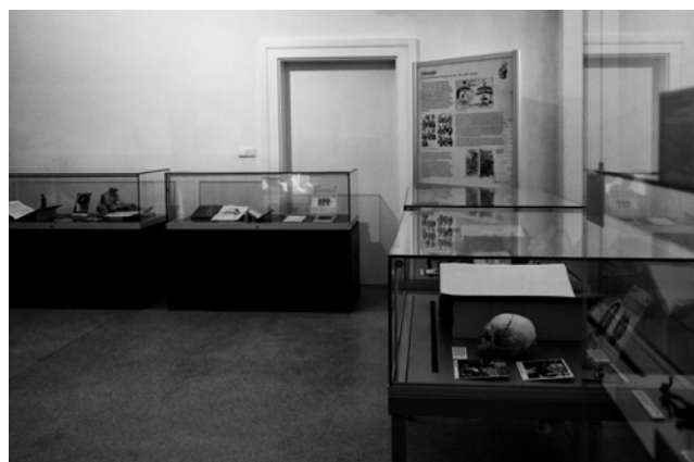
Obr. 5. Pohled do výstavního prostoru.