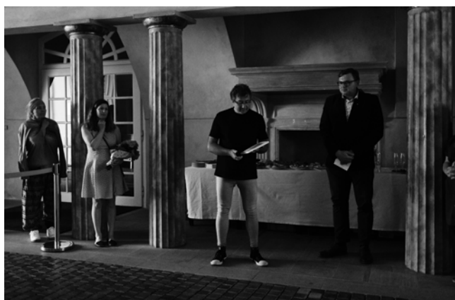
Obr. 4. Vernisáž výstavy.

Vzhledem k dlouholeté lázeňské tradici, kterou se pyšní Lázně Kynžvart, byla pozornost věnována též balneologii.