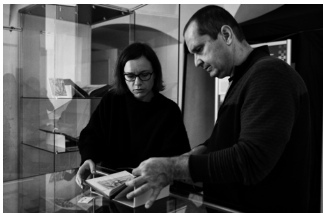
Obr. 2. Instalace výstavy.