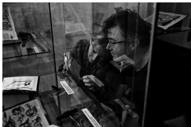
Obr. 3. Instalace výstavy.

pasáží v lékařských textech se můžeme setkat v exemplářích pocházejících ze zámecké knihovny Český Krumlov. Marie Ernestina kněžna z Eggenbergu (1649–1719), již se nikdy nepodařilo počít, si v exemplářích svých lékařských knih zatrhávala nejčastěji pasáže věnované ženským potížím či neplodnosti. 3 Dalším z možných důvodů k akvizici titulů z oboru lékařství byl aktivní zájem šlechtice o medicínu jako takovou. Uznání za své diagnostické znalosti se těšil například významný diplomat a státník Klement Václav Nepomuk Lothar kníže z Metternich-Winneburgu (1773–1859), který se pravidelně účastnil lékařských konzilií věnovaných nemocným členům své rodiny. 4