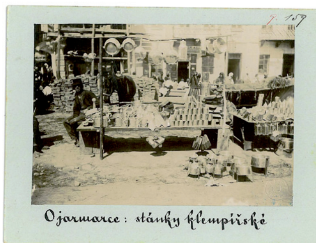
Obr. 8. „O jarmarce: stánky klempiřské“, východní Halič, 90. léta 19. století, NM – NpM, sbírka historických fotografií, sig. 9.0159.

Období Řehořovy aktivní fotodokumentační činnosti částečně poodhaluje dopis z 24. září 1892 adresovaný Josefě Náprstkové. Dozvídáme se z něj mnohé o způsobu, jakým se Řehoř chystal sbírku fotografií sestavit. Množství požadova-