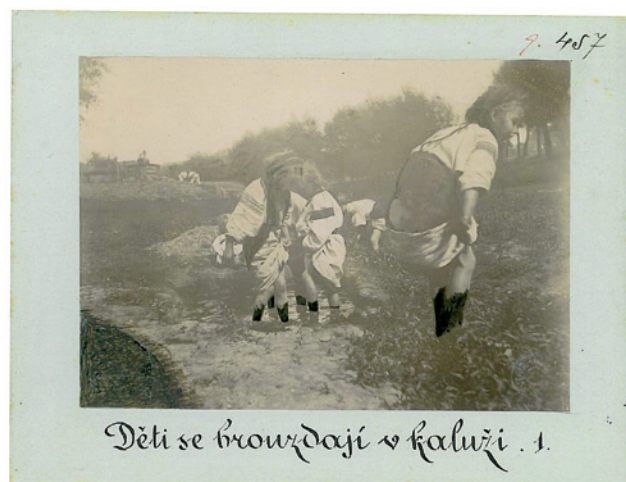
Obr. 3. Příklad retušované fotografie. „Děti se brouzdají v kaluži 1.“, Tyškvivci, východní Halič, 90. léta 19. století, NM – NpM, sbírka historických fotografií, sig. 9.0457. Foto František Řehoř.

F. Řehoře uložené v Náprstkově muzeu asijských, afrických a amerických kultur. 9