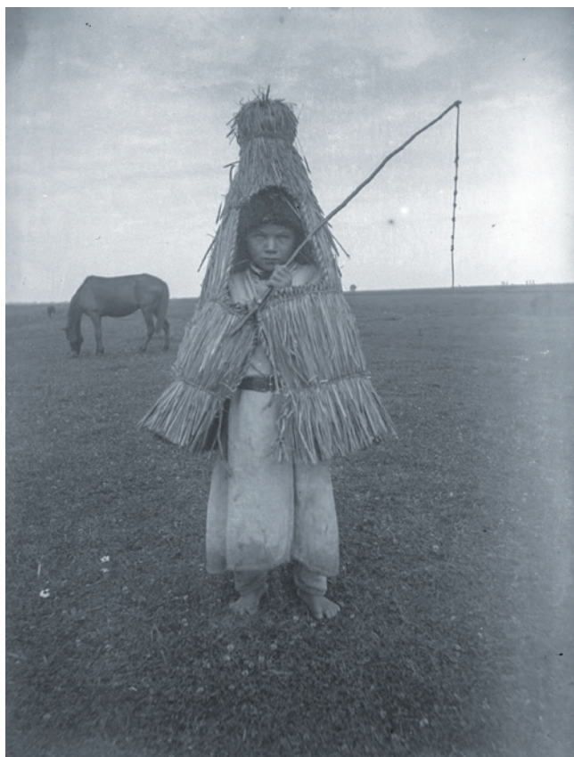
Obr. 11. „Pasák v slaměné rohoži v Berežnici Královské“, Berežnycja, východní Halič, 90. léta 19. století, František Řehoř, ANM, EAO n IX_124.

zaměstnání (polní práce, domácí práce a řemesla), festivity (církvní svátky, výroční a rodinná obřadnost). Jako samostatný celek oba autoři shodně, zřejmě pro jeho široké zastoupení, uvádějí trhy. Valášková pak řadí mezi významné celky oděv. V souboru je zároveň možné odhalit řadu podtémat, s kterými se setkáváme napříč kategoriemi. Jednou z nich je odpočinek 65 či svět dětí. S tématem festivit se prolíná téma hry a tance. Materiál dokumentuje tradiční rozdělení mužských a ženských rolí. Objevují se rovněž témata zastoupená na fotografii pouze okrajově či asociace, které s fotografovaným obsahem vzdáleně souvisejí.