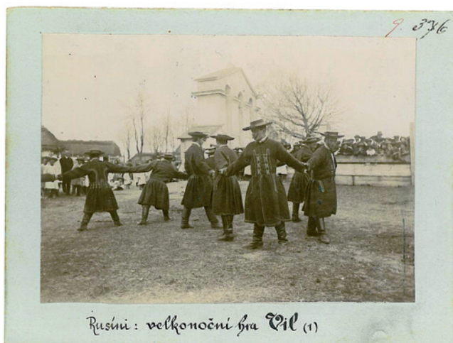
Rusíni : velikonoční hra Vil (1)