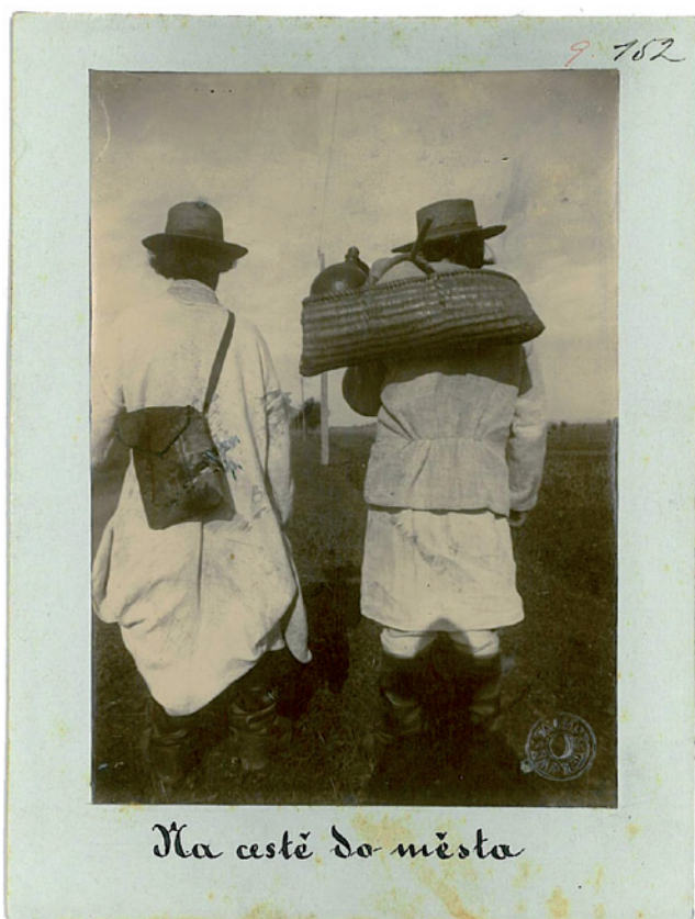
Obr. 13. „Na cestě do města“, východní Halič, 90. léta 19. století, NM – NpM, sbírka historických fotografií, sig. 9.0152.

kožich hřál, oblékla jej obrácený, jednak [...] kůže chladí, jednak nepopraská od slunce. 71