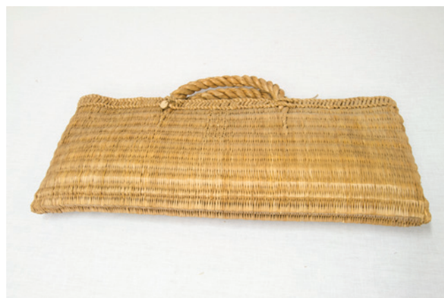
Obr. 14. Pletená taška z orobince ze sbírky Františka Řehoře, východní Halič, poslední čtvrtina 19. století, NM H4-NS-1338. Foto Olga Tlapáková.

Fotografická sbírka Františka Řehoře představuje významný zdroj informací, který svým obsahem přesahuje přínos fotografie jako ikonografického pramene. Jedná se o výsledek precizní dlouhodobé badatelské činnosti se záměrem maximalizovat výpovědní hodnotu pořízeného materiálu. Toho se Řehoř snažil docílit pečlivým popisem snímků s odkazy na různé souvislosti s dalšími fotografiemi. Takto pečlivá dokumentace je pro závěr 19. století nadstandardní.