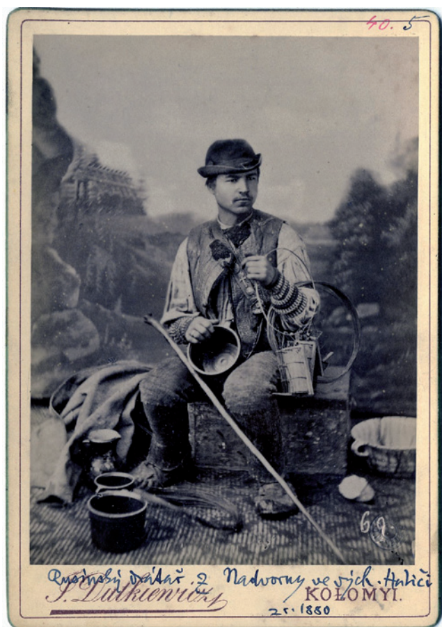
Obr. 1. „Rusínský drátař z Nadvorny ve východní Haliči“, Nadvirna, východní Halič, 1880. Národní muzeum – Náprstkovo muzeum, sbírka historických fotografií, sig. 40.0005.

O čtyři roky později připravila Milena Secká CD-ROM, na kterém publikovala kompletní přehled fotografické sbírky