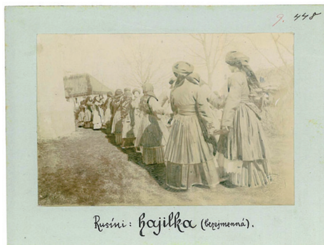
Obr. 2. Příklad retušované fotografie. „Rusíni: hájilka (bezejmenná)“, východní Halič, 90. léta 19. století, NM – NpM, sbírka historických fotografií, sig. 9.0448. Foto František Řehoř.