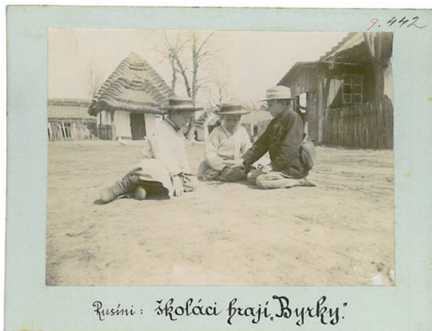
Rusíni : školáci hrají „byrky“

Denysova okresu Tarnopolského v Haliči K mužským hram a zábavám praktickým s oválných velikonočních na okraji kolem kostela nebo v bezprostřední blízkosti (v našem případě) a za účasti nečetného publika, naleží Vil. To hrají mladší v stáří od 16 let a jiní bývají nejvíce. Ku hrá se vidí jak vidno z obrázku, d. j. v křivce asi takového tvaru: Obíhají na této křivce a, b, c, ... h hráči po své se střídají za ním, každý hráč první a, jaksi více stojí čelem do svého středu, opačně stojí druhý ale na venek. Během první zrychlením krokem křivku dále zkrátí druhou jako vyčíslovanou, následkem čehož chasník b musí běžeti rychleji, chasník c opět rychleji než b ať se po posledních několikrát již právě zrovna ledí. (dokončení na obrázku č. 2) GESKE PRŮMYSLOVÉ MUSEUM Řehoř