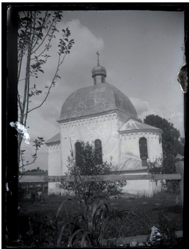
Obr. 7. „Cerkov v Lesienicích (zděná)“, Lysyňci, východní Halič, 90. léta 19. století, František Řehoř, Archiv Národního muzea, EAO n XIV_198.

záhy využil v článcích vydaných například ve Světozoru v roce 1881 a 1882. 37 Publikovány nebyly přímo zakoupené fotografie, ale kresby dle nich vytvořené. 38 Nabízí se také úvaha nad snahou zachytit z hlediska konzervace a skladování problematické části hmotné kultury, jakou byl oděv. 39 Zároveň je pravděpodobné, že si Řehoř, který opakovaně prokazuje snahu o co možná nejkomplexnější zmapování situace, již v této době uvědomoval význam obrazové dokumentace.