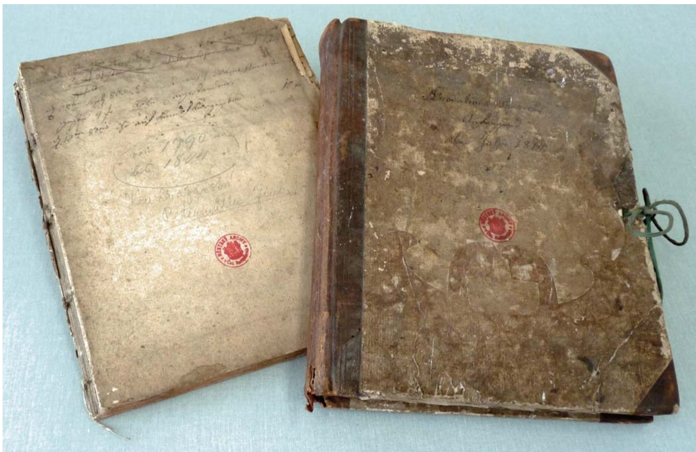
Obr. 1. Účetní knihy Zinkovy knihařské dílny.