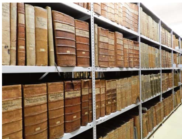
Obr. 8. Pohled do depozitáře Státního okresního archivu České Budějovice. Dochované svazky městských knih z Archivu města Českých Budějovic pocházejí z valné části právě ze Zinkovy knihařské dílny.

jsou účetní záznamy pro rok 1828. František Zink tehdy vyhotovil pro správu města celkem 95 svazků nejruznějších úředních a účetních knih (za celkovou cenu 181 zlatých), ale kromě toho také opravil vazby 19 kusů starších pozemkových knih. Jejich poškozené vazby vyspravil novou kůží a zhotovil k nim nové kožené vázací proužky, za což si na-