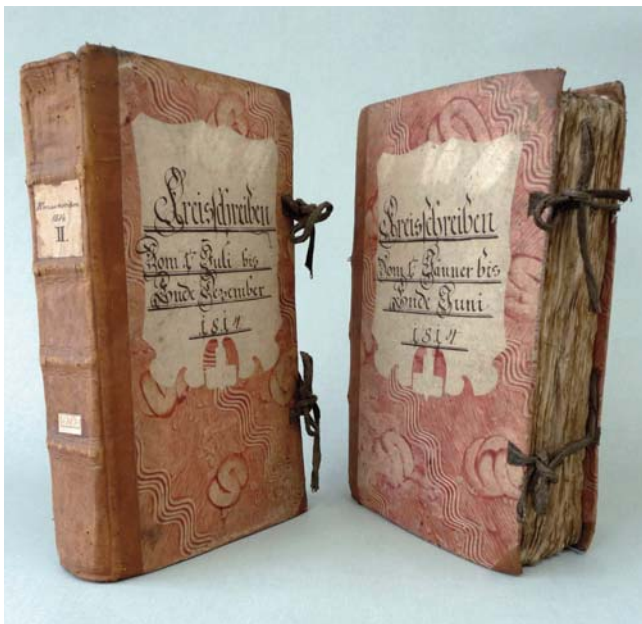
Obr. 5. Dva svazky knih krajských psaní z roku 1814, svázané Zinkovou dílnou v lednu následujícího roku. SOKA ČB, fond Archiv města České Budějovice, knihy č. 2044 a 2045.