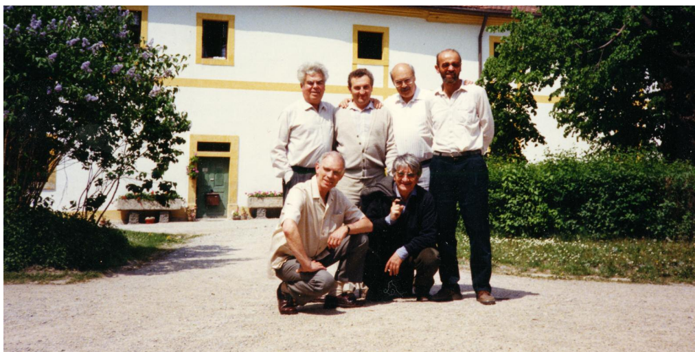
Zakladatelé Československého dokumentačního střediska v Scheinfeldu.