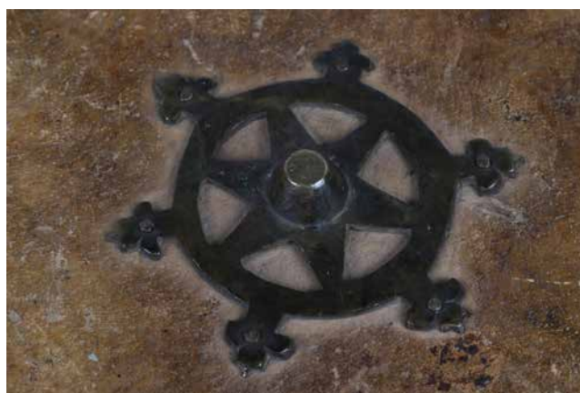
Obr. 18. Středové kování typ 3 (sign. XV A 11).

na konci zešíkmeného žlábků uchyceny příčně dřevěným klínkem. Často je upevnění ze strany přideští podpořeno jedním nebo dvěma dřevěnými kolíčky. Žlábků se záměrně vyznačují nestejnou délkou, aby se při klínkování vazů umístěných v jedné řadě zabránilo častému prasknutí desek. Při druhé poměrně časté variantě bývají vazy uchyceny v horním žlábků jedním nebo dvěma dřevěnými kolíčky. Bukové desky jsou svrchu mírně hraněné, hřbetní hrana je v obou případech nasazení taktéž zkosená z vnější strany, aby desky plynule navázaly v drážce na zaoblený tvar knižního bloku, proto jsou i mezivazní přelepy hřbetu umístěny shora. Desky bývají profilovány na přední hraně pro zapuštění řemíneků spon.