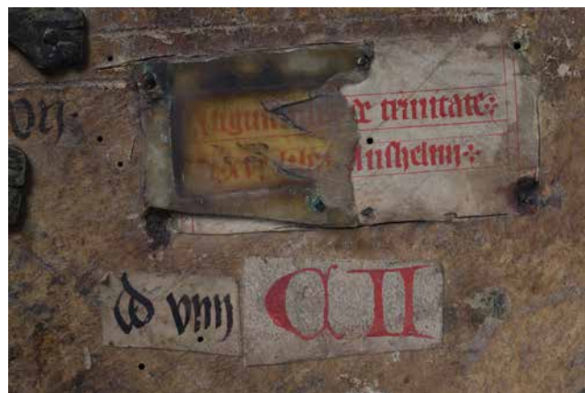
Obr. 5. Roudnické signatury druhé a třetí vrstvy na pergamenových štítcích a štítek s knihovním zápisem překrytý rohovinou (sign. XII A 6).

Ve 14. a 15. století se v roudnické knihovně postupně uplatňoval systém až tří typů signatur, složený vždy z písmene a římské číslice. Nejstarší signatury jsou psány červeným inkoustem zpravidla na předním přideščí nebo prvním listu, majuskulní písmeno a římská číslice ohraničeny body a stejnou barvou orámovány. Červené signatury druhé vrstvy jsou zaznamenány na pergamenových štítcích, které byly mezi lety 1417 a 1421 nalepeny na horní část přední desky. Nejmladší, třetí vrstva roudnických signatur z doby pohusitské složená z černého písmene a římské číslice se opět nachází na pergamenových štítcích stejného umístění. Tato vrstva již označuje i přiřčené sadské a jaroměřské rukopisy. V roudnických rukopisech bývají vlastnické přípisky v různých provedeních – Rudnicensis, liber Rudnicensis, liber Rudnicensis monasterii, liber monasterii Rudnicensis, liber monasterii sancte Marie in Rudnicz a iste liber est Rudnicensium canonicorum . Nejčastěji jsou umístěny na výlepech přideščí, na okrajích