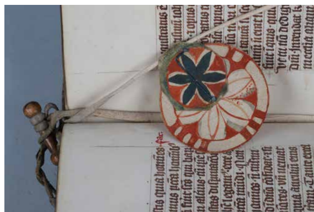
Obr. 6. Pohyblivá záložka s otočným kolečkem upevněná na dřevěnou tyčku s kruhovým profilováním (sign. XIII A 13).

prvního listu, někdy uvnitř bloku nebo ve hřbetní části posledního listu psané kolmo k textu. 59