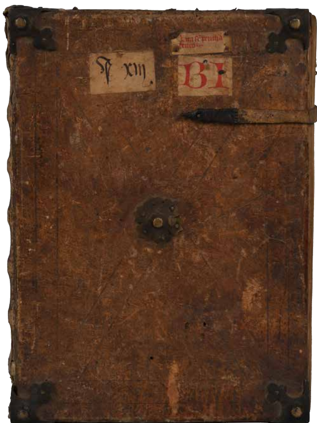
Obr. 22. Roudnická vazba druhého seskupení se slepotiskovou výzdobou ve tvaru ondřejského kříže (sign. XIII B 1).

svazků byly po obou stranách doplněny sponami stejného typu, častěji však dvěma háčkovými sponami s ruličkovou záchytkou. 83 Spony s protáhlým zužujícím se tělem jsou zakončeny rozšířenou kvadratickou hlavou nebo oválnou hlavou s kloubem. Hlava je opatřena otvorem pro nasunutí na podložený trn v přední desce a výběhem s očkem pro úchytku. Úchytky z torďovaného jirchového řemínku je provlečena očkem a zakončena uzlem. 84 Spony jsou přinýtovány k silnému jednovrstvému jirchovému řemínku, který je vložen mezi tělo a fixační štítek spony. Na zadní desce je řemínek vsunut do žlábků pod potahem a připevněn obdélníkovým fixačním štítkem. Jirchové řemínky jsou u několika rukopisů nahrazeny textilními – ozdobně tkanými keprovou vazbou v příznačné kombinaci modrých a bílých nití a nití dalších barev. 85