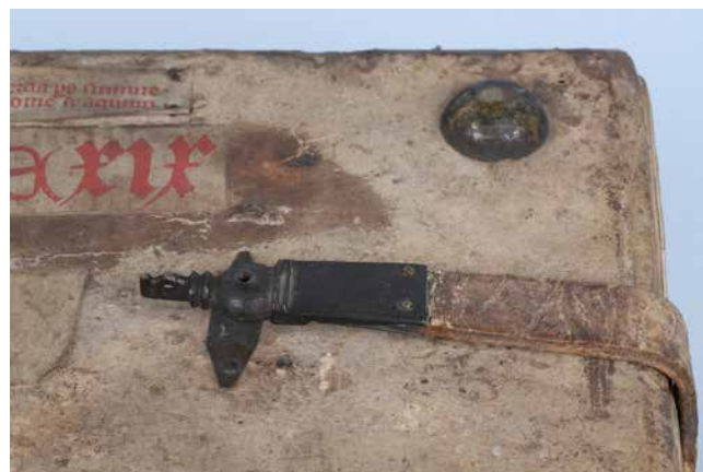
Obř. 20. Desková dírková spona a mosazná knoflíkovitá pukla na přední desce (sign. XVI B 6).

Do poslední, čtvrté, tvarově pestřejší skupiny jsou zařazeny kodexy s prosekávanými deltoidními nárožnicemi a kbelíkovitými puklami, společným morfologickým znakem jsou dva trojlístkové výběhy z rohů nárožnic a gotická lilie zdobící vrchol (typ F). 73 Vzhledem k rozdílnému nabytí rukopisů čtvrté skupiny roudnickou kanonií je možné najít typovou shodu nárožnic u kodexů z Jaroměře a z kostela sv. Víta, sadské rukopisy z této skupiny jsou částečně tvarově odlišné. U ostatních sadských kodexů je obtížné nalézt jednotný vzor. V celém různorodém souboru vykazuje stejný styl pouze několik vazeb s nárožnicemi vykrajovanými