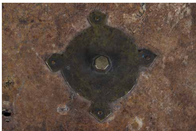
Obr. 16. Středové kování typ 1 (sign. XIII B 13).