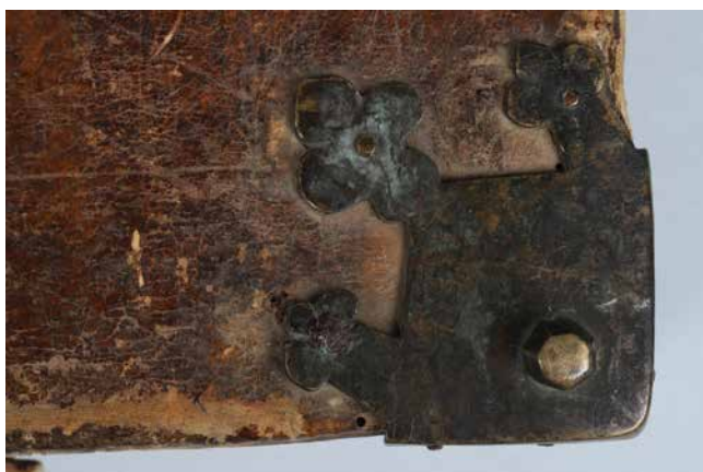
Obr. 10. Nárožnice typ B (sign. XII A 15).