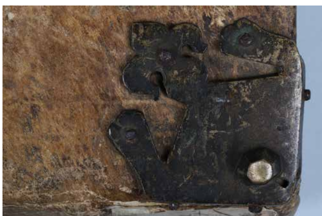
Obr. 11. Nárožnice typ C (sign. XIII A 3).