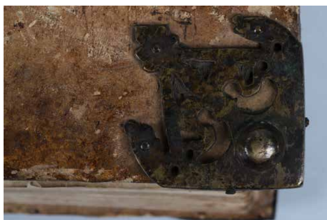
Obr. 14. Nárožnice typ F (sign. XII A 17).

rozsahem naprosto ojedinělý. Z tohoto důvodu bude komplexněji představen v samostatném příspěvku. 67 Další typy vazeb se variantně odvíjí od klasické formy gotického kodexu.