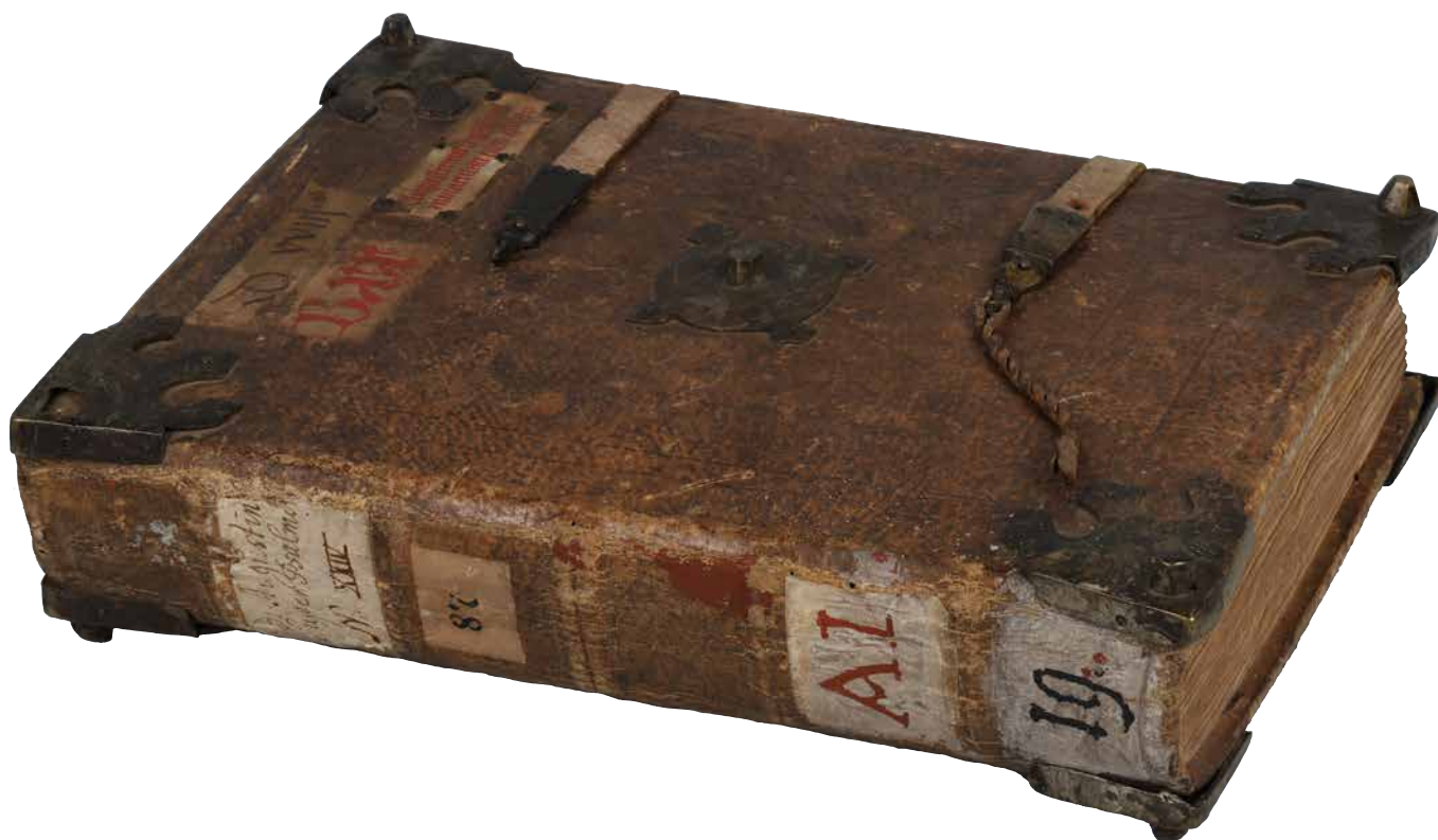
Obr. 21. Roudnická vazba prvního seskupení s deskovou dírkovou sponou a dochovanou úchytkou (sign. XIII B 6/b).

Kromě charakteristických roudnických vazeb prvních dvou seskupení s ustálenými kompozičními vzory středověho a nárožního kování se dochovala také významná část vazeb s puklami knoflíkovitého tvaru. 76 Tyto pukly bývají na obou deskách jak mosazné, tak i železné, mosazné se vyskytují také v kombinaci se železnými a dřevěnými puklami na zadní desce. U donací Arnošta z Pardubic se často zachovalo kromě železných knoflíkovitých pukel také železné nárožní nebo rohové kování. 77 Ponejvíce z darů pochází homolovitě pukly s rýhováním 78 a na vazbách z počátku 15. století se objevují kloboučkovité. 79 Mladší dřevěné homolovitě a dřevěné kloboučkovité pukly nahrazují na zadní nebo i na přední desce pukly kovové, ve třech případech plní funkci středové pukly. 80 Pukly jsou pevně vsazeny do otvorů vyvrtaných