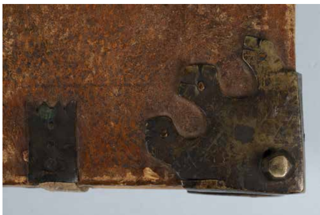
Obr. 9. Nárožnice typ A (sign. XIII B 6/b).