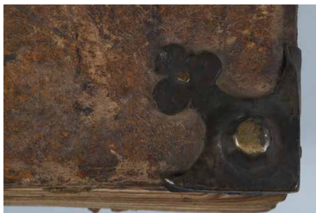
Obr. 13. Nárožnice typ E (sign. XIII B 1).