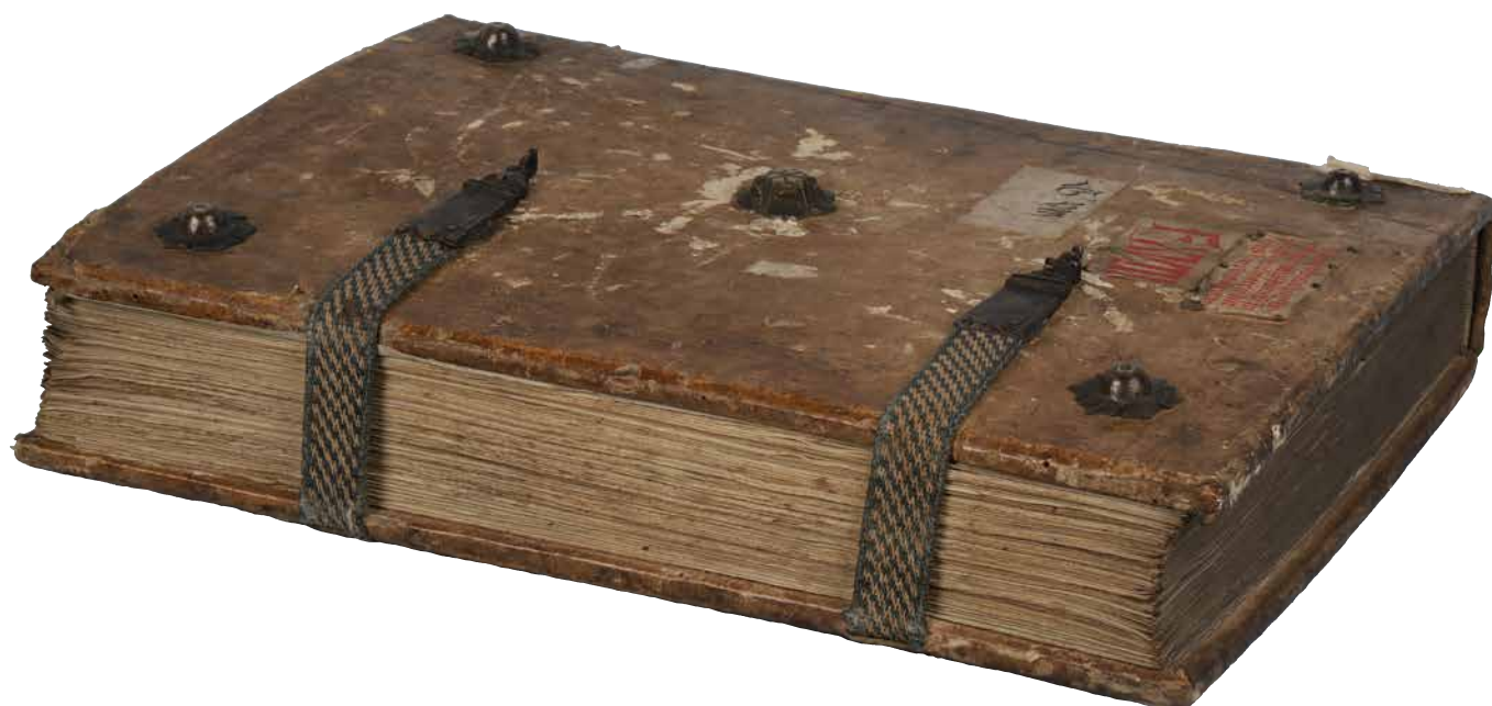
Obr. 23. Roudnická vazba druhého seskupení s ozdobně tkanými textilními řemínky (sign. XII B 4).

Do typických roudnických kodexů prvního, druhého a čtvrtého seskupení byly převážně vázány rukopisy s filiigránovou výzdobou zařazené do okruhu tzv. Sampsonova rukopisu 88 spadajícího do druhé čtvrtiny 14. století a početná skupina iluminovaných rukopisů Augustinus super Johannem 89 vzniklých kolem roku 1360. Na pořízení mnoha roudnických rukopisů především z druhého malířského okruhu se donátorsky podílel arcibiskup Arnošt z Pardubic . 90 Systematické rozdělení honosnějších vazeb do prvního a druhého seskupení podle kovových prvků přispělo k jejich přesnějšímu chronologickému zařazení. Většina kodexů prvního seskupení s masivním nárožním a středovým kováním je datována kolem poloviny 14. století. Druhé seskupení zahrnuje několik vazeb spadajících do druhé poloviny 14. století, i s ohledem na subtilnější provedení následuje až po početnější skupině vazeb prvního seskupení. Roudnické vazby čtvrtého seskupení s kovovými knoflíkovými puklami byly podle kodikologicky stanovené