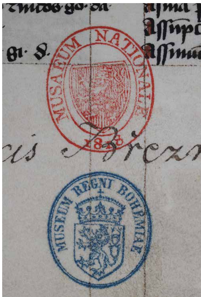
Obr. 2. Nejstarší razítko Musaeum nationale 1818 otištěné přes rukopisné exlibris (sign. XIII A 9).

a iluminátorské práce a vazba byla zhotovena až v dílně, se kterou roudnický klášter úzce spolupracoval. 46 Rozbor vazeb byl dále rozšířen o soubor březnických rukopisů vzniklých v předhusitském období, u kterých mohla být podle předpokladů roudnická proveniencce doposud blíže neurčena. Při určování podobnosti dílenského zpracování je nutné nejprve přihlídnout k celkové formě kodexu. Mezi roudnickými lze nalézt jak starší románské vazby, tak i několik typů gotických. Každá z intaktně dochovaných středověkých vazeb