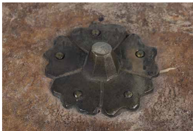
Obr. 17. Středové kování typ 2 (sign. XVI B 13).