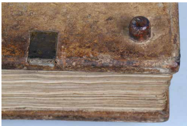
Obř. 19. Dřevěná homolovitá pukla a obdélíkový fixační štítek na zadní desce (sign. XIV A 5/a).

listy naznačeny linkou (typ A). 68 Propracovanější nárožnice druhé skupiny mají kosodélníkový tvar, dominantnější vrchol je zakončen čtyřlístkem a subtilnější postranní výběhy trojlístkem (typ B) 69 nebo s vrcholem ve tvaru lilie (typ C). 70 Pro třetí skupinu jsou příznačné tvarově výraznější nárožnice menšího rozměru. Ze hmoty chránící hranu desky vybíhají menší výběhy spojené s nápadným vrcholem ve tvaru trojlístu (typ D) 71 nebo s trojlístkovým vrcholem bez postranních výběhů (typ E). 72 Všechny uvedené typy nárožního kování jsou blíže rohu opatřeny výraznými šestibokými kulíkovitými puklami. Mezi skupinami s menšími tvarovými odchylkami lze najít podobnost ve způsobu zpracování mosazného kování. Masivní lité rohové a středové kování roudnických kodexů je hrubě opracované, nárožnice mají nepravidelný kosoúhlý tvar. Zajímavým zjištěním je použití vícero typů nárožnic u kodexů sign. XIII A 3 (typ B, jedna typ C), XIII B 13 (typ A, jedna typ C) a XVII A 4 (nárožnice typ A, jedna typ C a jedna typ F z následující skupiny).