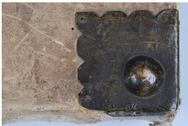
Obr. 15. Náročnice typ G (sign. XII A 19).