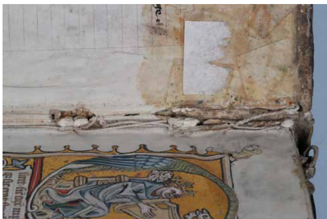
Obr. 4. Fragment strženého štítku (sign. XII A 13).

Mezi původní neořezaný blok a desky se vložila nová předšádka z přehnutého dvoulistu ručního papíru, který se vylepil na přideščí. U mnoha muzejních rukopisů byly takto odstraněny stopy po nalepených štítcích. 57 Volná část předšádkového listu zůstala ve hřbetě nalepena na přilehlé pergamenové folio. Tento nešvar převzatý z novodobé technologie ruční vazby vede k poškozování malířské výzdoby a rukopisného textu. Pozdější převazby z konce 19. a 20. století odráží soudobé trendy knihařského zpracování vazeb. Při konzervaci se krajní složky obtáčely plátěným proužkem, vyklepávala se drážka a přideščí vylepovalo ručním papírem po vzoru francouzské vazby. 58 Restaurátorské převazby a opravy muzejními knihaři z druhé poloviny 20. století mnohdy nepřispěly ke zlepšení užitných vlastností vazeb, neboť se výrazně zhoršila flexibilita hřbetu.