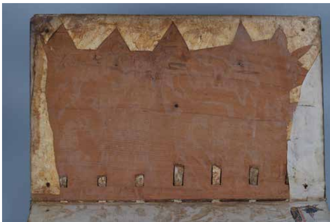
Obr. 7. Vnitřní strana desky se žlábkami různé délky a kónovitě vyřezanými záložkami (sign. XII A 16).

v souvislosti s nuceným přemístěním knihovny během husitských bouří. 61 Vlastnické záznamy občas záměrně poničili pozdější majitelé. Nutno podotknout, že pergamenové štítky typické pro roudnické a sadské kodexy se při „muzejních převazbách“ navracely zpět na desky. Kromě toho se jak u roudnických, tak i sadských kodexů zachovaly na přední desce pergamenové štítky s knihovnickými zápisy, jež psalo červeným inkoustem vícero rukou. Štítky jsou u některých kodexů překryty destičkou z rohoviny, která je zpravidla uchycena mosaznými hřebíčky. Větší zastoupení štítků s rohovinovou destičkou vykazují roudnické kodexy. 62