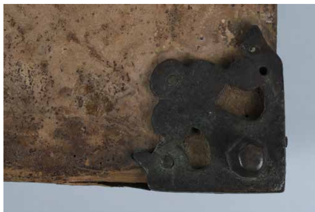
Obr. 12. Nárožnice typ D (sign. XIII B 11).