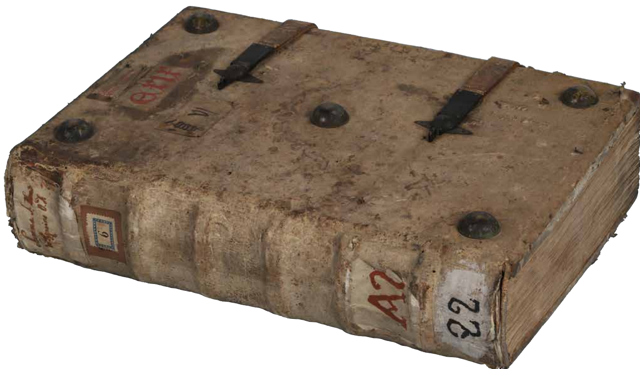
Obr. 24. Roudnická vazba čtvrtého seskupení (sign. XVI B 6).

vůbec. 93 Vzhledem k tomu, že Arnošt z Pardubic nechával v „církevní dílně“ opisovat rukopisy patrně po celé funkční období 1343–1364, 94 je tedy zřejmé, že charakteristický soubor roudnických vazeb vznikl nejspíše v souvislosti s působením tohoto skriptoria, pro které musela v úzkém kontaktu pracovat knihvazačská dílna. Kompaktní celek roudnických vazeb prvního a druhého seskupení je natolik typologicky odlišný, že musel být pořízen v jediné dílně. 95 Pozdější provozování vlastní klášterní knihvazačské dílny není zcela vyloučeno, menší dílna mohla fungovat v mateřském klášteře nezávisle na skriptoriu a vázat rukopisy do méně nákladných