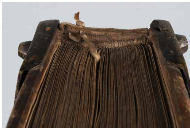
Obr. 8. Detail hlavice s přesahem potahu přes obšívání kapitálkovým vazem a upevněním pohyblivé záložky (sign. XII A 7).

Dalším nepřímým provenienčním znakem roudnických kodexů je nezvyklé množství pevných pergamenových záložek podobné velikosti. Převažují záložky ve tvaru mírně se zužujícího rovnoramenného lichoběžníku, většinou v barvě purpurové, méně jsou zastoupeny modré a nebarvené záložky. Poměrně raritní jsou pevné záložky upravené na vnějším konci do tvaru kulatého uzlu, připomínající turbánek. 63 Mimořádně se v kodexech dochovalo také větší množství pohyblivých záložek s pergamenovými otočnými kolečky v různém provedení. 64 Kolečka s označením sloupců apertury jsou vložena mezi dvě části přehnutého pergamenového proužku, který je upraven odříznutím vnějších rohů do tvaru jazýčku, méně často má uchycení tvar