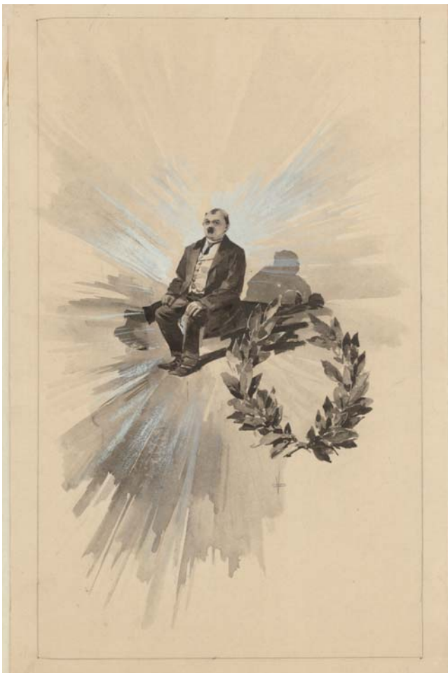
Obr. 2. Ilustrace Viktora Olivy z roku 1889 ke knize Svatopluka Čecha Nový epochální výlet pana Broučka tentokrát do patnáctého století . Vydal František Topič, Praha, 1889. Lavírovaná kresba tuší. KNM, inv. č. ILU 2158.