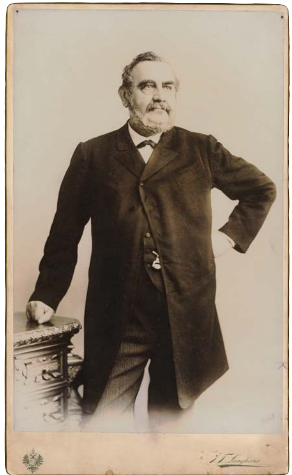
Obr. 4. Politický vůdce národa František Ladislav Rieger.