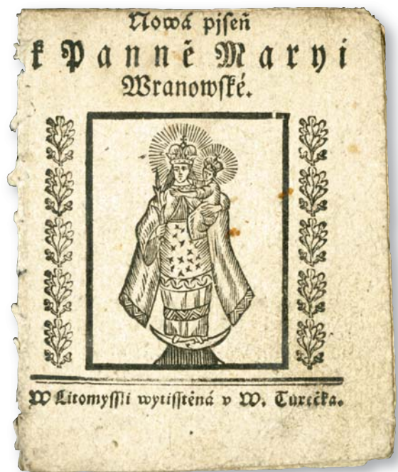
Obr. 3. Titulní strana kramářského tisku Nová píseň k Panně Maryi Branovské . Litomyšl, Václav Tureček, s.a. KNM, inv. č. KP R. Hlava 6581.