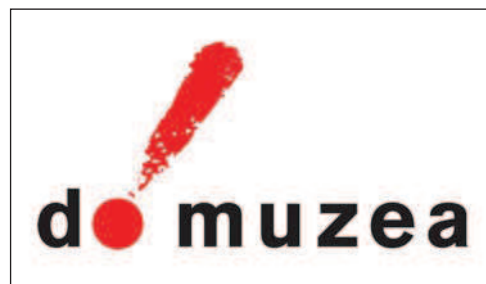
Obr. 1: Logo portálu Do muzea!.

Návštěvník může najít jakékoliv muzeum ve svém regionu i jinde v České republice podle různých kritérií – názvu, zaměření či nejlepšího hodnocení. Po jednoduché registraci mohou návštěvníci portálu hodnotit kvalitu navštívené insti-