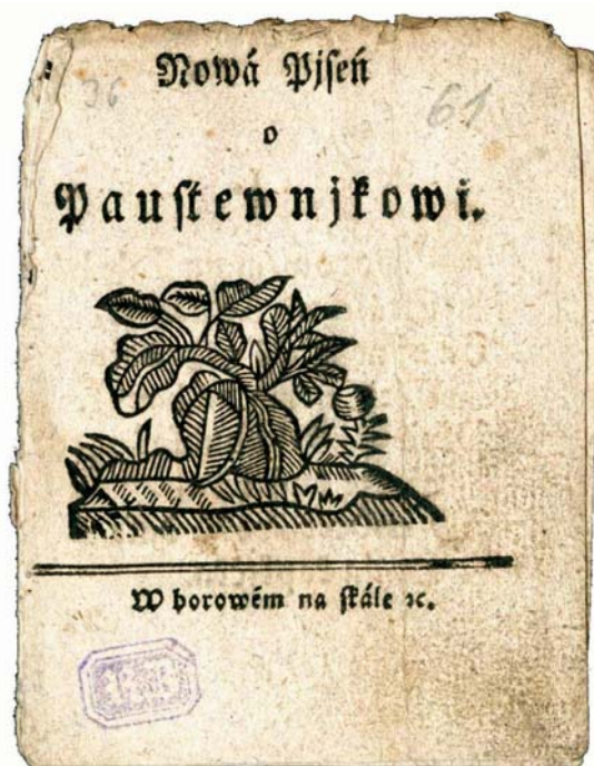
Kramářský tisk „Nowá Piseň o Paustewnjkowi“. S.l., s.n., s.a. KNM, sbírka kramářských písní, inv. č. KP 8684.