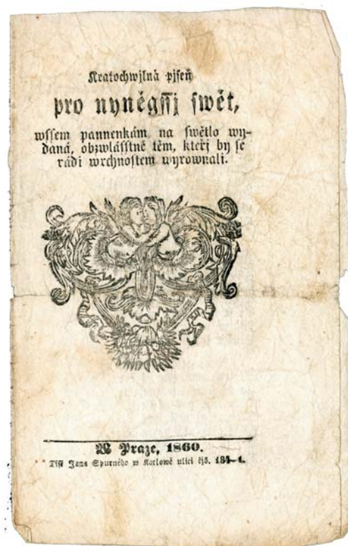
Kramářský tisk „Kratochwilná píseň pro nyněgssj swět, wssem pannenkám na swětlo wydaná, obzwlásstně těm, kterj by se rádi wrchnostem wyrownali (!)“. Praha, Jan Spurný, 1860. KNM, sbírka kramářských písní, inv. č. KP 6880.