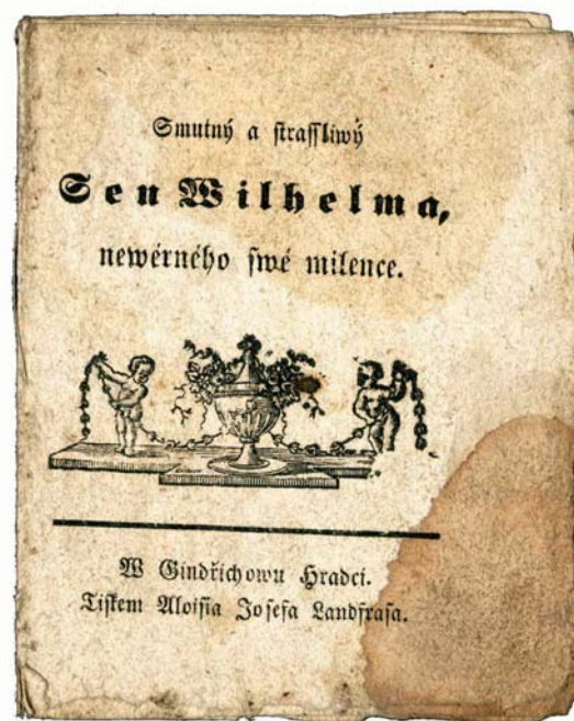
Kramářský tisk „Smutný a strassliwý Sen Wilhelma, newérneho (!) swé milence“. Jindřichův Hradec, Alois Josef Landfrasa, s.a. KNM, sbírka kramářských písní, inv. č. KP 7562.