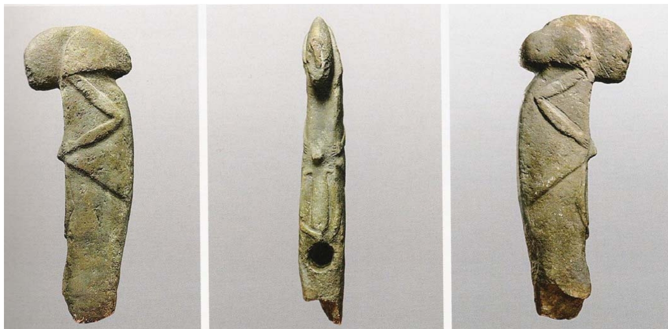
Obr. 6. Socha z lokality Kilisik. Podle Vor 12.000 Jahren in Anatolien, 2007, s. 81.

o reliéf tanečníků s maskami jeřábů, snad šamanů vykonávajících rituál. 18