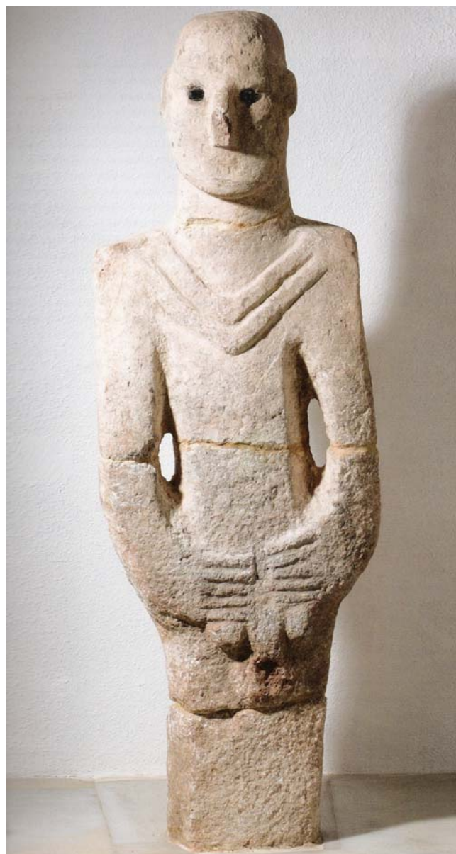
Obr. 5. Socha z Şanlıurfy. Podle Vor 12.000 Jahren in Anatolien, 2007, s. 71.

Tak jako lze považovat za významné rozmístění jednotlivých pilířů, je nutné zohlednit i na nich vypracované reliéfy, zejména vztah daného vyobrazení k příslušné monolitické postavě. Archeolog Klaus Schmidt nicméně vylučuje, že bychom se na Göbekli Tepe setkávali s motivy shodnými s těmi z Ezopových bajek, byť plejáda zvířat na Göbekli Tepe se překvapivě shoduje i se zvířaty, jež jsou protagonisty Ezopových bajek, např. jeřáb, had, liška, osel. 15 U některých výjevů se však nelze ubránit snaze přirovnat je k nám známým mytologickým motivům, např. sochy šelem – psů s vyceněnými zuby – lze připodobnit ke psu Kerberovi z řeckého bájesloví, který hlídal vstup do podsvětí. 16 I další vyobrazení se zdají být vázána na představy o smrti či posmrtném životě. Kamenně vydlážděný přístup do kruhového areálu „C“ považuje hlavní archeolog za jakýsi „dromos“, jehož vstup hlídaly po stranách dvě šelmy, přičemž se dochovala pouze socha jedné z nich. Obdobně by bylo možné interpretovat i vstupní ka-