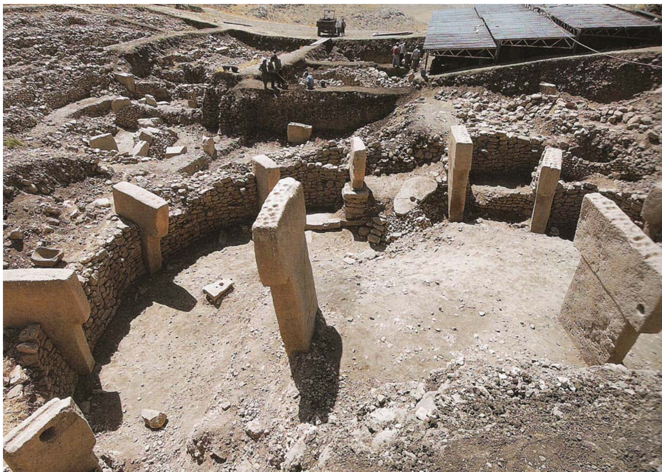
Obr. 1. Pohled do kruhového komplexu D. Podle Vor 12.000 Jahren in Anatolien, 2007, s. 82.

značeny paže, jež se setkávají v podobě propletených prstů na frontální straně monumentů. Tento výklad potvrzují i nalezené sošky stylizovaných postav menších rozměrů, jež však oproti pilířům vykazují vyšší míru antropomorfního zobrazení – realističtější rysy i detaily.