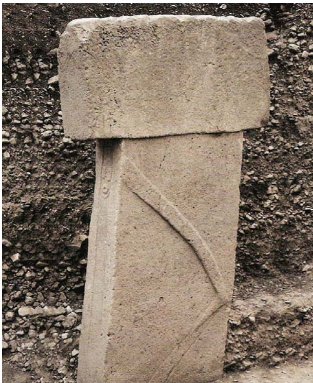
Obr. 4. Pilíř č. 18. Podle Vor 12.000 Jahren in Anatolien, 2007, s. 96.

Tepe, 6 Hamzan Tepe, 7 Harbetsuvan Tepesi, 8 Kurt Tepesi 9 či Taşlı Tepe. 10 Pro tuto interpretaci svědčí jednoznačně i podobně stylizované sošky s hlavou ve tvaru „T“, nalezené např. na Kilisik Höyüku, v Gaziantepu 11 a rovněž Socha z Şanlıurfy. Pilíře mají shodné rysy: hlava ve tvaru „T“, naznačená „štola“ či šperk pod krkem ve tvaru písmene „V“ (ježž nese i Socha ze Şanlıurfy), na boku se viditelně rýsující pokrčené paže, které se setkávají na přední straně sochy, kde je naznačeno deset prstů. „Lze bohužel pouze spekulovat o tom, proč byla hlava těchto kamenných bytostí znázorněna vždy čistě geometricky bez jakýchkoliv dalších náznaků detailů jako očí, nosu či úst.“ 12 Jedinou ozdobou, snad významným symbolem, je naznačený oděv, který však nemají všechny sochy, a Klaus Schmidt dodává: „Rozložení soch se štolou a bez ní může mít jistou důležitost, význam, který však může být vysledován, až bude zcela odkryto více útvarů a pilířů na Göbekli Tepe.“ 13