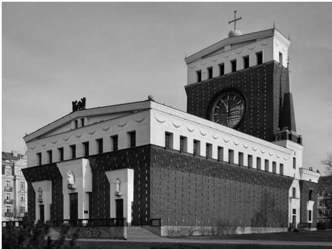
Pohled na kostel Nejsvětějšího Srdce Páně od jihozápadu.