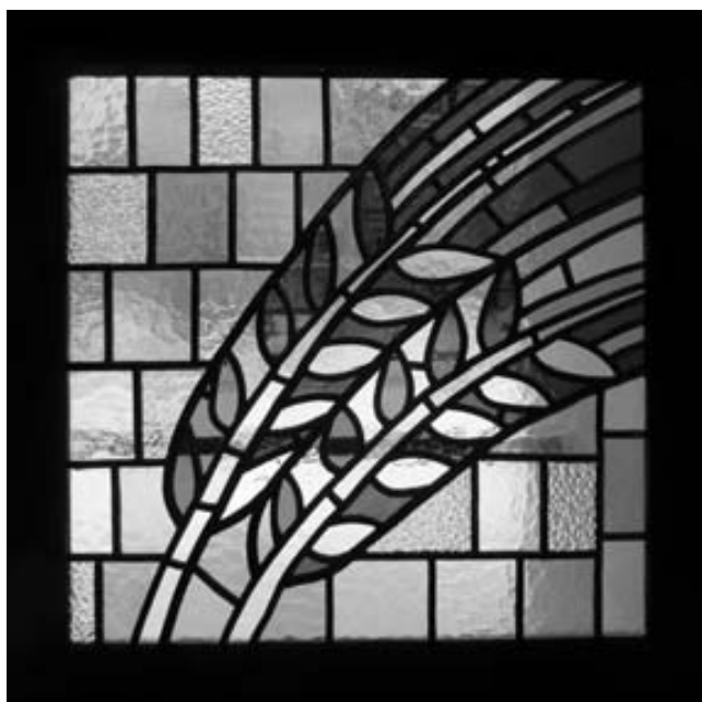
Detail vitraje – klasy, 1944, návrh Karel Svobinský, stav po restaurování.