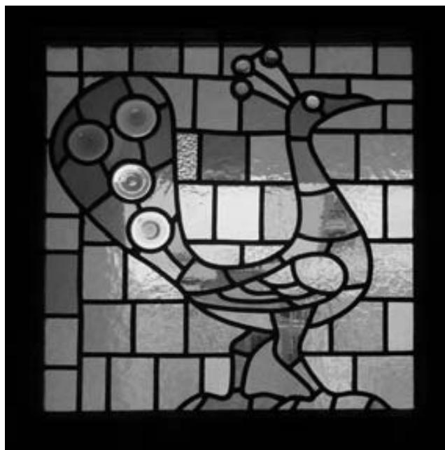
Detail vitraje – Fénix, 1944, návrh Karel Svobinský, stav po restaurování.