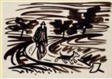
Muž se psem, 1935, kresba sépií (soukromý majetek)