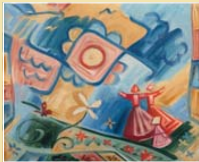
Zpívající děvčata, 1936, olej na plátně (soukromý majetek)

Dne 28. října 1991 propůjčil prezident Václav Havel Josefu Čapkovi Řád T. G. Masaryka I. třídy in memoriam. V roce 2001 pojmenovala Mezinárodní astronomická společnost jménem Josefa Čapka planetku číslo 14976.