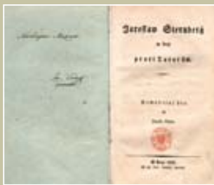
První vydání divadelní hry Jaroslav Šternberg v boji proti Tatarům (1823) s vlastnoručným věnováním Josefa Lindy Národnímu muzeu.

Po ukončení studia práv žádal Linda neúspěšně o místo gymnaziálního profesora v Praze. Namísto učitelského působení se plně zaměřil na literaturu a žurnalistiku. Již v době studií se vedle staršího českého písemnictví seznamoval také s díly francouzskými, anglickými a ruskými, byl ovlivněn i antickou literaturou. Proslavil se především jako autor první novočeské historické prózy Záře nad pohanstvem nebo Václav a Boleslav – Vyobrazení z dávnověkosti vlastenské , vydané v roce 1818. Českou literární tvorbu první poloviny 19. století Linda obohatil také jako dramatik, a to divadelní hrou Jaroslav Šternberg v boji proti Tatarům , z roku 1823.