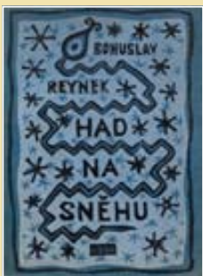
Had na sněhu, obálka ke knize Bohuslava Reyneka, 1924

Když dospíval, počítalo se, že převezme dědečkův hronovský mlýn a přebuduje ho na malou textilku. Proto ho rodiče poslali na tkalcovskou školu do Vrchlabí a pak na praxi do tkalcovny v Úpici. On však nechtěl být továrníkem, ale malířem, a tak si prosadil studium na pražské uměleckoprůmyslové škole, které spojovalo přípravu na obě povolání. K podnikatelské dráze se však už nevrátil.