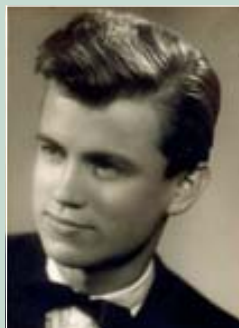
Maturitní fotografie z roku 1957

Třešňové květy v zahradě žlutnou Pro nás jak pro ně Čas je tou loutnou na kterou hraje Smrt za svítání Dokud jsi krásná vzbuď se Má paní Dostatek spánku čeká nás v hrobě Vzbuď se má láska a vezmi mě k sobě