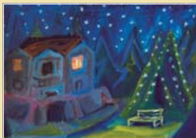
Scénický návrh ke hře Karla Čapka Loupežník , 1925 (Národní muzeum)

Zřizovatelé: Národní muzeum – Matice česká, sekce Společnosti Národního muzea, ve spolupráci s městem Hronov – červen 2012