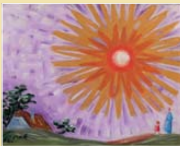
Třetí procházka, 1935, olej na plátně (soukromý majetek)

Ještě za studii začal společně s mladším bratrem Karlem časopisecky publikovat kritiky a drobné prózy. Knižku svých literárních prvotin nazvali bratři Čapkové Krakonošova zahrada . Její texty jsou „bujné, naivní, mladé, teskné a divé“, jako léta dospívání, která Čapci společně prožili.