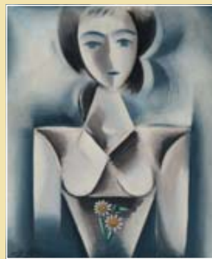
Děvče, 1914, olej na plátně (soukromý majetek)

Zřizovatelé: Společnost bratří Čapků ve spolupráci s Maticí českou, sekci Společnosti Národního muzea, a Městským úřadem v Žacléři - červen 2012 Typografie, tisk: FAST reklamní studio s. r. o., Praha 10 Kontakt: Společnost bratří Čapků, Městská knihovna v Praze, Mariánské náměstí 1, Praha 1, 115 72, www.bratři-capkove.cz.