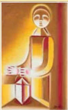
Chlapec ze svítilnou, 1917, olej na plátně (soukromý majetek)

V roce 1918 patřil Josef Čapek k zakládajícím členům skupiny Tvrdšíjní, reprezentující v poválečných letech mladé československé umění. Dvacátá léta znamenala pro něj úspěšné a čínorodé období, v roce 1924 měl první samostatnou výstavu. Od roku 1921 pracoval jako redaktor, výtvarný referent a karikaturista Lidových novin, prosadil se také jako úspěšný autor ilustrací a knižních obálek, věnoval se scénografii pro naše přední divadla, psal knihy pro děti a filmová libreta.