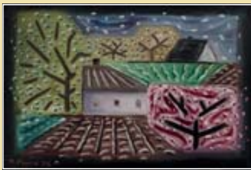
Jaro, 1929, olej na plátně (soukromý majetek)

V roce 1918 patřil Josef Čapek k zakládajícím členům skupiny Tvrdšíjní, reprezentující v poválečných letech mladé československé umění. Dvacátá léta znamenala pro něj úspěšné a čínorodé období, v roce 1924 měl první samostatnou výstavu. Od roku 1921 pracoval jako redaktor, výtvarný referent a katurista Lidových novin, prosadil se také jako úspěšný autor ilustrací a knižních obálek, věnoval se scénografii pro naše přední divadla, psal knihy pro děti a filmová libreta.