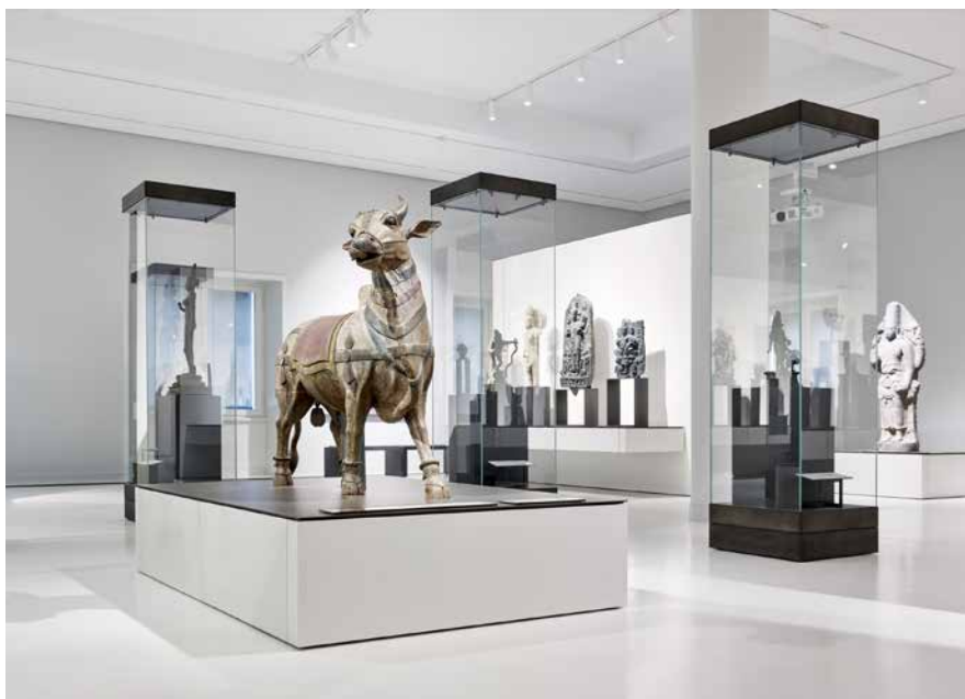
Procesní býk Nandi – býk boha Sivy, (19.-20. století) v modulu „Hinduistické umění v Jižní Asii“ v Muzeu asijského umění.

nám tak jasnou pozici, z níž se na ni máme dívat. Její obsah působí, jako by se snažila být spíše muzeem kolonialismu, což by byl bezpochyby zajímavý koncept. Domníváme se, že právě muzea kolonialismu, která by ukazovala vzájemné vztahy obou historických aktérů – tedy kolonizátorů a kolonizovaných, jsou něčím, co by klasická etnologická muzea mohlo ve 21. století dobře nahradit. Taková muzea by nicméně musela vystavovat nejen předměty kolonizovaných kultur, ale také předměty kolonizátorů, které by se vztahovaly například ke koloniální správě a útlaku, ale také obecně ke každodennímu životu v koloniích, a to z perspektivy různých společenských skupin, od nichž by si zároveň zachovávala dostatečný odstup. Čekali jsme, že právě touto cestou se rozhodli vydat i kurátoři a kurátorky berlínské expozice. Bohužel v dalších místnostech perspektiva kolonizátorů téměř splývá s perspektivou návštěvníků muzea.