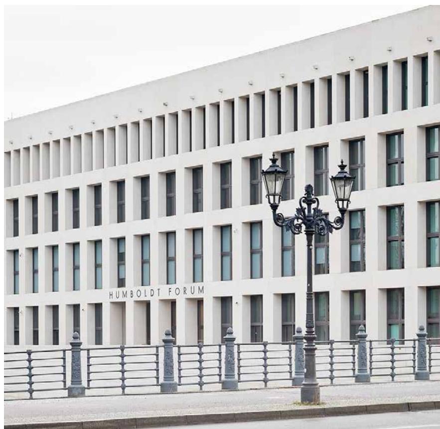
Východní strana Humboldt Fóra.

v několika místnostech obdivovat například různě staré sochy buddhů, indické bohy, čínský porcelán nebo mughalské kachličky. Reprezentace Orientu zde v podstatě ničím nevybočují z klasických klíšé, na které poukazoval například už Edward Said. Speciální postavení má v rámci expozice zejména Japonsko, částečně i Korea – muzejní texty pojednávají i o jejich současnosti a cestě k moderní společnosti. Ačkoliv jsou tak v muzeu stále reprezentovány jako kultury něčím exotické, je jim přiznáno pomyslné místo mezi „civilizovanými“ národy, které Západ uznává jako schopné modernizace. Ostatní asijské země jsou zde prezentovány jako místa, kde se historie zastavila již před stovkami let a kde se způsob života ani kulturní prvky nijak nemění. Druhé i třetí patro Fora je tak ve výsledku pouze přehlídkou exotických uměleckých předmětů, které evropští cestovatelé, obchodníci, misionáři a kolonizátoři navozili do Evropy za staletí imperiálních ambicí o podmanění celého světa.