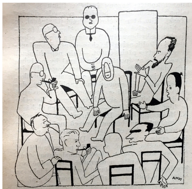
Obr. 5. Hoffmeister, Adolf. Pátečníci s panem Smithem , 1927. Rozpravy Aventina 3, 1927/1928, č. 8, s. 99.

Obrázek můžeme pojmenovat Pátečníci s panem Smithem . Vedle této imaginární postavy spočívající na židli v centru kruhu zobrazuje po jeho obvodu 9 na židlích sedících osob. Jedna z figur sedící zády je charakterizová-