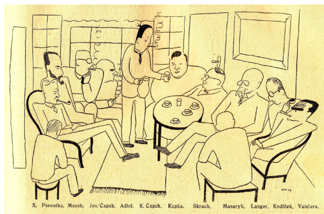
Obr. 2. Hoffmeister, Adolf. Pátečníci u bratří Čapků, 1927. Přítomnost, 1927, 24. února, č. 7, s. 109.