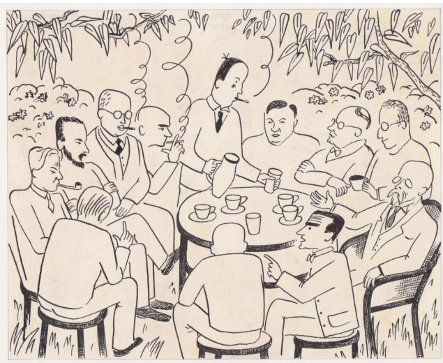
Obr. 3. Ježková, Dagmar. Pátečníci , 2004. Autorka. Sken: táž.

sémiotického znaku. Byla mnohokrát reprodukována a zařadila se mezi autorova nejznámější výtvarná díla.