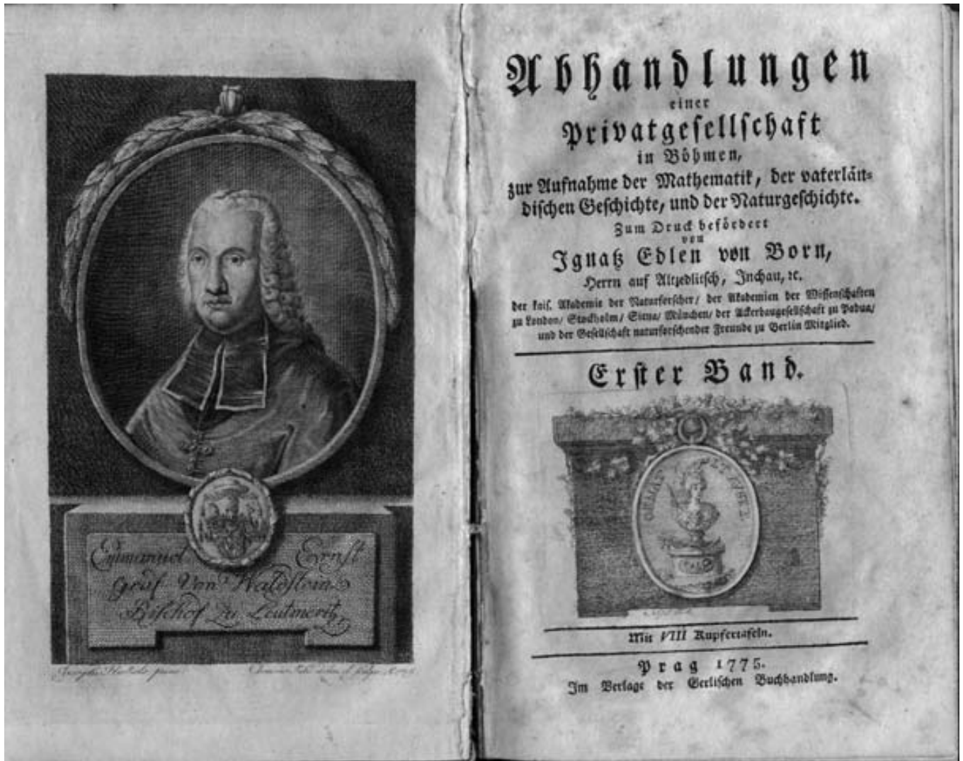
Abhandlungen einer Privatgesellschaft in Böhmen zur Aufnahme der Mathematik, der vaterländischen Geschichte, und Naturgeschichte. Zum Druck befördert von Ignaz Edlen von Born..., Erster Band, Prag 1775

Die Familie Czernin bewohnte das Schloss bis 1917, im Jahre 1925 wurden Gut und Schloss vom Bankier Jindřich Bělohřibek gekauft.