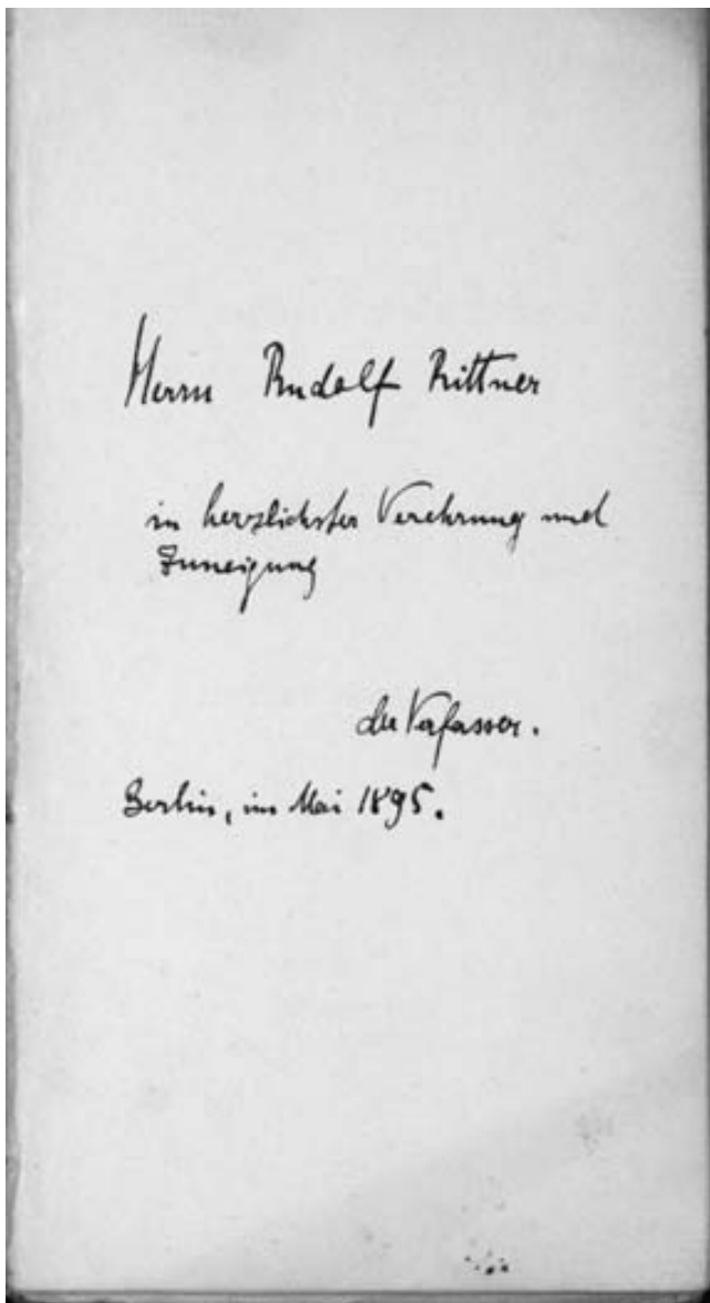
Věnování z knihy In Phanta's Schloss . Berlin 1895