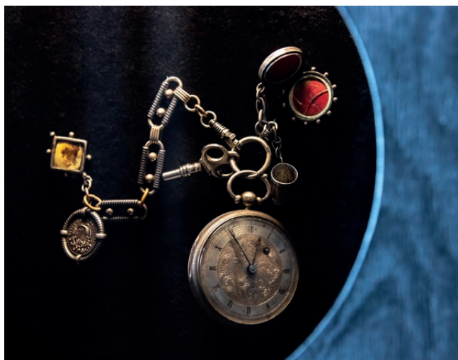
Watch owned by Leoš Janáček / Hodinky z majetku Leoše Janáčka Unknown maker, ca. 1750, silver, base metal / Autor neznámý, kolem roku 1750, stříbro, obecný kov Moravian Museum, inv. no. 109.004 (shelf mark TLJ 183) / Moravské zemské muzeum, inv. č. 109.004 (sign. TLJ 183)

Celá výstava pojímá široký záběr historický a nemůže ukázat vše, co se skrývá ve sbírkových a dokumentačních fondech Národního muzea a spolupracujících institucí. Protože však originální předměty vždy umocňují zážitek z výstavy, i tuto zejména zvukově koncipovanou výstavu doprovází celkem dvacet sbírkových předmětů tří okruhů. Jednak jsou to zmíněné originální partitury, z nichž Vltava a „ Novosvětská “ pocházejí ze sbírek Národního muzea (Muzea Bedřicha Smetany a Muzea Antonína