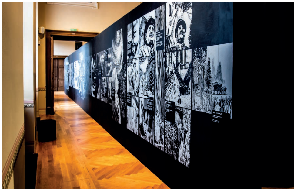
View of the exhibition Famous Czech Composers / Pohled do výstavy Slavní čeští skladatelé

Koncept výstavy je doplněn o další hudební a zvukové vjemy, umístěné v prostoru hlavní výstavní konstrukce, na jejímž plášti si návštěvník může prohlížet obrazové novely. Inspiracemi jsou v širším slova smyslu chápána prostředí a témata, která rezonovala společností