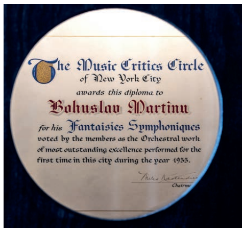
Diploma for Bohuslav Martinů from the New York Critics Circle / Diplom Newyorského klubu hudebních kritiků pro Bohuslava Martinů Latter half of the 20 th century / 2. polovina 20. století Polička Town Museum and Gallery, Bohuslav Martinů Centre, inv. no. PBM RD 117 / Městské muzeum a galerie Polička, Centrum Bohuslava Martinů, inv. č. PBM RD 117 © NM

As a whole, the exhibition covers a broad swath of history, and it cannot show everything that is hidden in the collections and archives of the National Museum and cooperating institutions. However, because original objects always enhance an exhibition experience, even this mostly sonically conceived exhibition is accompanied by a total of 20 objects from collections in three categories. Firstly, there are the original scores mentioned above, of which The Moldau and the “ New World Symphony ” come from the collections of the National Museum (the Bedřich Smetana Museum and the Antonín Dvořák Museum), the Sinfonietta from the collections of the Moravian Museum (Music History Department), and the Double Concerto from the collection of the Paul Sacher Stiftung in Basel. A second category consists of personal objects of the composers