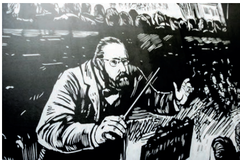
Detail of the graphic novel by Alexey Klyuykov / Detail z obrazové novely od Alexeye Klyuykova

A second striking resource of the exhibition is the visual arts component, which is concentrated into a large-format "graphic novel". The stories, drawn by hand in black-and-white (2.8 × 21 m) and presenting the fate of each of the composers in artistic renderings by Alexey Klyuykov, are based on period photographs and graphics. In this untraditional, visitor-friendly way, the team of authors presents key moments in the composers' lives in the setting of their environment and period. They are accompanied by texts or statements made by specific persons, whether the composers themselves or persons close to them. The novel focuses not only on the composers' biographies, but also on the psychology of the experiences that accompanied them through the sometimes dramatic and tragic stages of their lives as well as their times of joy and contentment.