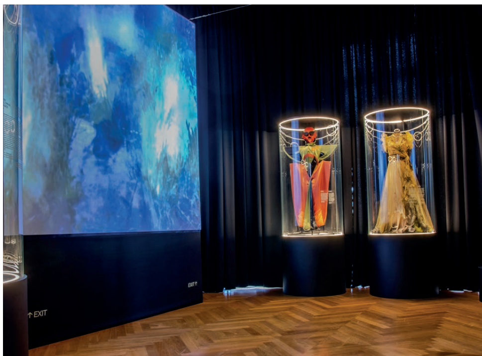
View of the exhibition Famous Czech Composers / Pohled do výstavy Slavní čeští skladatelé

Dvořáka), Sinfonietta ze sbírek Moravského zemského muzea (Oddělení dějiny hudby) a Dvojkonzert ze sbírky Paul Sacher Stiftung v Basileji. Druhý okruh tvoří osobní předměty skladatelů s vazbou na vybranou událost nebo etapu jejich životů. Návštěvník si tak může prohlédnout např. Smetanovo naslouchadlo, které používal během postupné ztráty sluchu, Dvořákovy manžety, na které si často zaznamenával hudební motivy, Janáčkovy hodinky s medailonkem a vlasy jeho zesnulé dcery Olgy nebo dětské botičky B. Martinů, které mu vyrobil jeho otec. Posledním okruhem předmětů jsou kostýmy z významných oper skladatelů, umístěné v místnosti s promítáním operních úryvků, z nichž je naprostým unikátem kostým Vaška z premiéry Smetanovy Prodané nevěsty v Prozatímním divadle v roce 1866, který je sbírkovým předmětem Muzea Bedřicha Smetany. Po zhlédnutí celé výstavy se vrací návštěvník s načerpanými dojmy zpět do světelné místnosti.