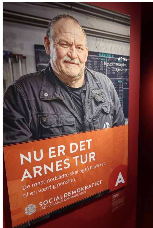
Obř. 5. V expozici najdeme i dokumentaci volebních plakátů dánské sociálně demokratické strany (Socialdemokratiet) poukazující, na jaké voliče (a odvozeno i potenciální návštěvníky muzea) se strana zaměřuje.

zeum dělnictva. 23 Podobně jako v případě Domu Karla Marxe, i jeho sídlo nese genia loci, neboť se jedná o první instituci, kterou nechali pro svá setkávání koncem osmdesátých let 19. století postavit tvořící se dánské odbory. Tento měšťanský dům s činžovnými byty ve vnitrobloku čtvrti centra Kodaně sloužil odborovému hnutí až do konce sedmdesátých let 20. století. V souladu s plánem odborů a s podporou dánského státu následně mohl nastoupit svoji cestu k jednomu z nejvýznamnějších skandinávských muzejních center vysvětlujících dělnický základ soudobého úspěšného politického uspořádaní sociálního státu – welfare state. Totiž svá muzea dělnictva či práce mají i všechny další skandinávské země, 24 ač dánské vykazuje dlouhodobě nejvyšší aktivitu a mezinárodní ohlas. Muzeum patřilo k zakládajícím institucím sítě WorkLab a v uplynulých dvaceti letech z něj vzešlo i několik předsedů této mezinárodní asociace. Na jeho půdě se konalo