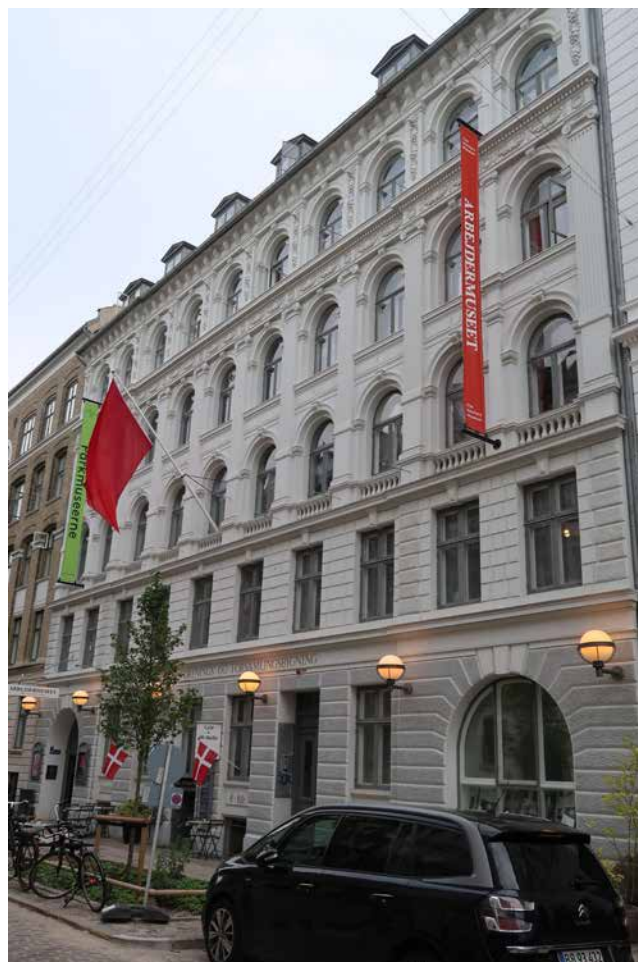
Obr. 3. Exteriér budovy Arbeidermuseet/Workers Museum Copenhagen.

Expozice byla otevřena u příležitosti oslav dvou set let Marxova narození, kdy se Trevír stal centrem vzpomínkových akcí a vedle zmíněné expozice byla ve městě instalována jako dar Čínské lidové republiky kontroverzně přijatá Marxova socha. 21 Oslavou Marxova bytí nicméně expozice rozhodně není. Všimá si vedle zakotvení samotného příběhu Marxovy rodiny i kontroverzí, které přijímání jeho prací způsobilo, a interpretuje filosofa na vícero úrovních. Faktem však zůstává, že ji celou provází dílo jedné osobnosti, jak se k němu hlásí a jak jej kritizuje současná politika (Marxův dům spravuje nadace spjatá s německou sociální demokracií, dnes nejsilnější vládnoucí německou politickou stranou). Ve směru reflexe jedné osobnosti v kontextu práce a vývoje dělnictva je v síti WorkLab Karl Marx Haus ojedinelý. Ještě v roce 2010 bylo součástí sítě také helsinské Muzeum V. I. Lenina, jinou přímo politické osobnosti věnovanou instituci v ní ovšem nenajdeme. Trochu paradoxně je tak připomínkou spojení s fenoménem komunistických