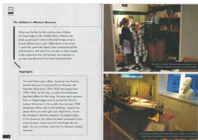
Obr. 6. V rámci propagačních letáků dánské muzeum práce zviditelňuje jak své dětské muzeum, tak rekonstrukci pracovny Thorvalda Stauninga.

Jako místo paměti na sociální a dělnické hnutí v Dánsku se síň stala jedním z hlavních znaků zdůrazňujících genia loci budovy i připomínkou hmotných snah o uznání dělnických aktivit jako světového kulturního dědictví. 27