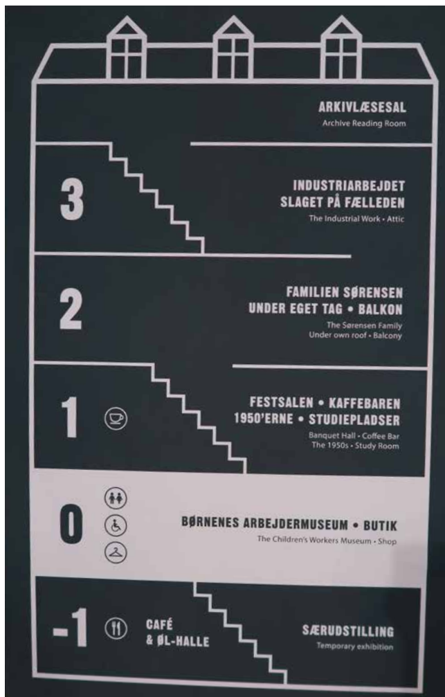
Obř. 4. Plánek budovy Arbejdermuseet/Workers Museum Copenhagen z roku 2021.

zeum dělnictva. 23 Podobně jako v případě Domu Karla Marxe, i jeho sídlo nese genia loci, neboť se jedná o první instituci, kterou nechali pro svá setkávání koncem osmdesátých let 19. století postavit tvořící se dánské odbory. Tento měšťanský dům s činžovnými byty ve vnitrobloku čtvrti centra Kodaně sloužil odborovému hnutí až do konce sedmdesátých let 20. století. V souladu s plánem odborů a s podporou dánského státu následně mohl nastoupit svoji cestu k jednomu z nejvýznamnějších skandinávských muzejních center vysvětlujících dělnický základ soudobého úspěšného politického uspořádaní sociálního státu – welfare state. Totiž svá muzea dělnictva či práce mají i všechny další skandinávské země, 24 ač dánské vykazuje dlouhodobě nejvyšší aktivitu a mezinárodní ohlas. Muzeum patřilo k zakládajícím institucím sítě WorkLab a v uplynulých dvaceti letech z něj vzešlo i několik předsedů této mezinárodní asociace. Na jeho půdě se konalo