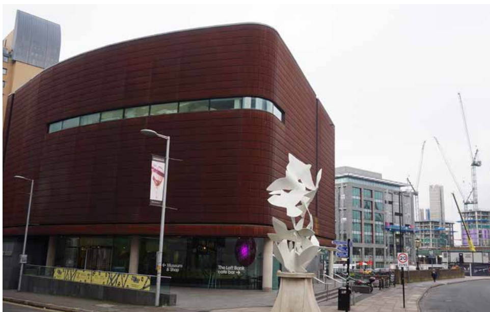
Obr. 7. Exteriér současného sídla People's History Museum.