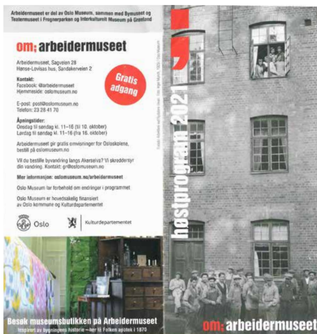
Obr. 2. Leták propagující expozici norského muzea dělnictva v Oslu z roku 2021.

Vrchní patro trevírské instituce je věnováno reflexi Marxem vypracované ideologie po roce 1939, kdy jsou jeho ideje globalizovány v režimech spojených s vývozem sovětského a čínského politického systému, jakož i reflektovány západními intelektuály. Nejnovější světové události opírající se v základech o marxistický výklad jsou představeny pomocí množství obrazovek, aby tak případně mohly být jednoduše doplněny aktuálními událostmi. Důraz je zde kladen na ideje ožívající po hospodářské krizi 2007/8, kdy i podle tvůrců expozice Marxovo dílo zaznamenalo ve světě svoji renesanci. 20