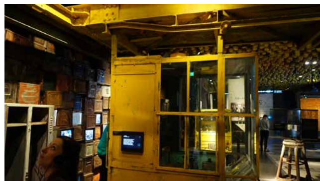
Obr. 14. Pohled do interiéru expozice Europejskie centrum Solidarności. Jde o vstupní místnost, kde jsou imitovány gdaňské loděnice jako svět pro sebe, kde se zrodilo Hnutí Solidarita. Stav v roce 2018.

Té by instituce reflektující více než historii dělnictva a práce jako komunismem zneužitý fenomén prospěla. V kontextu podpory participace vrstev na rozhodování ve společnosti by takové muzeum posunulo už trochu rezačejší narativ, který končí stávkovým hnutím roku 1989 jako finálním stupněm demokratického vývoje. V tomto smyslu všechny tři výše představené instituce demokratický vrchol v roce 1989 přesahují. O tom, že revolucemi roku 1989 „neskončily dějiny“, jsme se měli za posledních 33 let přesvěd-