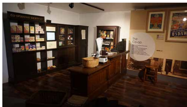
Obř. 12. Instalace družstevní prodejny COOP jako prezentace společného vlastnictví lidí pro lidi v expozici People's History Museum v Manchesteru v roce 2019.

Ve svojí stálé expozici z roku 2010 nicméně zůstává relativně blízké právě historickému dělnickému etosu a revolučnímu hnutí mas. Ve dvou patrech svého sídla vypráví historický příběh rozvoje demokratizačních prvků britské společnosti od jejich proměn konce osvícenství a nástupu průmyslové revoluce. V prvním patře vyzdvihuje několik základních prvků vývoje, kolem kterých staví sociální a demokratický pokrok. Vyprávění začíná ve světovém kontextu francouzské revoluce konce 18. století, aby se v další části věnovalo hlavně britským dějinám, které proměňovaly v protikladu s kontinentálním děním a jeho výbuchy povstání spíše postupné historické procesy a reformy. Jako proces