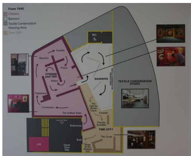
Obř. 10 a 11. Obsahové rozdělení dvou pater stálé expozice People's History Museum v Manchesteru.

vstoupilo muzeum do řešení problémů migrace, práv menšin a spolupráce na širších projektech Evropské unie. Hlasitě bylo muzeum slyšet svojí výstavní a sbírkotvornou iniciativou i během kampaně k referendu o setrvání Velké Británie v EU roku 2016. Tu následně nahradilo výše zmíněným programem soudobé dokumentace radikální demokracie, který v posledních letech rozšířily hlavně dokumentace protestů hnutí Black Lives Matter (2020) nebo ekologického hnutí za klima.