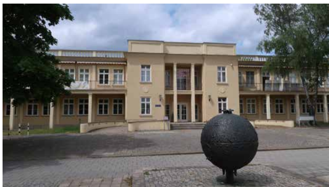
Obr. 13. Exteriér Museum Alltag und Utopie, které se nachází ve městě Eisenhüttenstadt. Město vzniklo pod názvem Stalinograd v 50. letech 20. století jako centrum hutního průmyslu a dnes je vzorovým příkladem architektury sorely. Muzeum bylo založeno v roce 1993 s cílem sběru a prezentace každodennosti DDR.

ství, která jsou popsána jako neustále doplňovaná a aktualizovaná. Historie tak slouží jako prostředek nejen poznání minulosti, nýbrž i její konfrontace s aktuální situací a rozhodnutí, jak s touto zkušeností naložit. Instituce tak funguje jako jeden soudobý celek tří časových pásem (minulosti, současnosti a budoucnosti).