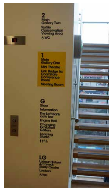
Obr. 8. Schéma veřejných prostranství muzejní budovy People's History Museum v Manchesteru.

vé stranické politiky, dělnictva a práce. Ovšem v současné době ji v akviziční i prezentační činnosti překračuje, když už v roce 2017 vyhlásila svůj nový sbírkotvorný program, založený na dokumentování témat a příběhů LGBT+, soudobých kampaní za lidská práva, moderních protestů, migrace a boje za práva postižených lidí. 31