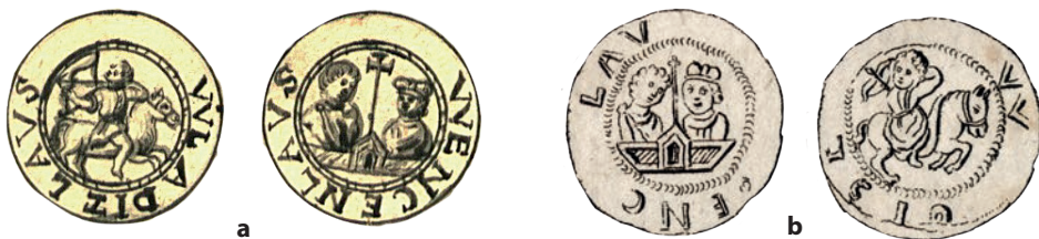
●□1: Vyobrazení denáru Cach 562:

Denár Vladislava I. typu Cach 562 byl poprvé vyobrazen a popsán zakladatelem české numismatiky Mikulášem Adauktem Voigtem v jeho souborném díle o českém mincovnictví, vydaném v roce 1771. 5 Spolu s dalšími, v díle popsány mincemi byl součástí velké numismatické sbírky litoměřického biskupa Emanuela Arnošta z Valdštejna (1760–1789). 6 Okolnosti nálezů či získání denáru do sbírek nejsou známy (obr. 1a–b).