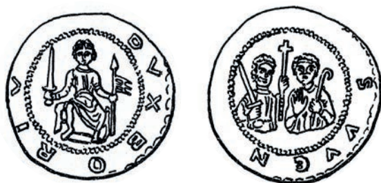
●◻8: Denár Bořivoje II. Cach 420 z let 1118–1120.