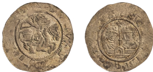
●□3: Denár Cach 562 z nálezů Neustupov 1914. Západočeské muzeum v Plzni, inv. č. J 144. Zvětšeno 2:1.

vydaném jen o několik let později, hovoří navíc o zastoupení ražeb obou panovníků, z nichž lze Vladislavu I. z nálezového celku přiřadit pouze a právě denáry Cach 562. 25