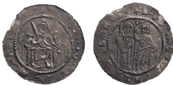
●□9: Denár Vladislava I. Cach 547 z let 1120–1125.

Rubní strany denárů Vladislava I. Cach 562 s postavami světců zakomponovanými do architektonického rámce symbolizujícího Civitas Dei – Nebeský Jeruzalém se staly předlohou pro ikonografické pojetí rubních stran denárů Soběslava I. (1125–1140) Cach 575 (obr. 10). Se stejným či podobným pojetím se pak setkáváme rovněž na rubních stranách denárů Vladislava II. (1140–1174) a to jak z období jeho knížecí vlády 1140–1158: Cach 597 (obr. 11), 38 tak i z období po jeho královské korunovaci v roce 1158: Cach 608 (obr. 12) a Cach 609 (obr. 13). Vyobrazení obou českých patronů v rámci abstrahovaně ztvárněné Civitas Dei mizí na českých denárech v době královské vlády Vladislava II. a se společným vyobrazením obou světců se naposledy setkáváme na rubních stranách denárů Soběslava II. (1173–1179) Cach 620 (obr. 14).