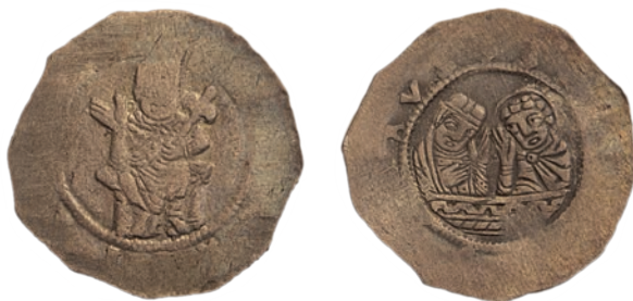
●□ 13: Denár Vladislava II. Cach 609 z let 1158–1174.