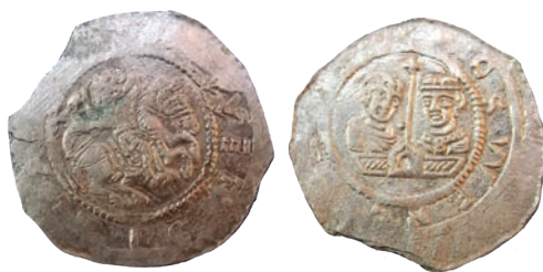
●□4: Denár Cach 562 z nálezů Libotov 1941.

Kromě Neustupova byly denáry Cach 562 prokazatelně zastoupeny pouze v nálezů z okolí Libotova (okr. Trutnov), odkrytém v roce 1941. 26 Z nálezového souboru přibližně šesti set denárů se podařilo blíže popsat pouze 21 exemplářů. 27 Vedle tří exemplářů denárů uvedeného typu Cach 562 (obr. 4) 28 byly v nálezů zastoupeny denáry Soběslava I. (1125–1140) Cach 577, 578, 582 a denáry Vladislava II. z období knížecí vlády Cach 593, 598 a z období po královské korunovaci v roce 1158 Cach 608, 611 a 615. Nález z Bzové, byť jednotypový, nám tak rozšiřuje nevelký počet nálezových celků obsahujících denáry Cach 562. Početné zastoupení jednotlivých variant nám zároveň přináší nové průhledy do mincovní produkce českého knížete Vladislava I.