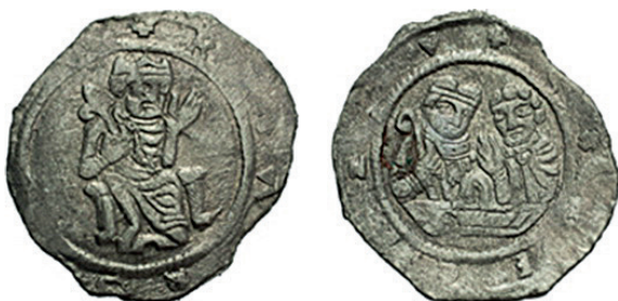
●□ 12: Denár Vladislava II. Cach 608 z let 1158–1174.