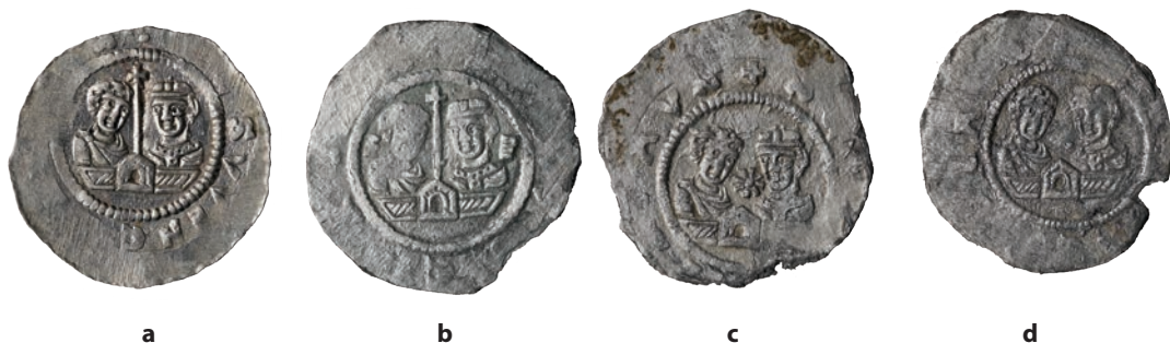
●□ 6: Rubní strany denárů Cach 562 z nálezu Bzová 2020:

a) varianta I (kat. č. 5); b) varianta II (kat. č. 23); c) varianta III (kat. č. 27); d) varianta IV (kat. č. 32).