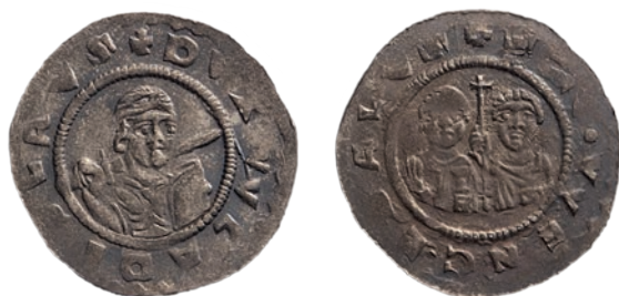
●◻7: Denár Vladislava I. Cach 544 z let 1109–1118.

jméno sv. Václava ve tvaru: SCS VVENCEZLAVS . Rozvinutá opisová legenda uvádějící jména obou světců + • S • VVENCEZLAVS • E ADALBERTVS se objevuje až na rubních stranách denárů Vladislava I. Cach 547 z období jeho druhé vlády 1120–1125 (obr. 9). Vedle sebe stojící postavy se svatozářemi vyjadřují již svým oděním propojenost světské a duchovní moci. Sv. Václav v kroužkové zbroji a plášti se levicí opírá o štít a v pravici drží kopí, sv. Vojtěch oděný albou, bohatě zdobenou tunikou a kasulí drží v levé ruce knihu a v pravé biskupskou berlu. 37