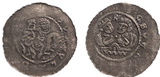
●□ 11: Denár Vladislava II. Cach 597 z let 1140–1158.