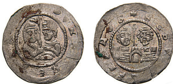
●□10: Denár Soběslava I. Cach 575 z let 1125–1140.

Rubní strany denárů Vladislava I. Cach 562 s postavami světců zakomponovanými do architektonického rámce symbolizujícího Civitas Dei – Nebeský Jeruzalém se staly předlohou pro ikonografické pojetí rubních stran denárů Soběslava I. (1125–1140) Cach 575 (obr. 10). Se stejným či podobným pojetím se pak setkáváme rovněž na rubních stranách denárů Vladislava II. (1140–1174) a to jak z období jeho knížecí vlády 1140–1158: Cach 597 (obr. 11), 38 tak i z období po jeho královské korunovaci v roce 1158: Cach 608 (obr. 12) a Cach 609 (obr. 13). Vyobrazení obou českých patronů v rámci abstrahovaně ztvárněné Civitas Dei mizí na českých denárech v době královské vlády Vladislava II. a se společným vyobrazením obou světců se naposledy setkáváme na rubních stranách denárů Soběslava II. (1173–1179) Cach 620 (obr. 14).