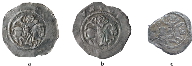
● 5: Lící strany denárů Cach 562 z nálezu Bzová 2020: a) varianta I (kat. č. 8); b) varianta II (kat. č. 23); c) varianta III (kat. č. 29).

Na rubních stranách denárů Cach 562 jsou vyobrazeny polopostavy sv. Václava a sv. Vojtěcha natočené k sobě. Sv. Václav je prostovlasý, oděný do splývavého roucha, sepnutého na pravém rameni, sv. Vojtěch s biskupskou mitrou staré formy je oděný do kněžského roucha s palliem. Postavy světců jsou umístěny na náznaku hradby s bránou, symbolizující nejpravděpodobněji Civitas Dei – Nebeský Jeruzalém. 33 V nálezu Bzová 2020 jsou zastoupeny čtyři ikonograficky odlišné varianty rubních stran mincí. Na denárech varianty I (Cach 562; Šmerda 210a) je mezi světci vyobrazen procesní kříž na dlouhé žerdi (obr. 6a), na denárech varianty II (Cach 562a; Šmerda 210c) jsou po stranách hlav světců umístěna písmena či grafémy E – Y (obr. 6b), na denárech varianty III (Cach 562b; Šmerda 210b) je mezi světci vyobrazen květ, nebo hvězda (obr. 6c) a na dosud nezaznamenané variantě IV je prostor mezi postavami světců prázdný (obr. 6d). Opisové legendy na rubních stranách denárů z nálezu Bzová 2020 se liší rozdělovacími znaménky. U varianty I (Cach 562; Šmerda 210a) lze rekonstruovat opisovou legendu: SCS VVENCEZLAVS • , u varianty III (Cach 562b; Šmerda 210b): + SCS VVENCEZLAVS . U zbývajících dvou variant nelze s jistotou říci, jaká rozdělovací znaménka byla v opisových legendách rubních stran použita.