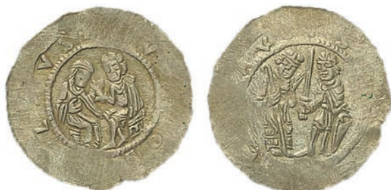
●□ 14: Denár Soběslava II. Cach 620.