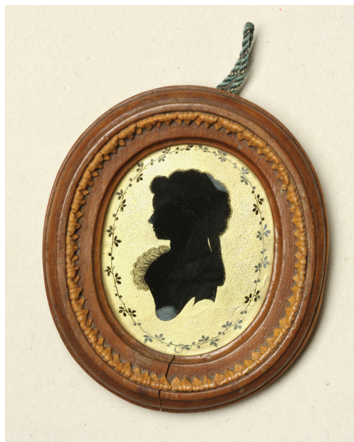
Obrázek 6 – Silueta dámy, konec 18. století , verre églomisé, 7,7 x 6,8 cm včetně rámečku, Národní muzeum, inv. č. H2-3.947.

cadlovým efektem. 27 Jako u předchozích technik je však vždy zachována černá monochromnost tváře. Patrně vzhledem k náročnosti je jen výjimečně součástí eglomizované siluety také proškrábaný přípis, či jméno portretovaného, které musely být vyškrábány zrcadlově obráceně (například silueta muže označeného nápisem jako „Feldmarschall Fuerstenberg“, prav-