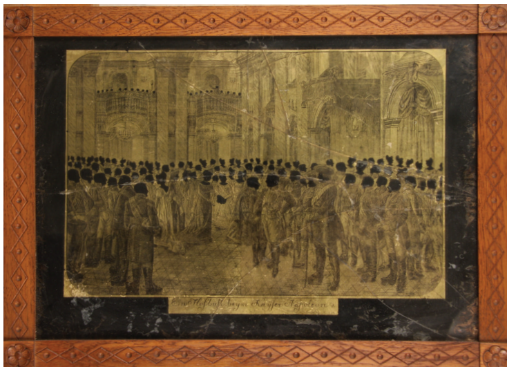
Obrázek 5 – Fiedler, Ein Hofball bey'm Kayser Napoleon 1809 , po roce 1809, verre églomisé, 32,7 x 43 cm (včetně rámu), Národní muzeum, inv. č. H2-63.901.

děpodobně pražského rodáka a císařského polního podmaršálka Karla Aloise knížete Fürstenberga /1760-1799/, H2-31.726).