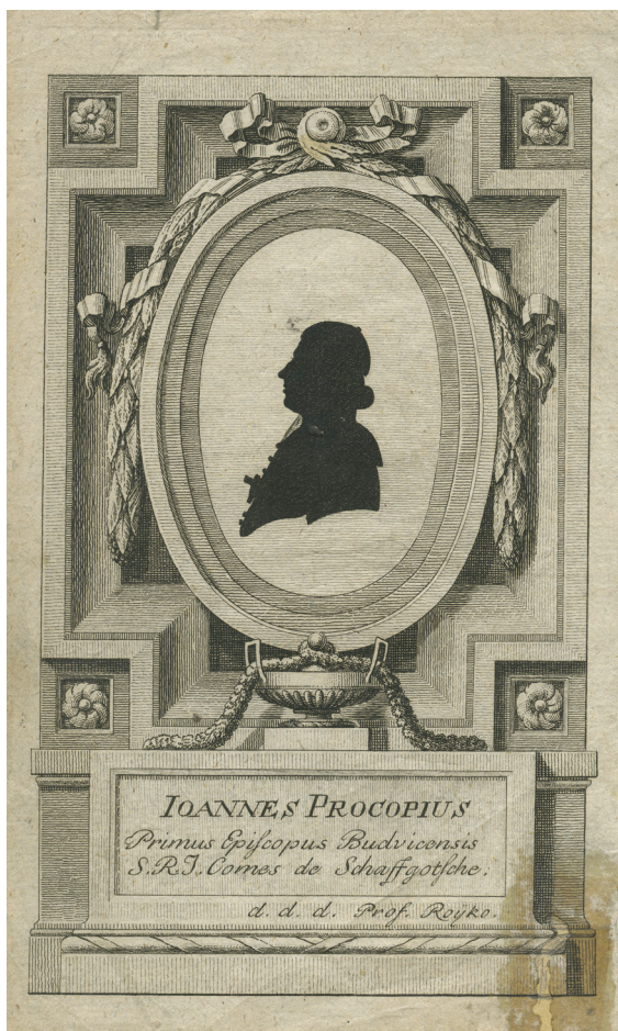
Obrázek 9 – Jan Jiří Balzer [připsáno], silueta Johanna Prokopa Schaaffgotsche (1748–1813), prvního českobudějovického biskupa, po roce 1784, mědirytina, 11,5 x 18,6 cm, Národní muzeum, inv. č. H2-33.630.

Kolekce siluet Národního muzea, z nichž zde mohla být představena pouze část, poskytuje velmi plastický přehled umění portrétních siluet – z hlediska užitých technik, námětů, kompozic, i z hlediska doby jejich vzniku. Díky kvalitě zpracovaných inventárních karet jsme v mnoha případech obeznámeni se způsobem akvizice siluet, z nichž si lze udělat alespoň rámcovou představu o postupném budování kolekce. V souladu s posláním Národního muzea byly prioritně shromažďovány portréty českých intelektuálů a stoupců národního obrození (Matyáš rytíř Kalina z Jäthensteinu, Josef Dobrovský, František Palacký). Hod-