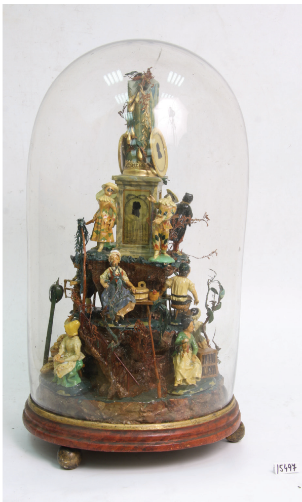
Obrázek 7 – Stolní ozdoba se siluetami, konec 18. století, verre églomisé, papírmaše, celková výška objektu přibližně 45 cm, Národní muzeum, inv. č. H2-15.497.

velmi precizně provedených podobizen se specificky ztvárněným rostlinným dekorem je další ukázkou, jakým způsobem lze mezi siluetami vysledovat jednotlivé mistry, ačkoli zůstávají jejich jména v anonymitě. Díky shodnému provedení těchto ornamentů je možné propojit exempláře z NM se shodně provedenou siluetou z Národní galerie (DK 4.653). S obdobně kvalitními díly se setkáváme v tvorbě Franze Zimmerhakela aus Hünerwasser, jak autor signoval svou produkci. Pocházel z Kuřívod, jež jsou dnes součástí města Ralsko (německy Hühnerwasser). V Národním muzeu se nachází dva protějškové závěsné medailony dámy a pána (H2-159.339-159.340). 28 Profily jsou monochromně černé, zatímco oděv je šrafován. Kolem poprsí je malovaný černo zlatý pásek ze soustředných terčíků. Na rubu