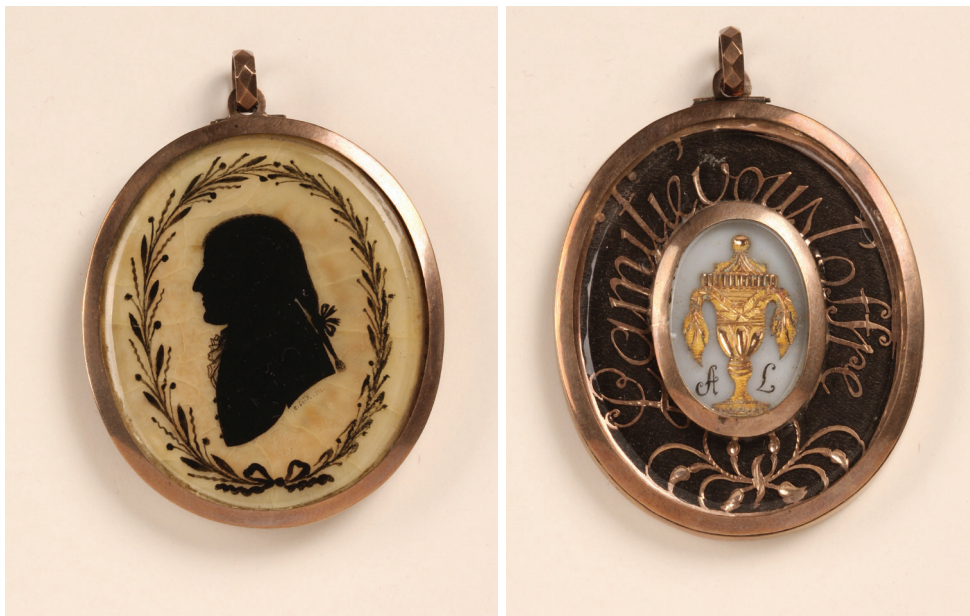
Obrázek 4 – Oboustranný medailon se siluetou muže, konec 18. století, podmalba na skle podložném voskem a kovové aplikace, přibližně 5,5 x 4,5 cm, Národní muzeum, inv. č. H2-195.073.