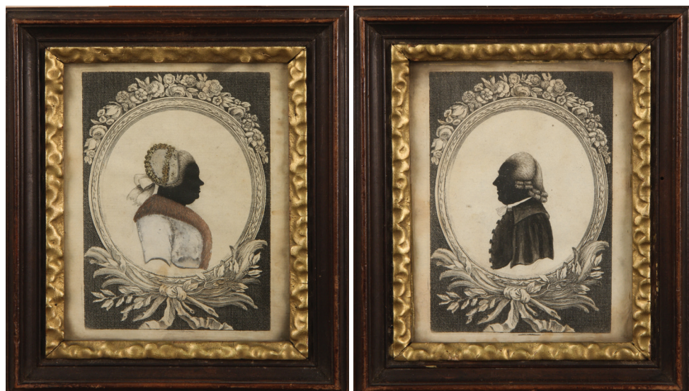
Obrázek 8 – Protějškové siluety manželského páru, kolem roku 1800, tuší a kvašem malované siluety v grafickém orámování, 14 x 12 cm, Národní muzeum, inv. č. H2-182.165 a H2-182.166.