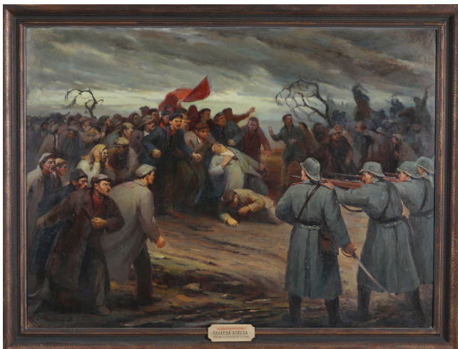
Obr. 1. Oldřich Lušovský, Škaredá středa na Mostecku – Střelba do stávkujících 1932, olej na plátně, 50. léta 20. století, Národní muzeum, H11U-100. Jeden z tematických obrazů byl podle typu popisky (písmomalířsky psaný text na papírové cedulce umístěné na rámu) součástí první expozice Muzea Klementa Gottwalda (otevřena roku 1954).

ce byla spojena s jeho osobou až v období normalizace. 4 Původně Museum revolučního hnutí bylo přejmenováno roku 1953 (rok po svém založení a rok před otevřením) v rámci rozhodnutí o opatřeních k uctění památky zemřelého soudruha prezidenta. 5 Ovšem zadání obsahu expozic zůstalo stejné. Jen navíc připravili kopii Gottwaldovy prezidentské pracovny. 6 Ústřední stranická muzea (MKG a Muzeum V. I. Lenina v Praze) byla specializovanými institucemi komunistické strany. 7 Z toho plynoucí výhody vlivu a finančního zajištění provozu i realizace instalací ve vysokém standartu, negativně vyvažoval politický vliv na obsahy prezentací i personální obsazení. Podklady pro muzeum prezentovaná témata zajišťovaly především vědecké ústavy. 8 Muzeum mělo výsledky výzkumu prezentovat veřejnosti, být vzdělávacím médiem. Bez ohledu na posun od konceptu obhajoby „nového“ výkladu dějin s obsáhlou sondou do revolučních tradic v letech padesátých až po důraz na prezentaci socialistického vývoje nejnovější doby v závěrečných desetiletích existence, si toto ústřední stranické muzeum drželo jako prioritu ideové a politickovýchovné funkce své činnosti. A svými konzultacemi pro regionální památníky a muzea se více či méně úspěšně snažilo být metodickým pracovištěm novodobých dějin. V případě MKG platí, že sbírky byly materiálem propagandistických a politickovýchovných cílů plněných ponejvíce skrz expozice, které vy-