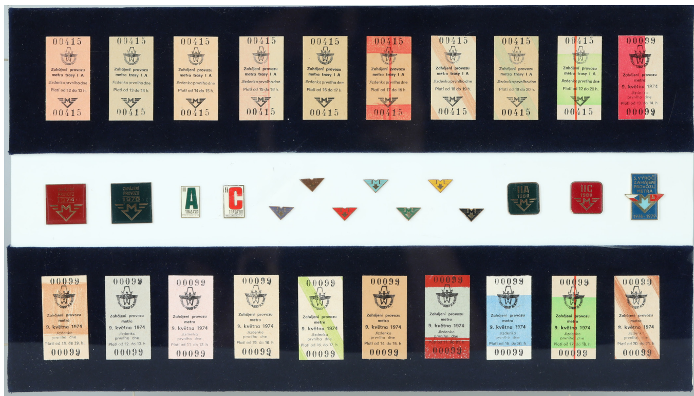
Obr. 5. Panel z expozice Muzea Klementa Gottwalda, jízdenky a odznaky metra v Praze, papír, kov, samet, plast, 1974, Národní muzeum, H11E-96, Ukázkový typ plexi výstavního panelu z nové expozice Muzea Klementa Gottwalda s dobovými předměty pořízenými účelově do expozice otevřené v roce 1974 k prezentaci tématu rozvoje dopravy v socialistickém Československu.

sové agendy je zřejmé, že sbírkotvorná činnost nebyla mezi prioritami muzea „nového typu“. Jeho těsné semknutí s ÚD KSČ, zvláště archivem a knihovnou, vytvářelo dostatečnou základnu pro vznik první expozice, jež byla předmětově doplněna akvizicemi z velkých poúnorových výstav (Výstava dějin revolučních bojů, Třicet let KSČ), akvizičních akcí ÚD KSČ a pro expozici vyrobenými modely a prvky, a též uměleckými díly – vzešlymi převážně ze soutěže na výzdobu muzea. 15 V počátcích muzea, kdy se potýkalo především s nedostatkem personálu a většina kapacit byla směřována k lektorské práci, nebylo třeba v jeho provozu zajišťovat systematické doplňování sbírek a práci s nimi. Jedním z potvrzení reálného přenesení akviziční činnosti na ÚD KSČ je i výzva z doby příprav první expozice MKG „Pomozte budovat Museum Klementa Gottwalda“, kde je uveden kontakt na Archiv ÚD KSČ. 16 Že nešlo o provizorium před otevřením muzea je zřejmé i v následujících letech, kdy archiv ústavu plnil roli pramenné základny pro dějiny KSČ a souvisejících témat, a materiály používal kromě prezentací v MKG 17 především pro vědeckou a publikační činnost (k dějinám KSČ a edicím díla Kl. Gottwalda).