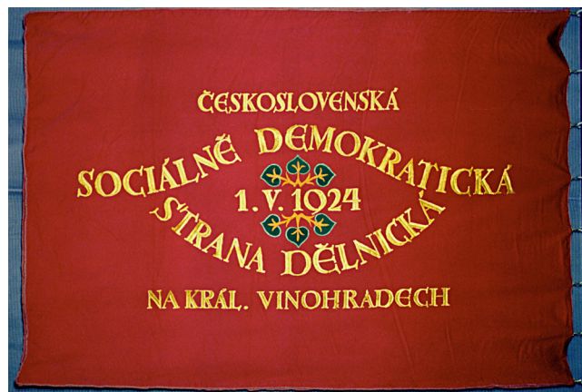
Obr. 3 a 4. Prapor, Československá sociálně demokratická strana dělnická na Královských Vinohradech, 1. 5. 1924, plátno s výšivkou, Národní muzeum, b. č. (v evidenci Muzea dělnického hnutí o. p. s. TP 100)

ti tohoto textu. Určité náhledy do expozic nabízí i trojice rozebraných témat, protože právě expozice byly hlavním „prostředkem“ činnosti muzea. Pro představu a doplnění souvislostí je důležité upozornit, že MKG měla první expozici z roku 1954 a pak kompletně novou normalizační, otevřenou roku 1974. Obě expozice procházely neustálou dílčí či rozsáhlejší reinstalací dle aktuálních zadání stranického aparátu. Co do obsahu prezentovaného materiálu odrážejí zjištění z trojice rozebíraných zdrojů – převládá dvojrozměrný materiál, který je doplňován předměty (originály, faksimiliemi, kopiemi), uměleckými díly či audiovizuálními prvky, dle požadavků a technických možností doby. Ve Sbírci se zachovala i celá řada trojrozměrných předmětů, která zcela jistě z řady důvodů nebyla nikdy v expozici prezentována (nežádoucí obsah, nekvalitní ztvárnění, neupotřebitelnost apod.) a naopak obsahuje unikátní kolekci artefaktů pořízených přímo pro expozice – především tu první z roku 1954 (výtvarná díla, modely, výstavní panely ad.). 10 Tento typ „účelových“ akvizic nám však nevypovídá o průběžném procesu sbírkotvorné činnosti muzea ani jeho koncepcích. I když jsou samozřejmě součástí doplňování expozic a výstav muzeí dodnes a s časovým odstupem se stávají cennou ukázkou dobového výstavnictví a jsou zařazovány do fondů. Stejně tak ve Sbírci najdeme artefakty darované do MKG od osobností nebo orgánů KSČ, tedy nevyžádané akvizice, až na jednotliviny spíše nevhodné k využití v muzejní prezentaci.