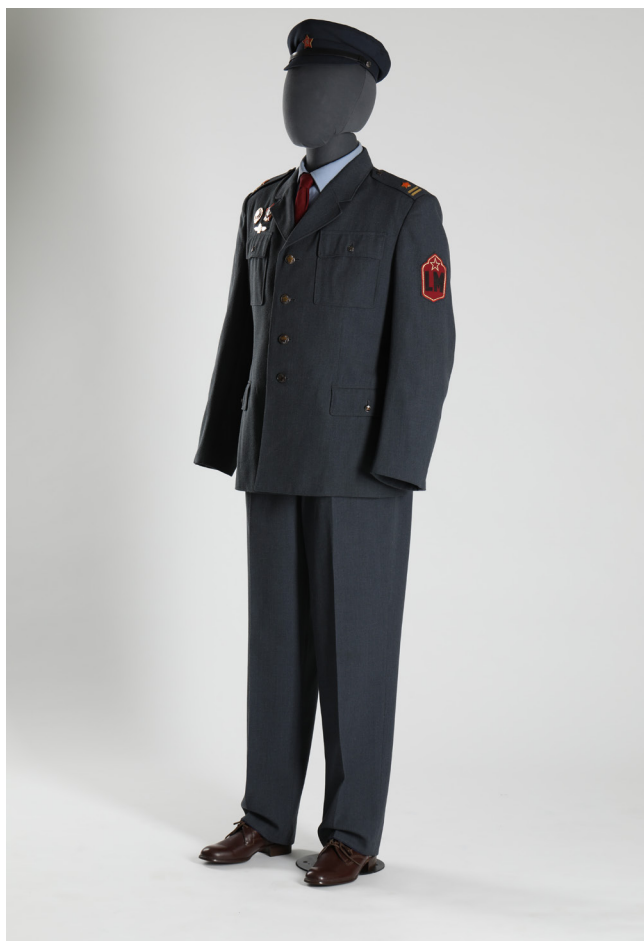
Obr. 8. Uniforma příslušníka Lidových milicí, textil, kov, kůže, guma, 2. polovina 20. století, Národní muzeum, H11M-211. Ukázka akvizice od organizace – nošené i nové uniformy, pro prezentaci v expozici a výstavách.

O dokumentaci současnosti. Řešení uvedených problémů je dlouhodobou záležitostí a spočívá v důsledném rozboru vy-povídací hodnoty každého sbírkového předmětu, jejich vy-třídění a vyčlenění těch předmětů, jejichž zaměření neodpo-vídá statutu muzea. Početní rozsah jednotlivých sbírek a ne-dostatečné kádrové [personální – pozn. autorky] obsazení je a bude i do dalších let rozhodujícím limitujícím faktorem při řešení těchto úkolů. 24 Toto pro interní účely vzniklé dobové shrnutí celkem výstižně zachycuje jednotlivá úskalí a problémy sběrného programu, trvající v zásadě po celou dobu fungování MKG. Oproti předchozím obdobím je narůstající aktivita přístupu k uspořádání a revizi sbírkových fondů ve druhé polovině 80. let 20. století zřejmá též ze zá-pisů o inventarizacích, 25 návrhů schémat pro řazení fotogra-fii ve fotoarchivu 26 a korespondence spojené s převáděním