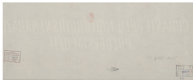
Obr. 6 a 7. Plakát, Masarykova liga proti tuberkulóze – Chraňte před tuberkulosní nákazou především děti, tisk na papíře, podlepeno plátnem, 1947, Národní muzeum, H11P-1025. Na reversu (obr. 7) jsou evidenční značení předmětu s razítky Národní a univerzitní knihovny v Praze a Musea (Muzea) Klementa Gottwalda.

zice otevřené roku 1974. Zvýšenou aktivitu v tomto úseku činnosti muzea lze dovodit i ze vzniku brožury s prezentací témat sbírkotvorné činnosti, která téma prezentovala veřejnosti, tedy především vně instituce. 20