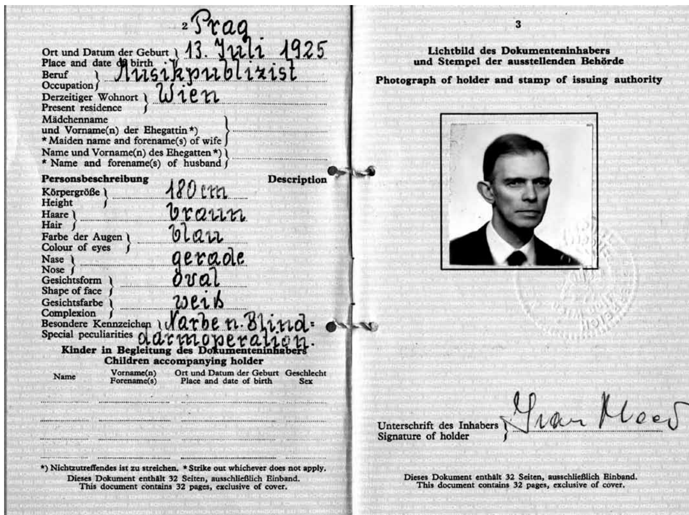
Rakouský cestovní pas, 1978. Soukromá sbírka.