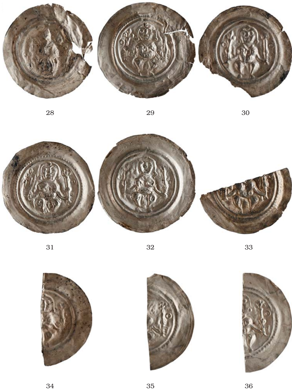
Obr. 2d. Bořanovice – mince zastoupené v depotu (čísla odpovídají katalogu; 1:1).