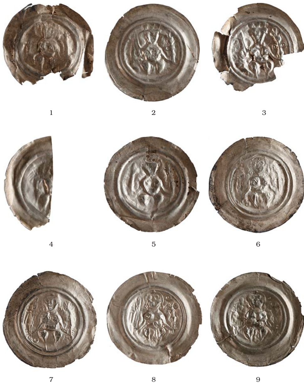
Obr. 2a. Bořanovice – mince zastoupené v depotu (čísla odpovídají katalogu; 1:1).