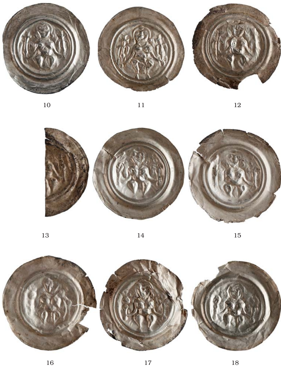
Obr. 2b. Bořanovice – mince zastoupené v depotu (čísla odpovídají katalogu; 1:1).