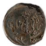
Obr. 2e. Bořanovice – mince zastoupené v depotu (čísla odpovídají katalogu; 1:1).