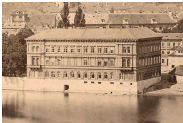
Obr. 5. Lichtenštejnský palác na Kampě (Odkolkův dům) z pohledu od Vltavy, provizorní sídlo pražské polytechniky v 60. letech 19. stol., (snímek 70. – 80. léta 19. stol.).

Počátek společného angažmá Josefa Zítka a Josefa Schulze na pražské polytechnice byl poznamenán prostorovou nouzí. Roku 1864 vyjednal rektor Josef Tadeáš Lumbe (1801–1879) pro reorganizovaný polytechnický ústav sídlící v nedostačujících prostorách budovy v ulici U Dominikánů