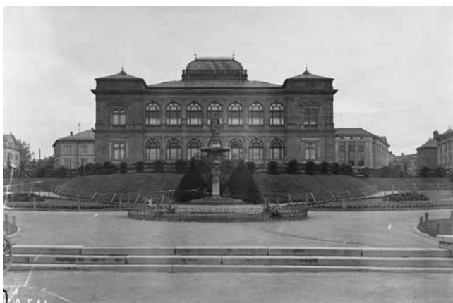
Obr. 4. Muzeum ve Výmaru 1910-1935, Bilddatei-Nr. fm820275.

korespondence s rodiči vyplývá, že oba zdrželo ve Vídni vyčkávání na oficiální potvrzení Zítkova profesorského jmenování ve formě nejvyššího rozhodnutí. 31