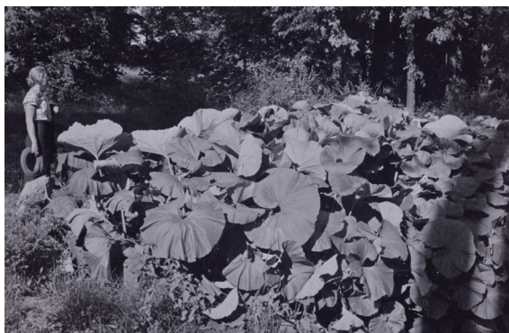
Obr. 7. Listy japonského devětsilu na hrázi Suchého rybníčku v parku.