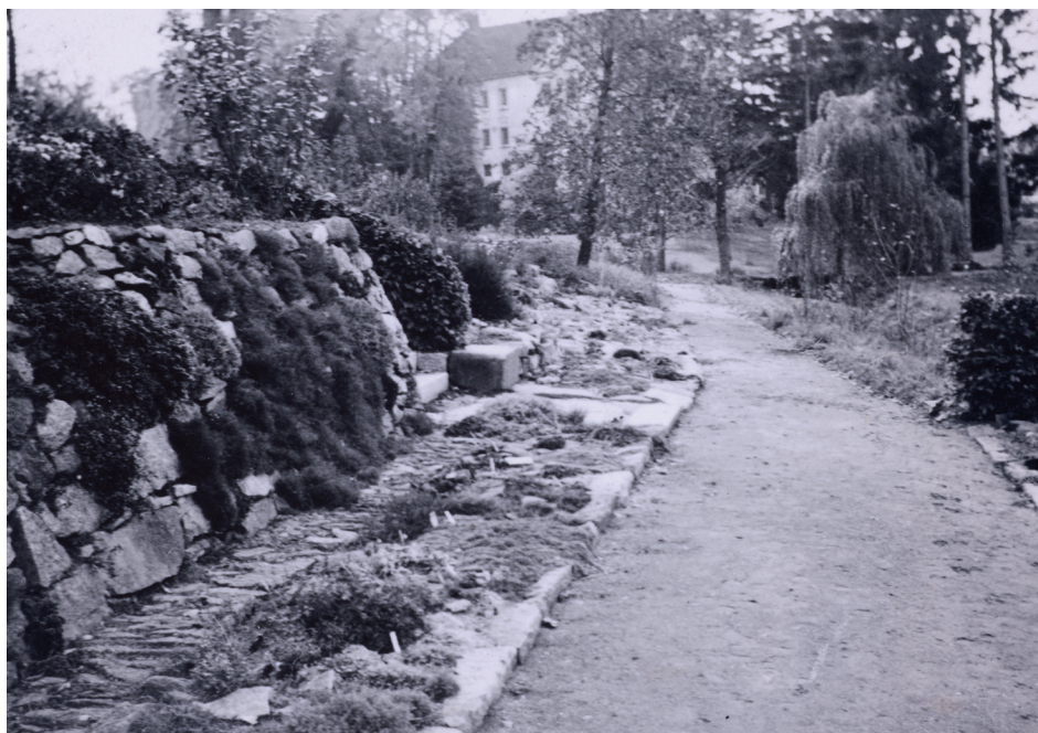
Obr. 11. Pohled od teras pod skleníkem k zámku. SOA Praha, Vs VJ, ič. 1068, sign. IV/4-1. Foto: Jožka Šok, 1933.