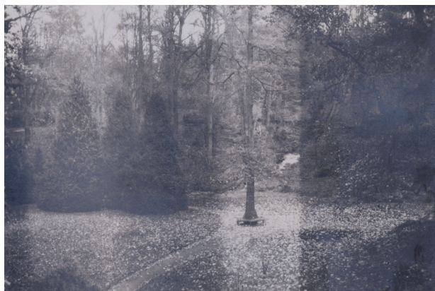
Obr. 3. Lavička kolem dřezovce na louce pod zámek, podzim 1918.

Karel Nádherný, 22 který po smrti staršího bratra musel opustit svou nedávno nastoupenou právníkovou praxi a postarat se o správu velkostatku, měl tehdy spoustu starostí s probíhající pozemkovou reformou a mohl tedy parku věnovat méně času. Sidonie se ale do jeho zvelebování pustila s velkou chutí a odhodláním.