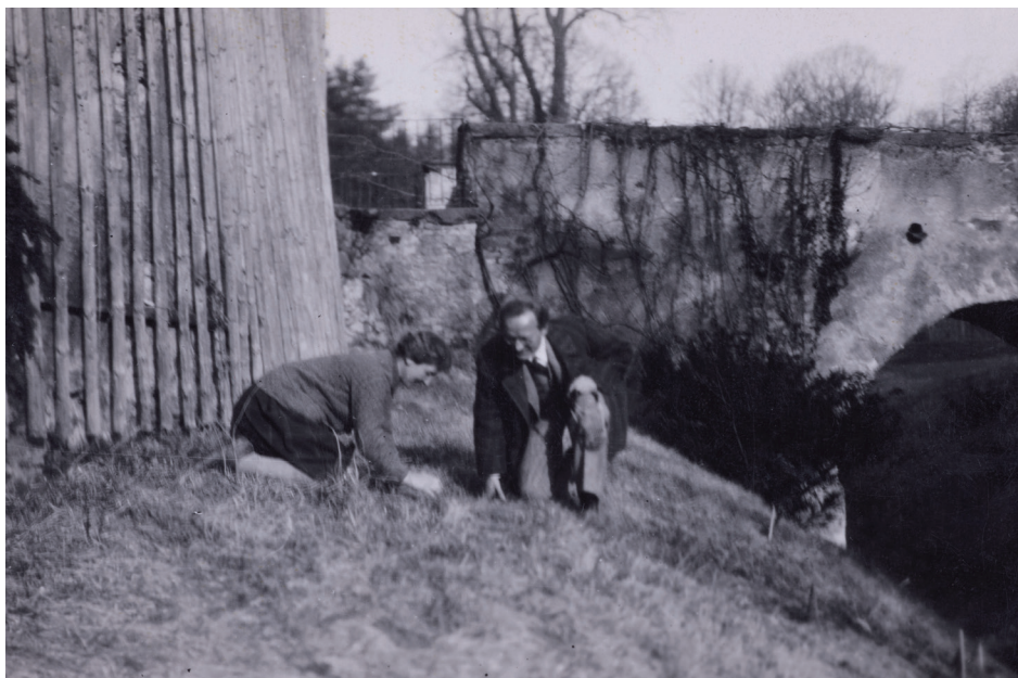
Obr. 10. Sidonie a Karel Nádherný objevili první jarní taloviny na jižním svahu před zámkem. SOA Praha, Vs VJ, ič. 1070, sign. VI/4-39. březen 1930.